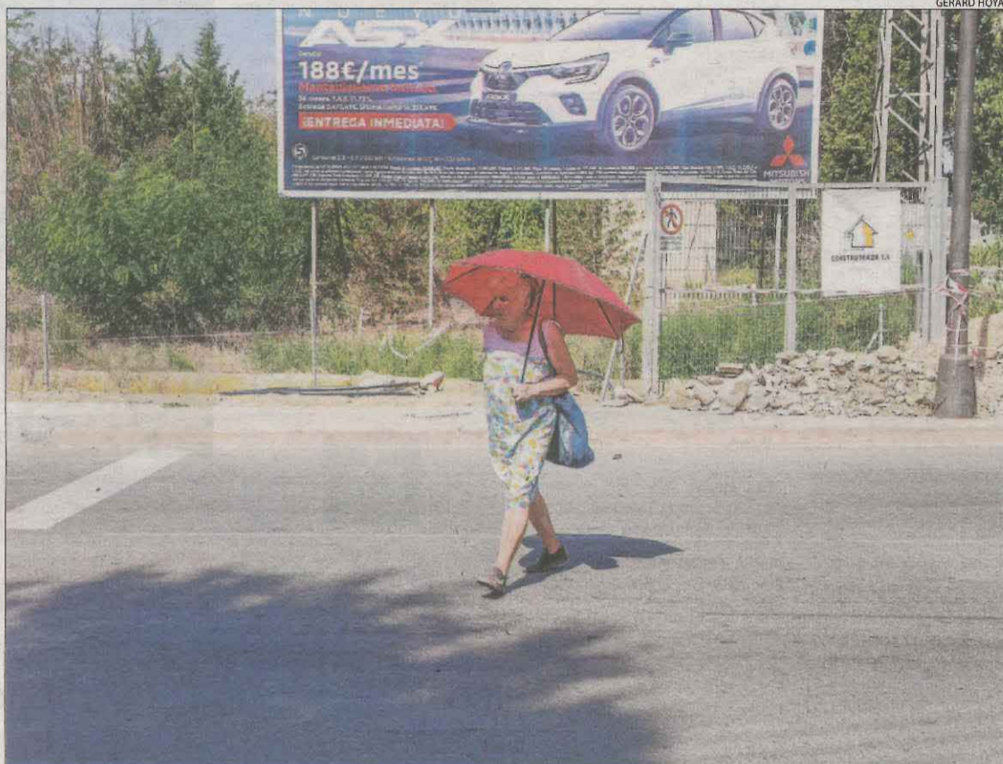
Una dona es protegia ahir del sol amb un paraigua a Lleida ciutat.

Sant Romà d'Abella, al Jussà, va marcar ahir la màxima més elevada de Catalunya amb 35,4°