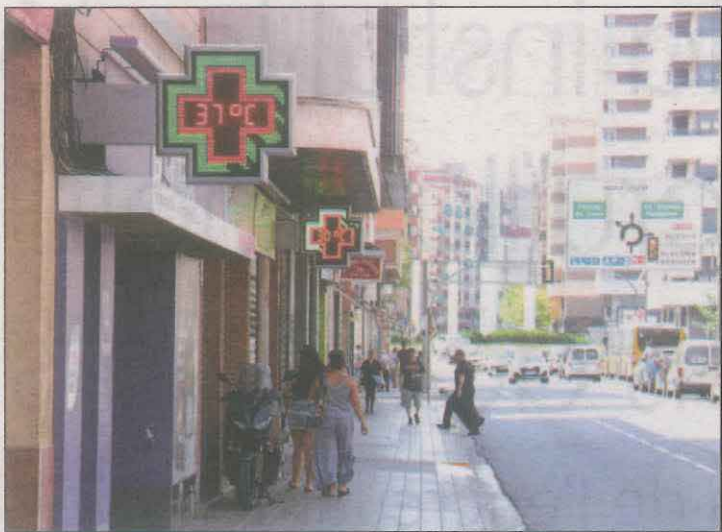
Dos termòmetres al barri de Balàfia