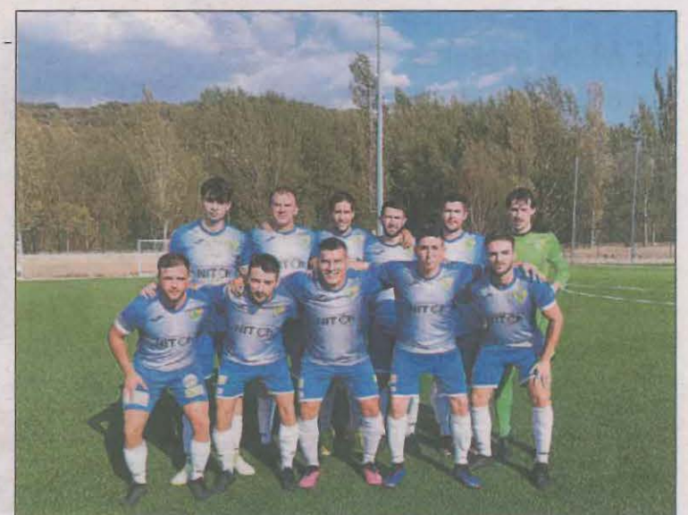
La Seu d'Urgell, obligado a remontar en la vuelta (5-3)