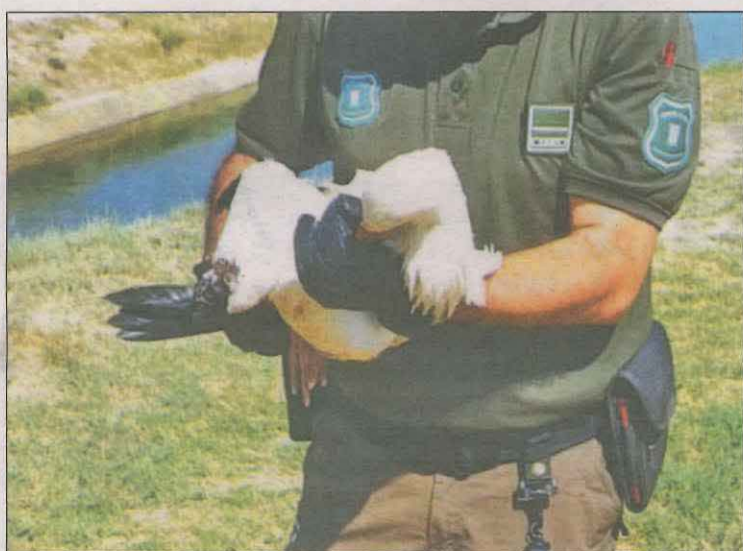
Un efectiu dels Agents Rurals sosté la cigonya ferida

Els Agents Rurals van recollir ahir una cigonya ( Ciconia ciconia ) a Ivars d'Urgell (Pla d'Urgell) gràcies a l'avis d'un ciutadà. L'animal no podia aixecar el vol perquè tenia una ala trencada. Davant aquesta situació, els efectius del cos van traslladar aquesta au protegida al Centre de Fauna Vallcalent, del Departament d'Acció Climàtica, per a la seva recuperació.