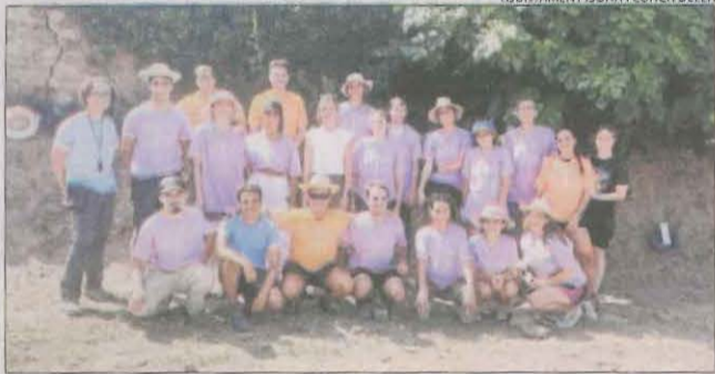
AJUNTAMENT ISONA I CONCA DELLA

La Fundació Comunitària Raimat Lleida va entregar ahir els diplomes a la primera promoció de nou alumnes del curs de tractoristes que ha promogut gràcies al Raimat Arts Festival.