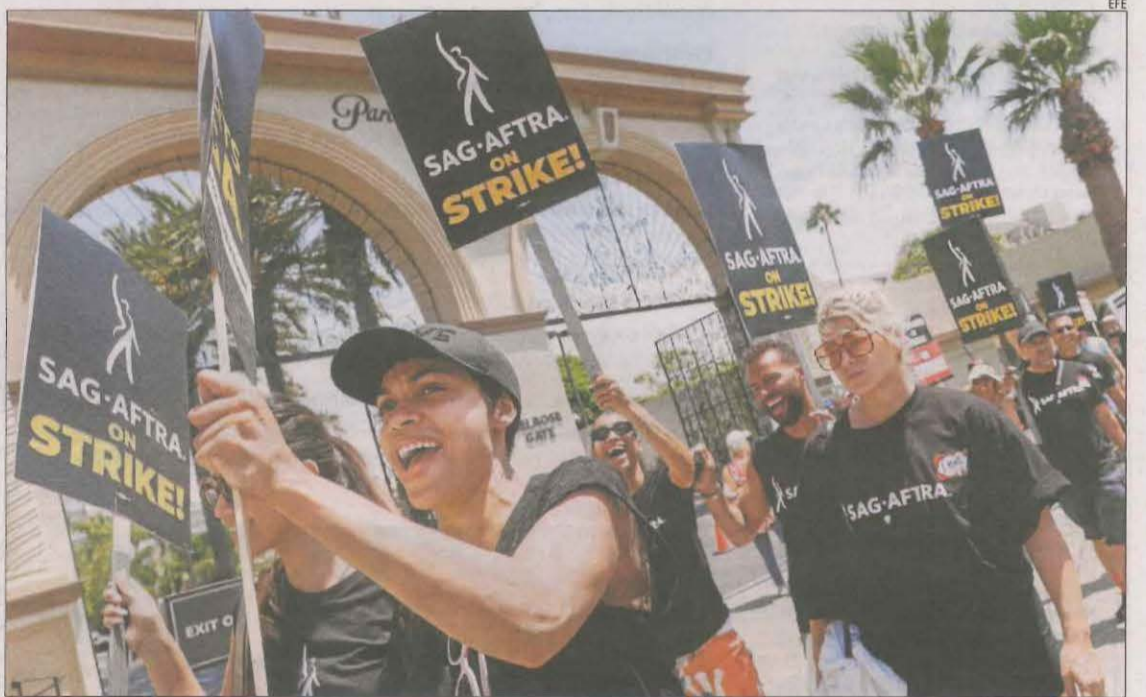
Rosario Dawson ('Sin City', 'Men in Black II'), protestant davant dels estudis Paramount a Los Angeles.

Paral·lelament es van portar a terme piquets als afores de les oficines dels grans estudis de Nova York i Los Angeles i entre els actors que van desfilar per les manifestacions van ser-hi