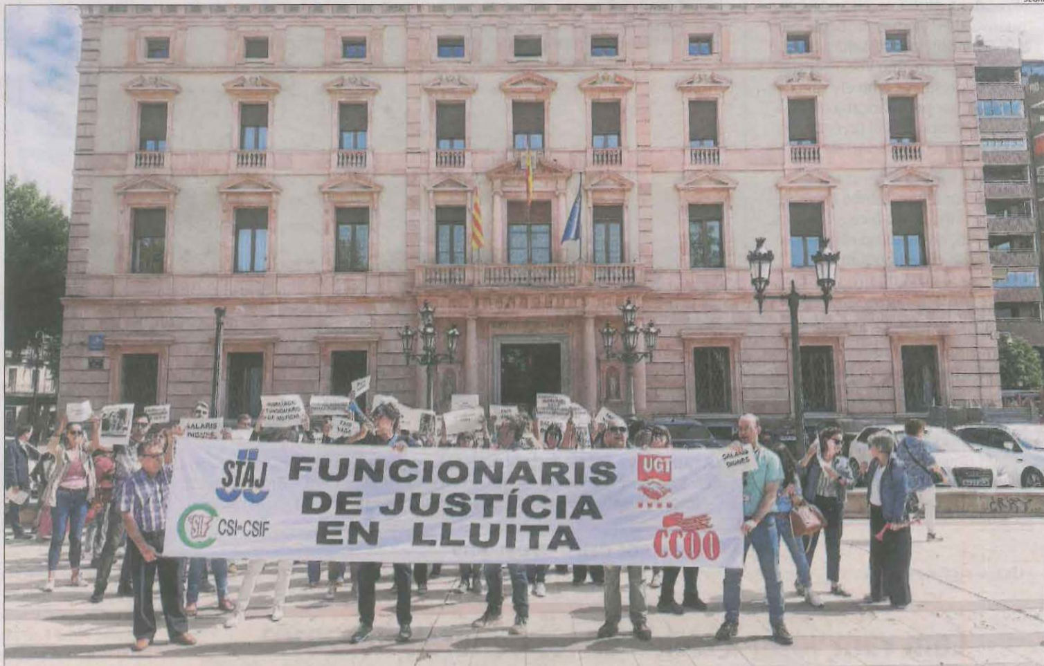
Imatge de la protesta dels treballadors de l'administració de Justícia a Lleida al maig davant la subdelegació del Govern.

A finals de l'any passat, aconseguir cita a la Seguretat Social de Lleida era una missió impossible per als usuaris de les comarques del pla, que per trami-