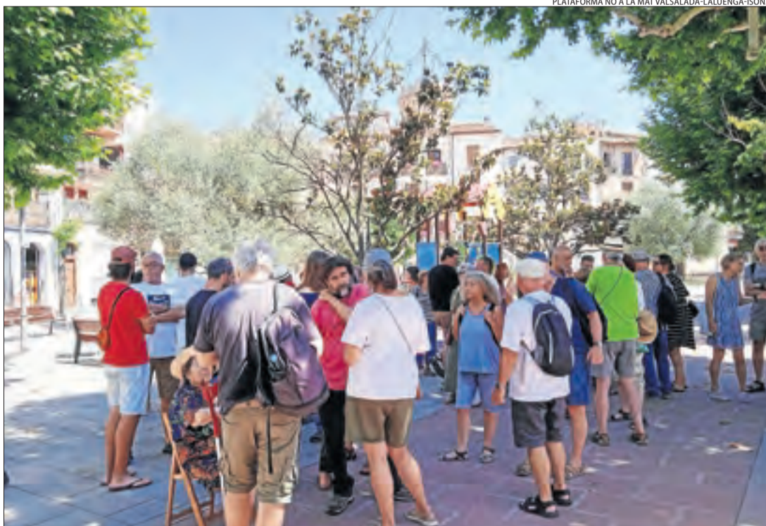
La concentració a Tremp la va fer la plataforma No a la MAT Valsalada-LaLuenga-Isona.