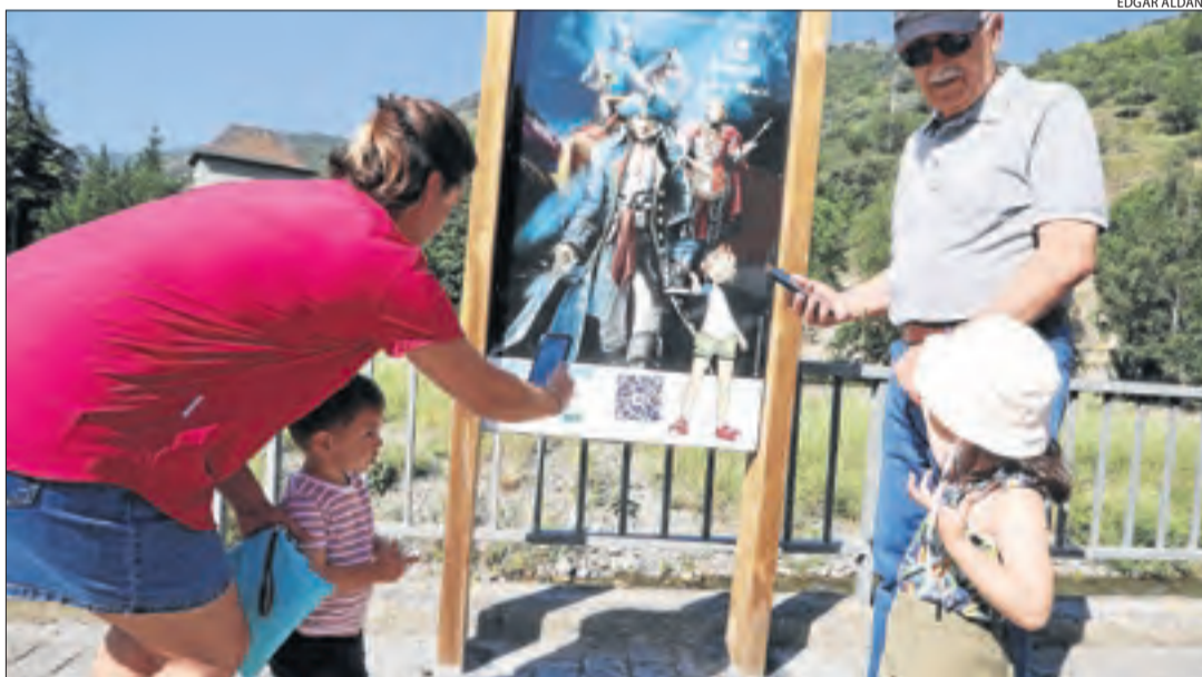
El plafó informatiu que inicia el nou recorregut per conèixer el municipi.