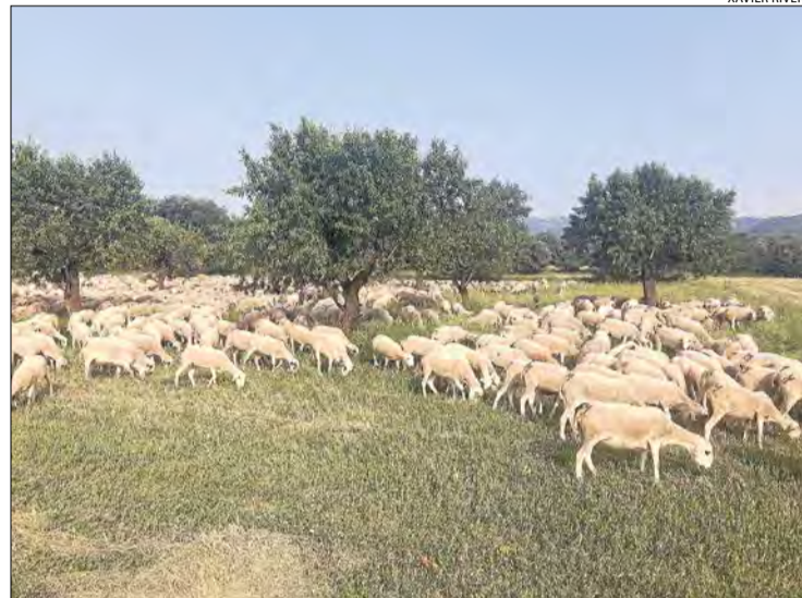
Ovelles pasturant en un prat afectat per la falta d'aigua.