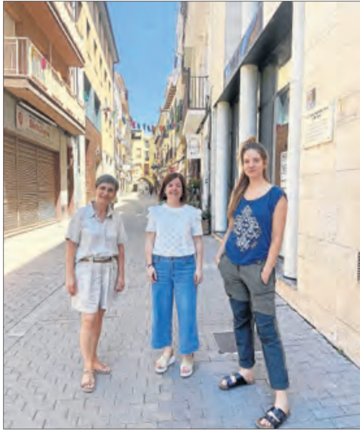
ERC va fer campanya ahir a Tremp.

Així mateix, les candidates republicanes van visitar l’Ateneu del Pallars, recuperat a tra-