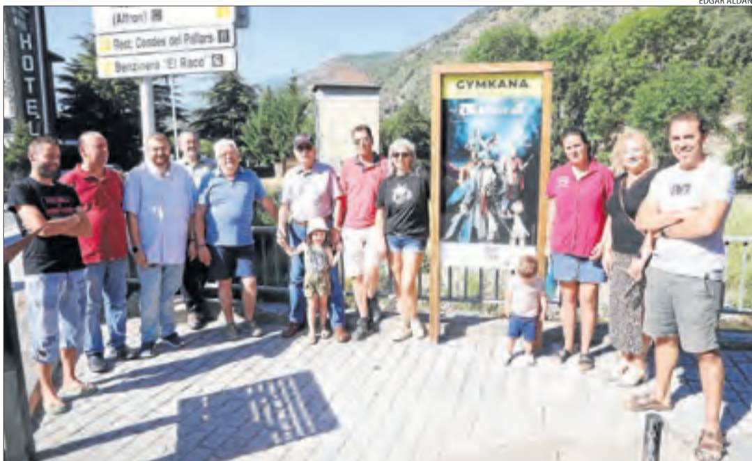
La inauguració de la ruta La decisió d'en Matxicot, ahir a Rialp.

D'aquesta manera, Rialp s'afegeix a altres localitats de Lleida que també compten amb aquestes gimcanes digitals. És el cas de Les, Bossòst, Naut Aran o Alins. A l'Espluga Calba en va estrenar fa dos anys una app de realitat augmentada que permet conèixer el poble.