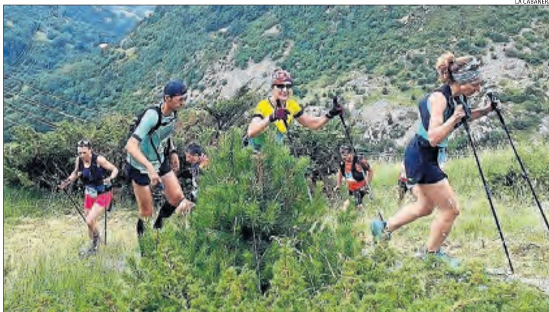
La prova va congrega 200 participants per les muntanyes de la vall Fosca.