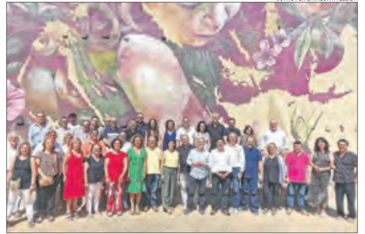
Gavín i Turull, amb alcaldes de Junts i Impulsem ahir a Alcarràs.