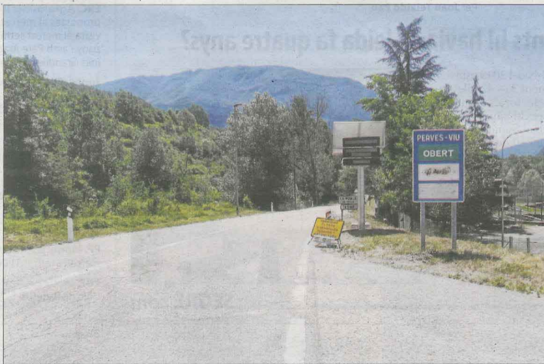
Imatge d'arxiu del port de Perves, al Pont de Suert.

el 23-J haurà d'acordar amb la Generalitat com prioritzar la inversió i les obres i a quin calendari s'executen les primeres actuacions de reforma de la carretera, que malgrat que tingui qualificació de via nacional, el seu estat de deixadesa està lluny de respondre al nomenclàtor. L'N-260, amb 520 quilòmetres, transcorre entre Portbou (Girona) i Sabiñánigo (Osca).