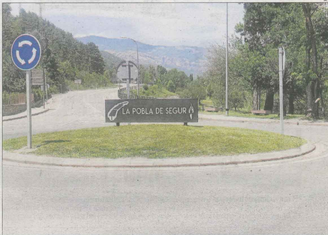
La variant de la Pobla facilitarà la connexió amb la carretera local L-522 i l'N-260.

Els comptes estatals inclouen cada any projectes de millora sense data, promeses que queden al tinter i que no s'han arribat a executar. Cada mandat ha inclòs actuacions de millora de la carretera que han anat quedant obsoletes i amb tramitacions caducades, de manera que seria necessari replantejar-ne l'abast i buscar solucions abordables a més curt termini. El govern que surti de les urnes