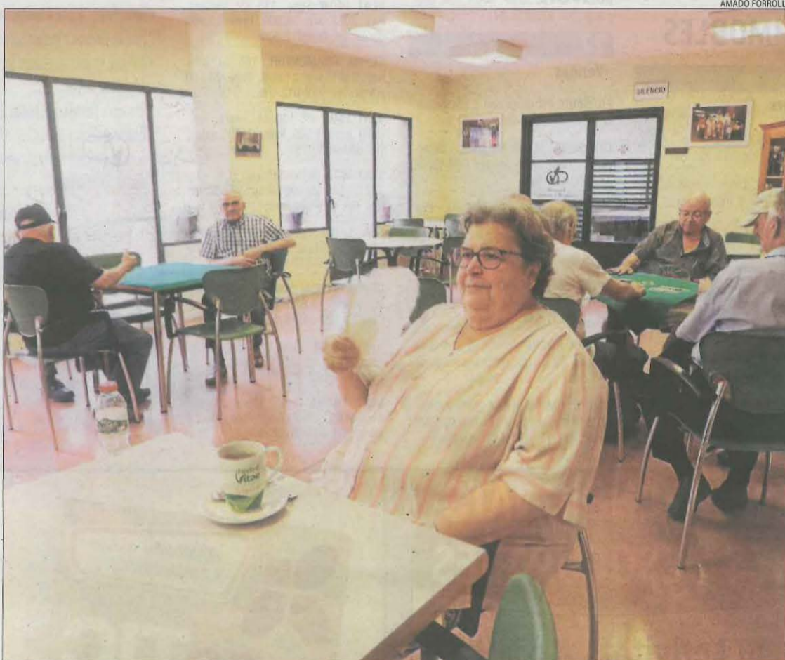
Usuaris ahir al Centre Cívic de Pardinyes, un dels refugis climàtics a Lleida ciutat.