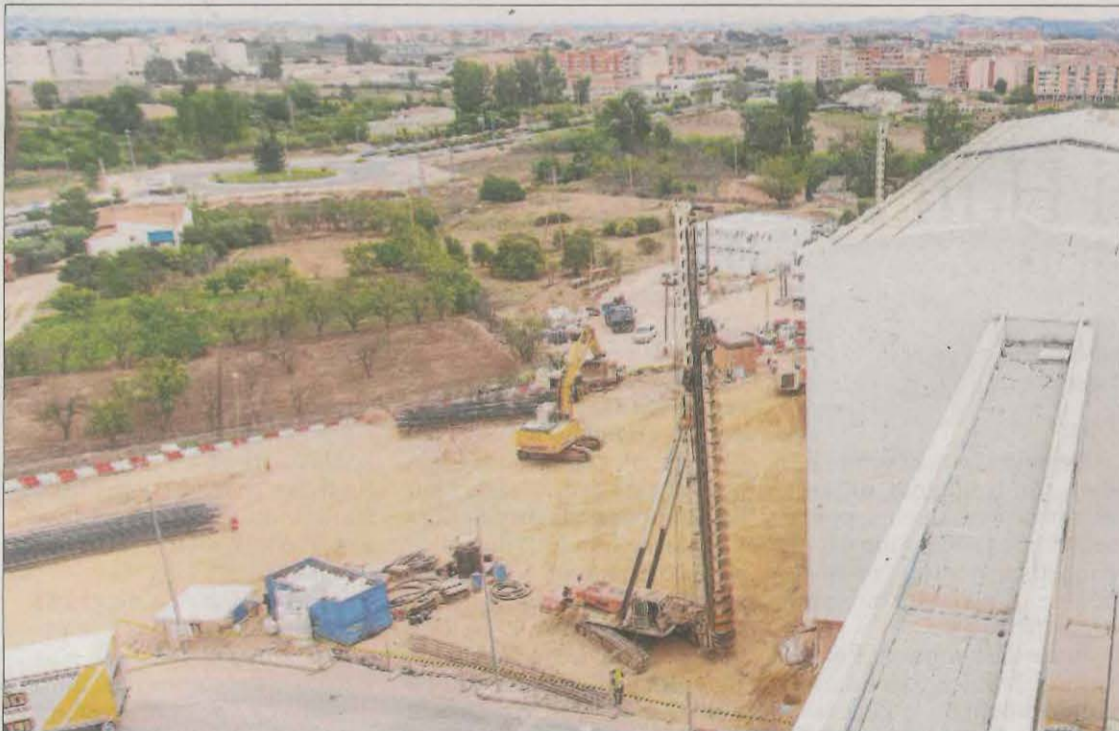
Un hospital gairebé nou. La construcció del nou bloc quirúrgic, a dalt, i de l'edifici de consultes externes, a baix, són les principals obres que s'estan executant a l'Arnau. Entre els dos sumen 71 milions.

la reforma del CUAP de Prat de la Riba. Així mateix, ha sortit a licitació l'ampliació del CAP d'Alpicat amb 5 mòduls. I a nivell de consultoris, està previst un de gran mida a Albatàrrec i gairebé està acabat un altre a la Portella.