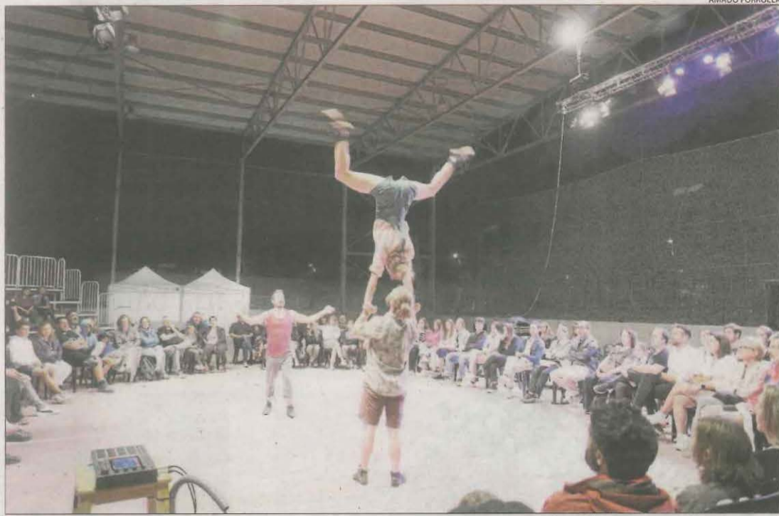
L'espectacle d'acrobàcies 'Encore une fois' de la companyia Tripotes, ahir a Alpicat.