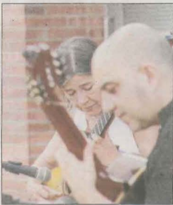
El Soleràs s'estrena al festival, amb l'actuació de Dos Guitar Duo demà dissabte.

Les guitarres tornen a escampar el seu so arreu de les Garrigues a la crida del 12è Festival Memorial Emili Pujol. El Soleràs s'estrena a la iniciativa, sumant-se a una desena de poblacions on destil·laran mestratge formacions com Dos Guitar, Rubio-Them, ZKDUO, Diode, duet Arbonès Caselles, Ensemble XXI, Trio Quetzal o Javier Olondo Quartet, aquest juliol. Desgranaran un repertori que combina melodies tradicionals amb jazz, son cubà o instruments de percussió com el handpan. A més, del 24 al 27 es convoca un campus i el 29 i 30, el certamen internacional.