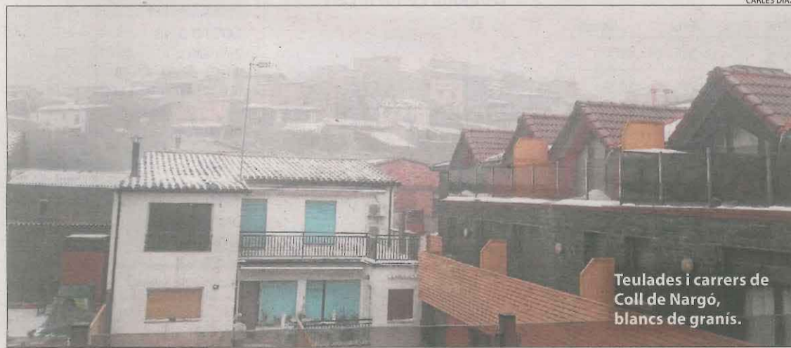
Teulades i carrers de Coll de Nargó, blancs de granís.

'Nevada' de granís en municipis dels Pallars i Alt Urgell