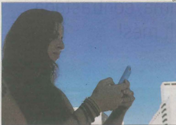
Una dona mirant el mòbil en una imatge d'arxiu.

Ara bé, la normativa recull alguns supòsits en els quals es