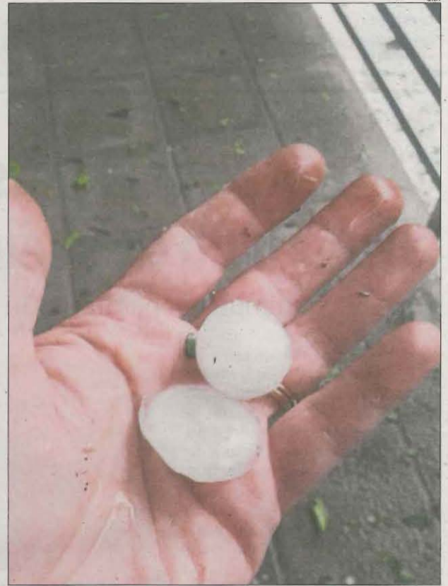
Mida de la pedra a Coll de Nargó.