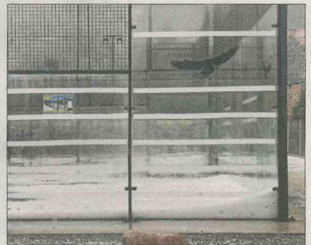
Pedra a la pista de pàdel de la Pobla de Segur.