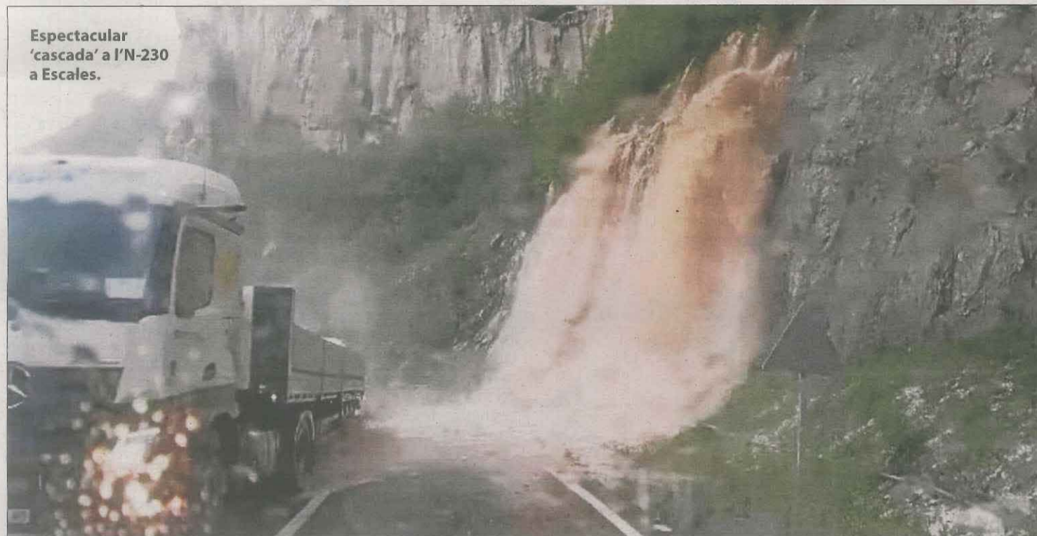
Espectacular 'cascada' a l'N-230 a Escalles.

Registres || Fins a 115 litres, amb carrers negats i una pujada del cabal dels rius