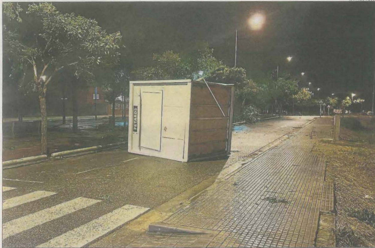
Una caseta de petards bolcada i arrossegada pel vent a Mollerussa.