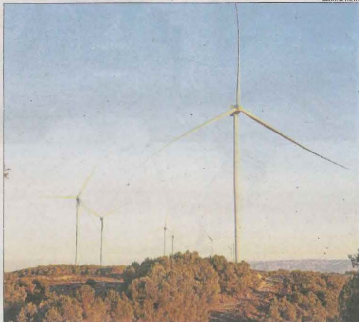
El parc eòlic de Solans, l'últim construït a Lleida.

A les comarques de Lleida, almenys una desena de municipis impulsen canvis en la seua planificació per regular centrals eòliques i solars.