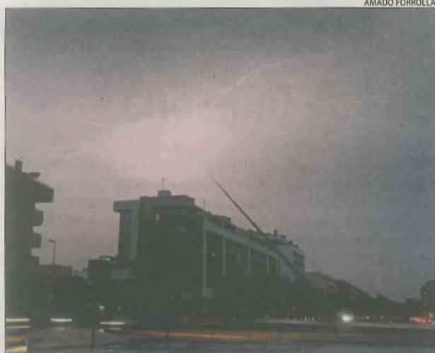
Tempesta de llampecs sobre Lleida al capvespre.