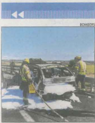
El cotxe, calcinat.