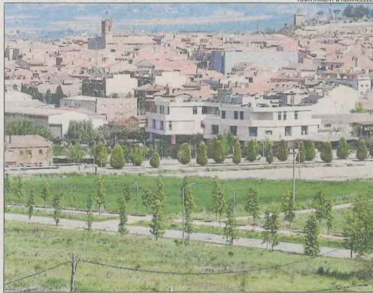
Vistes del municipi d'Almacelles.