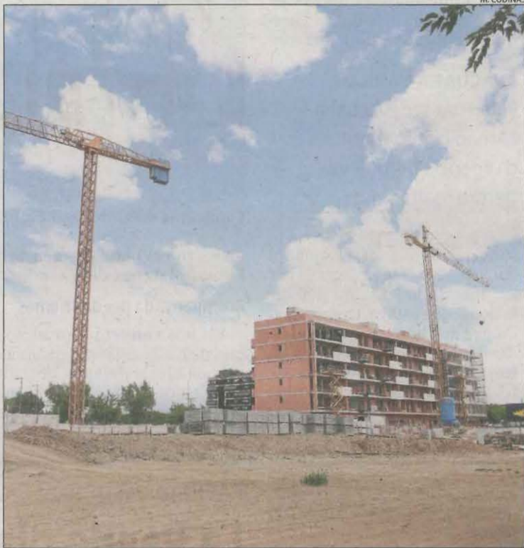
Imatge d'arxiu d'habitatges en obres a Lleida ciutat.