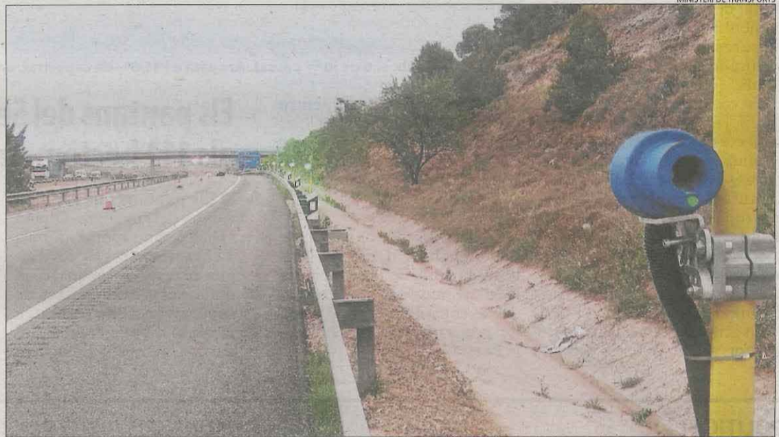
Imatge del sistema làser que s'ha instal·lat a l'AP-2 entre les Borges Blanques i Castellidans.

En el mateix punt però en direcció Saragossa han desplegat balises amb llums verds i ambre. Aquestes últimes s'activen quan detecten la proximitat