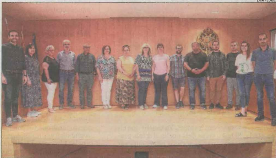
Els regidors del consistori de Tàrraga.