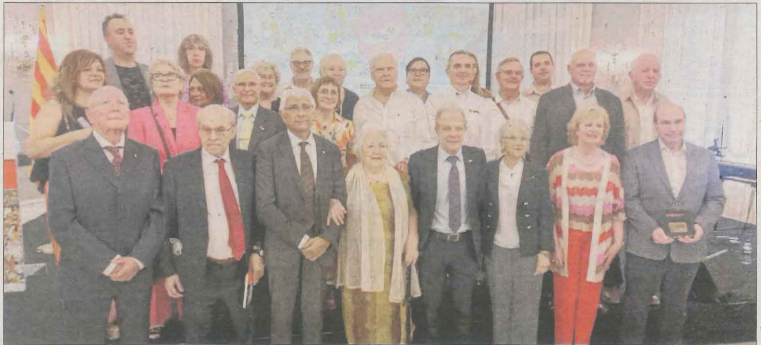
Foto de família dels donants homenatjats ahir al Palau Reial de Pedralbes, a Barcelona.

A la nit, consistoris de tota la província es van il·luminar de roig per celebrar el Dia Mundial.