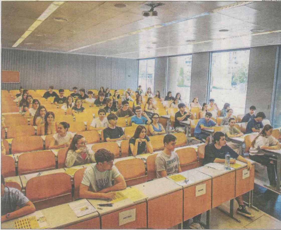
Estudiants esperen l'inici de la selectivitat ahir al campus de Capponet de la UdL a Lleida.

Després de castellà va tocar llengua estrangera, en què els alumnes havien de triar entre francès, alemany, italià i anglès, opció que va escollir la immensa majoria. En aquesta es demanava analitzar un escrit sobre l'auge d'activitats relacionades