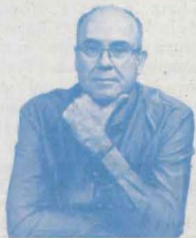
El grup El Pont d'Arcalís canta en pregària "Sant Crist de Conques, abat de Covet, doneu-mos aigua que tenim set"

D'això ara en fa ja tres o quatre diumenges. Havia pujat fins a aquell nucli del municipi d'Isona amb un triple motiu: dinar al nou restaurant Cal Jou, prendre notes per a un Enllà al suplement Lectura sobre l'església local romànica d'altíssima espadanya i el seu crucifix tan realista, a banda de miraculós, finalment aprofitar per