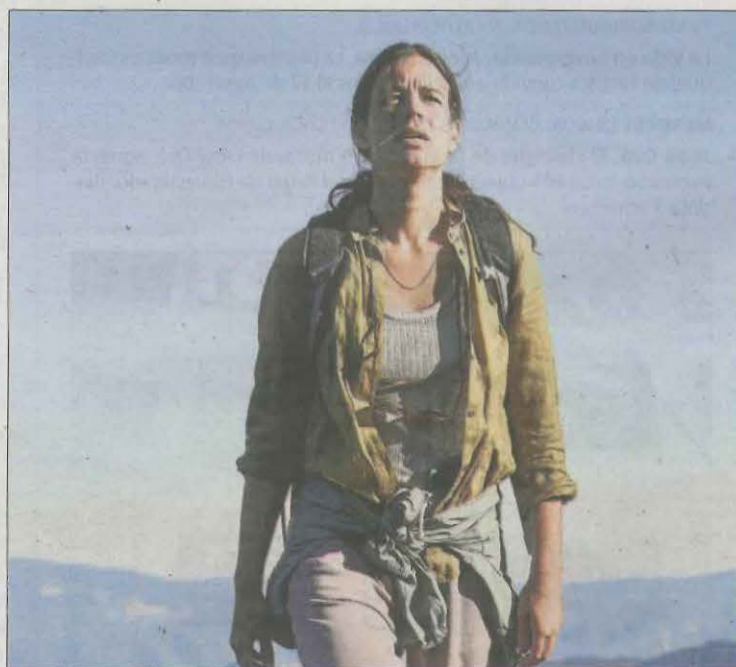
Laia Costa protagonitza 'Els encantats'.