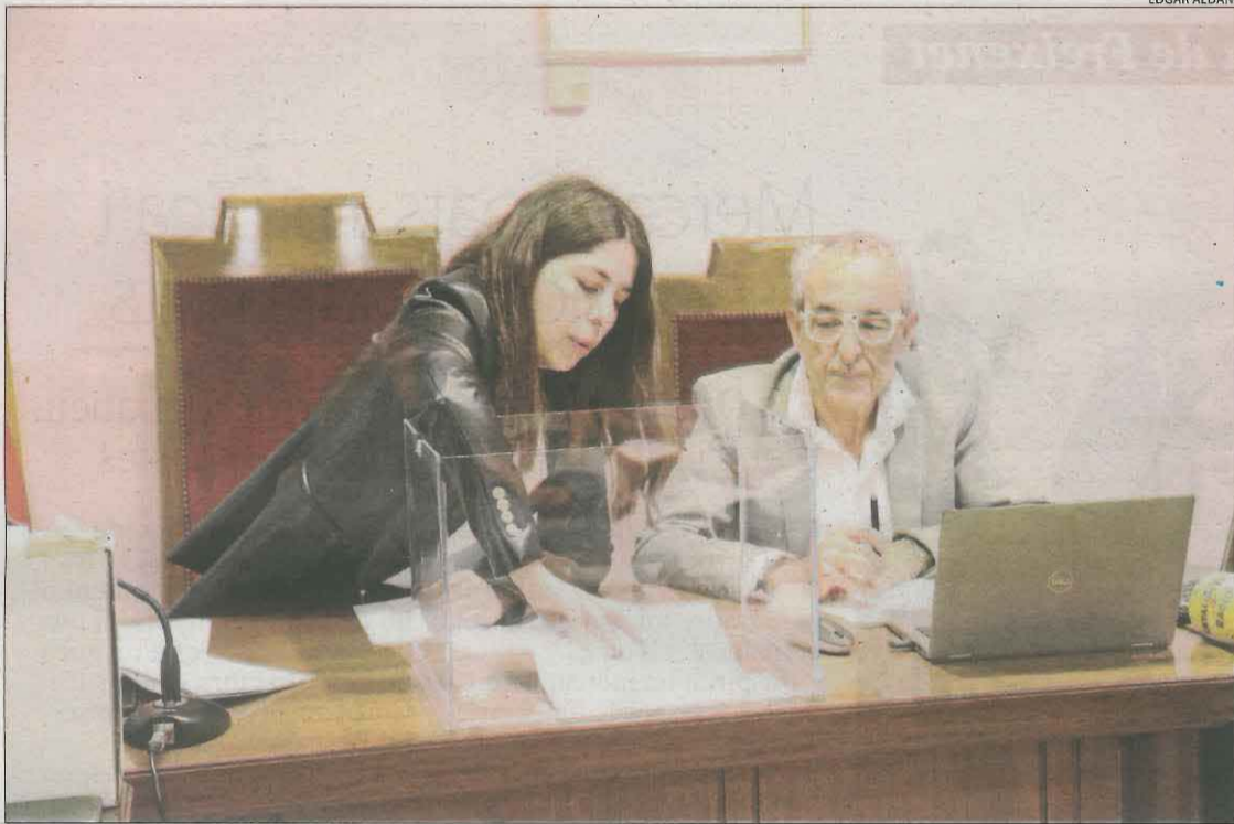
El sorteig del cinquè edil es va dur a terme amb els noms dels candidats en sobres dins d'una urna.