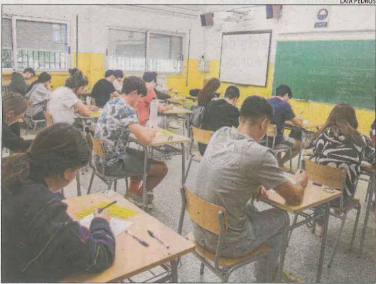
Tàrraga va repetir un any més com a seu de la selectivitat.

amb sèries d'èxit com Stranger Things o Los Bridgeton i escoltar un àudio que tracta sobre els monòlegs d'embarassades. Sobre aquesta prova, els alumnes van criticar la mala qualitat de l'àudio, la qual cosa els va impedir d'entendre conceptes.