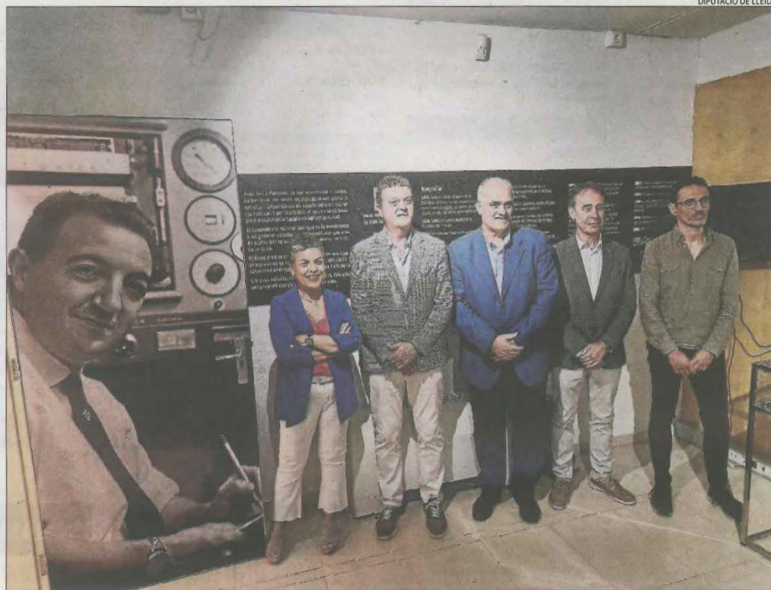
El Museu Joan Oró de Lleida va acollir ahir la presentació d'aquesta ruta.

La ruta proposa conèixer més de cinc-cents milions d'anys d'evolució en tan sols tres dies