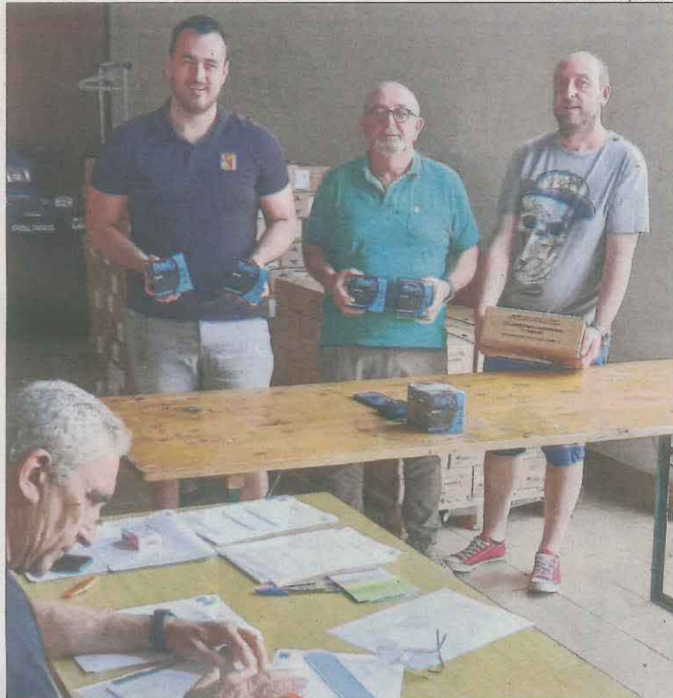
Un moment del repartiment de cartutxos ahir al Pla d'Urgell.

Aquests repartiments de munició s'hauran de repetir en els propers mesos. Subvencionar cartutxos per combatre