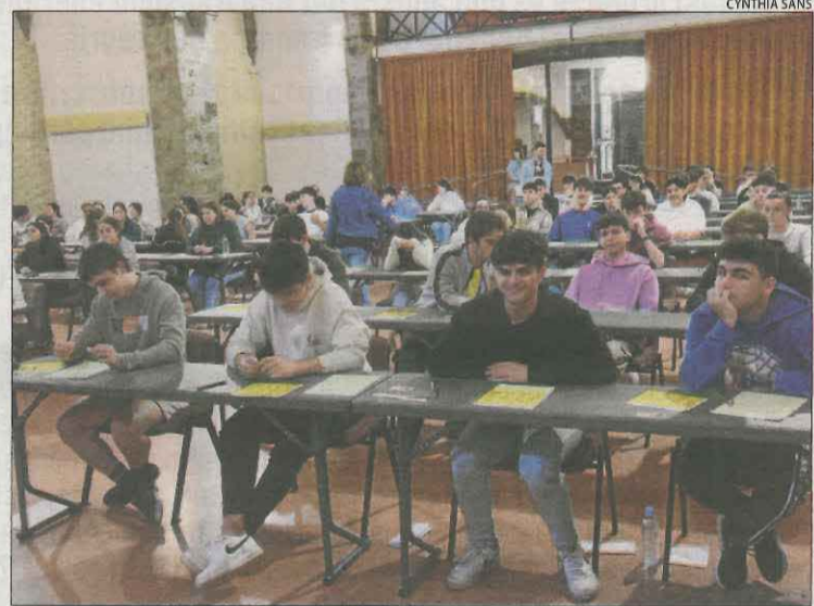
A la Seu d'Urgell fan les proves 234 estudiants.

Avui toca història, dibuix artístic, llatí, matemàtiques, dibuix tècnic, història de l'art, història de la filosofia, literatura castellana i química.