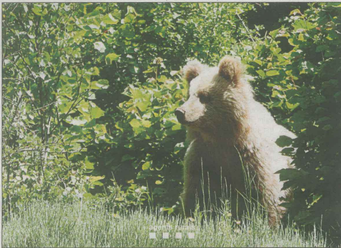
Imatge recent captada de l'osset que campa pels voltants del Port de la Bonaigua

En un comunicat difós ahir els ecologistes afirmen que "a causa de la informació filtrada a les xarxes per cert sector de la població