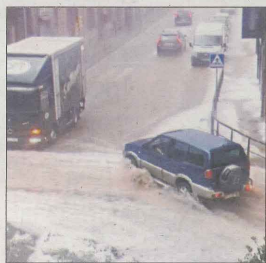
Els carrers de la Pobla de Segur baixaven com "un riu" a causa de l'aiguat