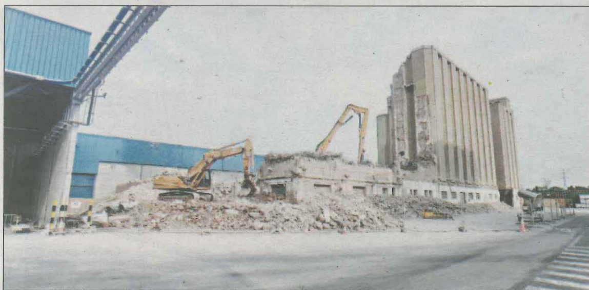
Obras de demolición del histórico edificio que la empresa Mahou San Miguel tenía en Lleida