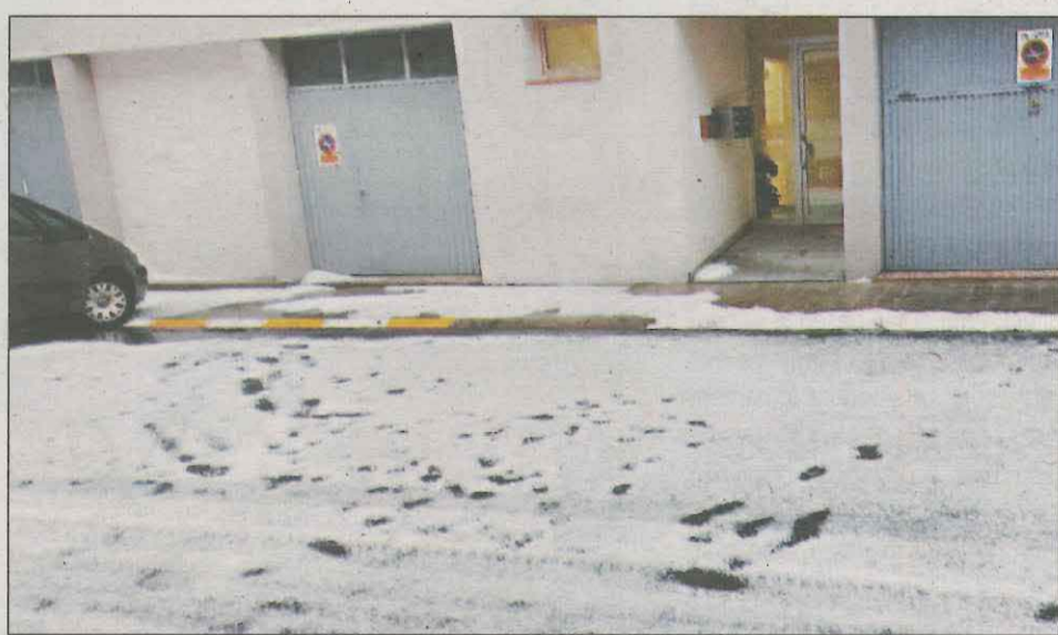
La calamarsa va deixar blancs els carrers de la Pobla

la piscina municipal del complex esportiu i la força de l'aigua que baixava pels carrers de centre històric també va arrancar algunes llambordes al Mercadal. A la rotonda de la carretera de Gerb també van caure algunes pedres a la calçada. D'altra banda, l'aigua