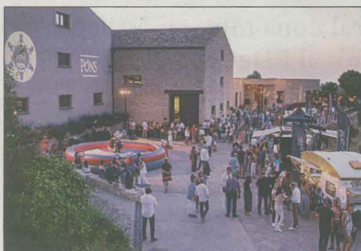
Una de les edicions del festival al Celler, a l'Albagés

El celler va ser impulsat per la família Pons, amb forta tradició