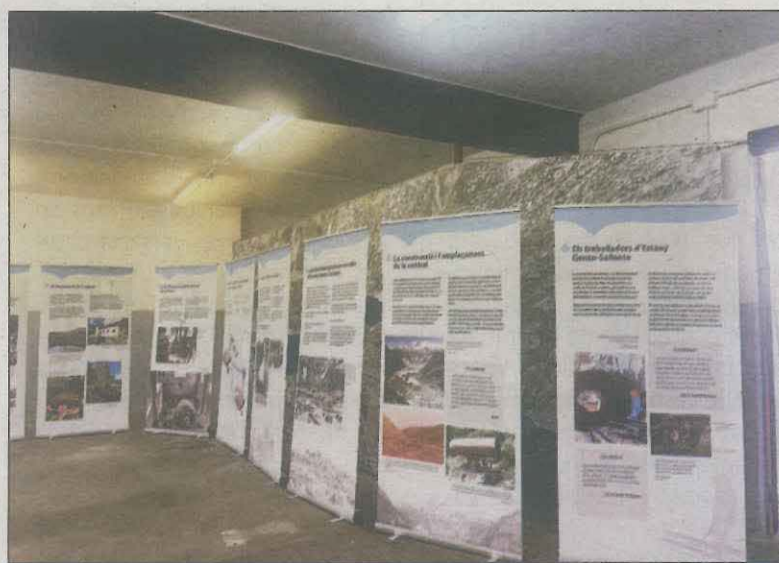
Plafons de l'exposició que s'inaugura dissabte

Durant aquest recorregut al patrimoni hidroelèctric de la Vall Fosca, el visitant es troba amb les primeres instal·lacions que van fer hidroelectricitat a la Vall, que són la Mola de Castell i la Mola de l'Arreu-aire de la Pobleta de Bellvei.