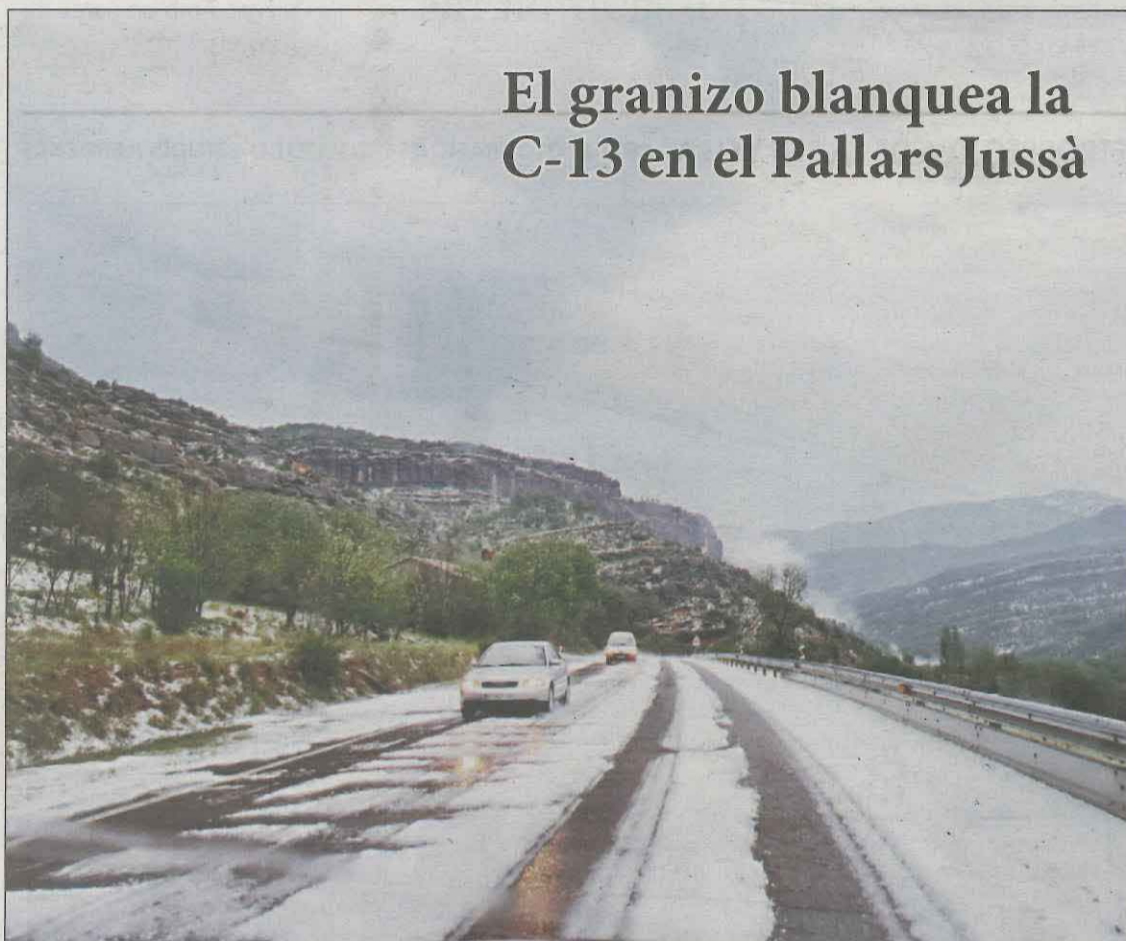
El granizo blanquea la C-13 en el Pallars Jussà

El tramo entre la Pobla de Segur y Gerri de la Sal después de la tormenta