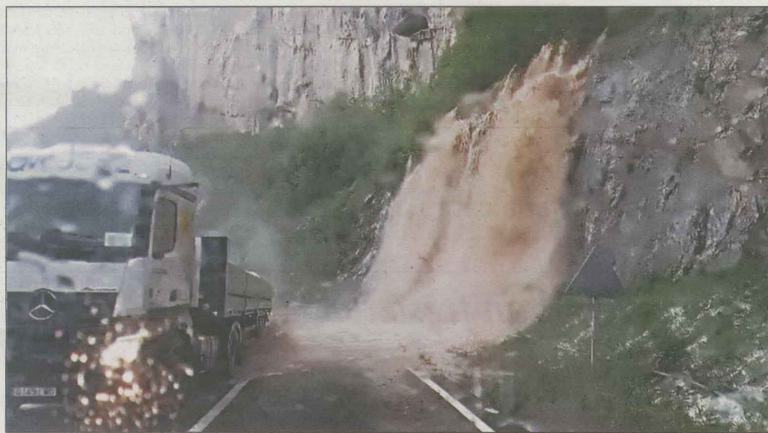
Un camió passa per la carretera N-230, al municipi d'Escales, enmig d'una esllavissada provocada per la tempesta

A més de la tempesta del Pirineu una altra de molt forta va entrar a Pònent al vespre i a les 21.00 hores, a Lleida es va fer fosc per un moment, ja que les llums encara no il·luminaven els carrers. A la capital del Segrià la pluja també va venir acompanyada de tornados. A Balaguer, l'aiguat va inundar el Pavelló d'Inpacs,