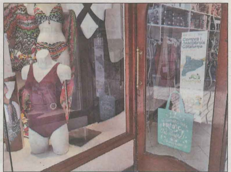
Les botigues incorporen un vinil en forma de bossa

Enguany, la campanya ha estat possible gràcies al finançament compartit entre els diferents ajuntaments que compten amb eixos comercials (Isona, la Torre de Capdella, la Pobra de Segur i Tremp) i el Comerç Associat de Tremp (CAT) i Poble Activa. Des que es va iniciar el projecte s'han fet 23 accions formatives, 11 campanyes de posicionament i 42 assessoraments.