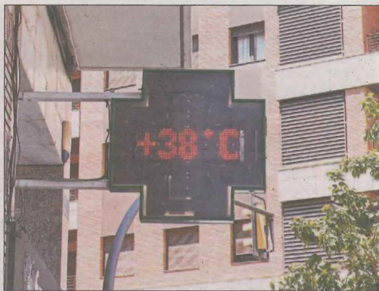
Un termòmetre ahir a la ciutat de Lleida

Les nits seran tropicals, amb mínimes que no baixaran dels 20 graus als litorals mediterranis i al quadrant sud-oest peninsular. L'Aemet adverteix que Huelva podrà patir una màxima de 43-44 °C, mentre que a Cadis, Còrdova, Jaén, Sevilla i Badajoz es preveu arribar als 42 °C; als 40 °C a Ciudad Real, Toledo i Càceres; i als 39 °C a Saragossa, Lleida, Madrid, València i Granada.