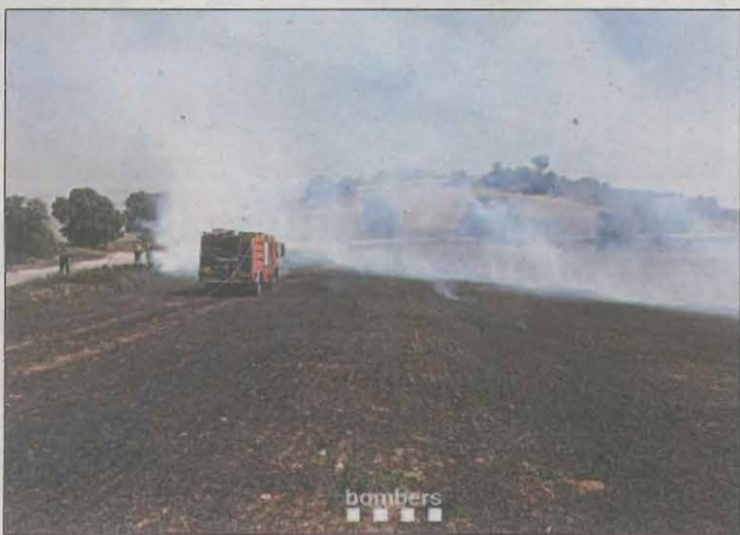
L'incendi de 6,5 hectàrees a Castelló de Farfanya