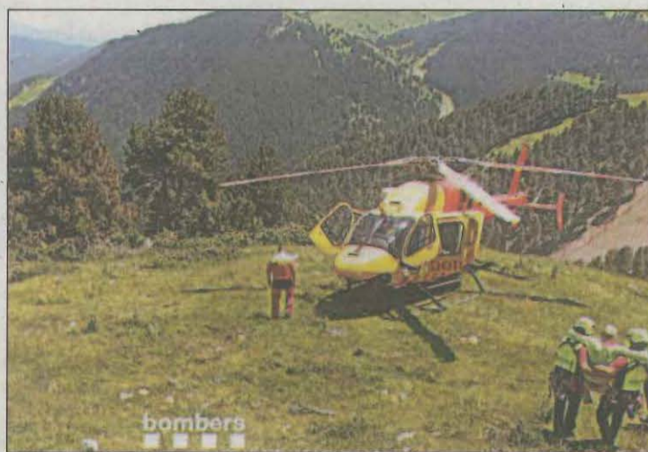
Un dels rescats que van fer ahir els Bombers

Els Bombers van apagar ahir diversos contenidors arreu de Lleida. A la matinada, van apagar quatre focs a contenidors situats a les Borges Blanques, Alpicat i a Lleida. A dos quarts d'una de la tarda van apagar un nou incendi en una paperera al carrer Antoni Soler de la capital del Segrià. A dos quarts de cinc, van apagar un foc en un contenidor de grans dimensions, de l'empresa Vilella a Alpicat. A tres quarts de set de la tarda, van extingir el foc d'un contenidor, situat a l'avinguda Catalunya de les Borges Blanques.