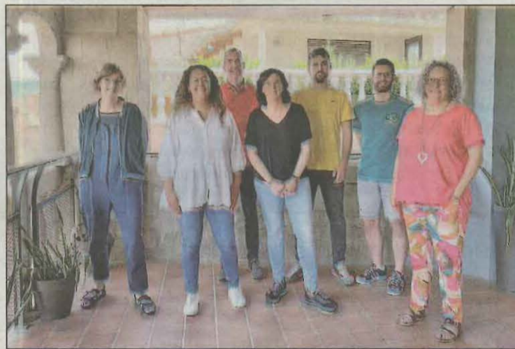
Els regidors d'ERC i la CUP a Solsona