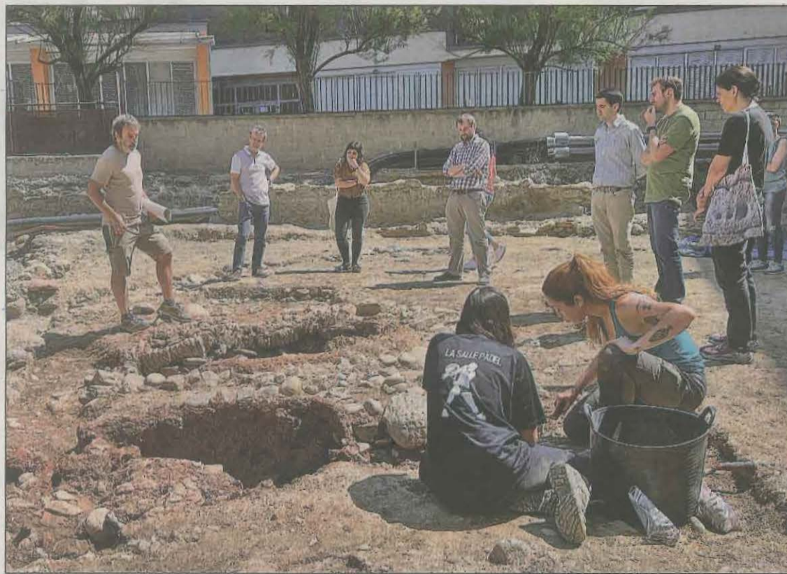
Arqueòlogues treballant al jaciment de Les Monges de la Seu d'Urgell.

Augé va posar en valor les restes localitzades en el jaciment, ja que va dir que aquestes permeten veure les estructures defensives de la ciutat, tot coincidint en un mateix espai les muralles medievals i les d'època moderna. El fet que també s'hagin localitzat fortificacions fa, segons va explicar l'arqueòleg, que tot el conjunt hagi d'estar protegit sota la declaració de Bé Cultural d'Interès Na-