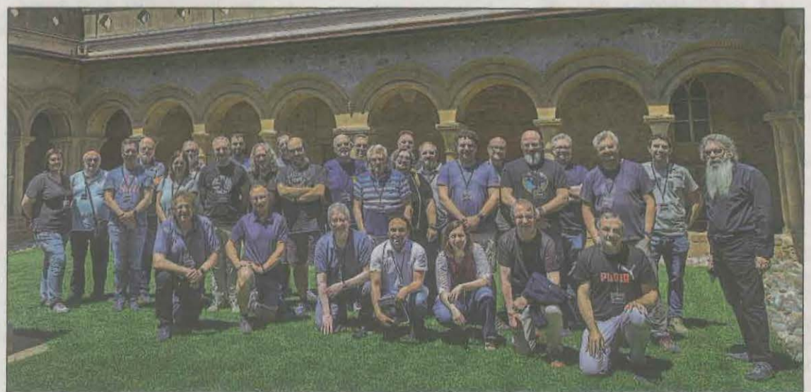
FOTO: / Imatge dels participants al congrés que va tenir lloc al Monestir de les Avellanes

cop més que l'astronomia és un recurs cultural i turístic que pot aprofitar-se a la Noguera, des del vessant més lúdic fins a l'alta especialització, gràcies a l'entorn natural del cel certificat Starlight i també gràcies als equipaments com el Parc Astronòmic Montsec i del sector serveis. Davant de la bona valoració, s'ha previst de fer-ne una segona edició al juny de 2024.