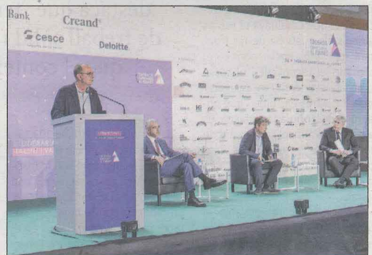
L'alcalde de Lleida va presentar la jornada