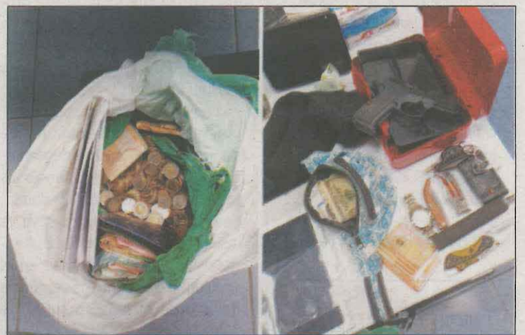
Diners i altres objectes robats que va trobar la policia

tima i material per cometre els robatoris, com ara tenalles i alicates. Quan el propietari va arribar a casa seva al migdia, es va trobar les habitacions regirades i va alertar els mossos. Un testimoni va donar pistes que els implicats estarien en un totterreny que havia fugir. Així, van iniciar un seguiment que va acabar a l'interior de Miralcamp. Al vehicle la policia va localitzar bosses plenes de monedes i bitllets, una caixa forta amb diners, dues tauletes electròniques, documentació de la víctima del robatori i un rellotge que acabaven de sostreure.