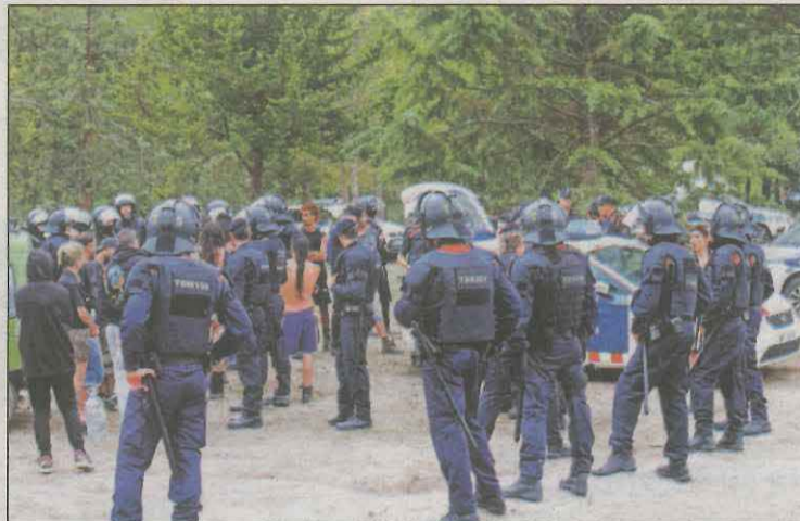
Mossos encerclant els participants de la 'rave'

Pel que fa al balanç de trànsit, els Mossos d'Esquadra van denunciar administrativament un total de 32 conductors per positius en drogues i un per conduir