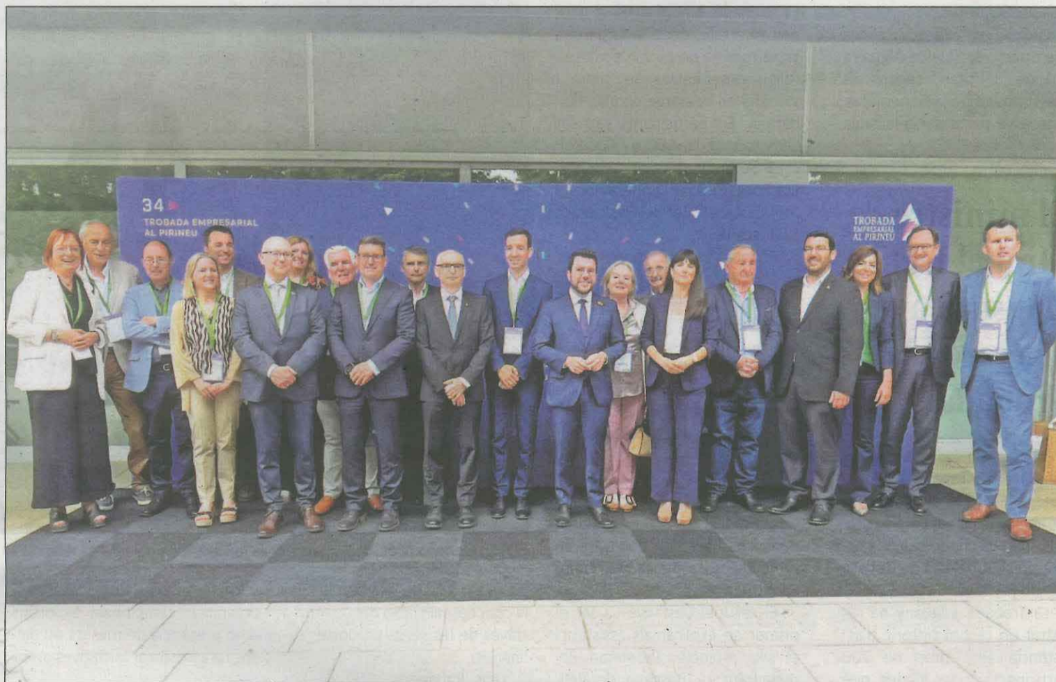
El President de la Generalitat va inaugurar ahir a la Seu d'Urgell la Trobada Empresarial al Pirineu

Aragonès, en relació amb el territori del Pirineu, es va referir a l'Eix Pirinenc, "una infraestructura clau per al territori i un dels grans reptes per a la millora de la seva competitivitat". Amb la mi-