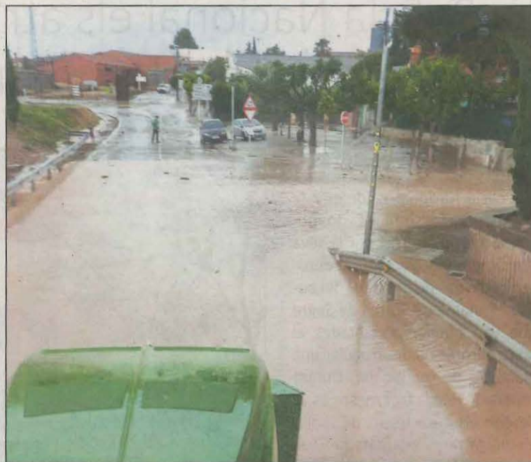
A l'esquerra, els carrers de Tàrrrega plens d'aigua; i a la dreta, l'afectació de la pluja a Arbeca