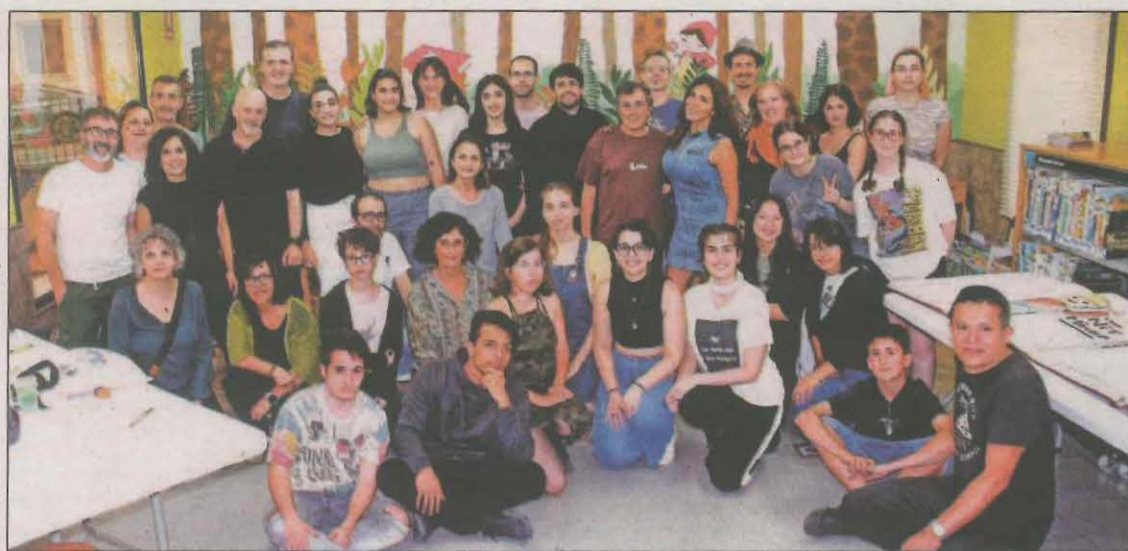
Foto de família amb els professionals que van il·lustrar els contes dels infants

La Biblioteca d'Alpicat va celebrar ahir la Festa del Llibre Gegant, una diada que enguany va arribar a la 24a edició. Uns quaranta professionals del dibuix van il·lustrar els contes dels infants que van participar en la confecció d'un llibre gegant. L'activitat s'havia de fer a la plaça del davant de la Biblioteca, però a causa de la pluja s'ha traslladat dins l'equipament.