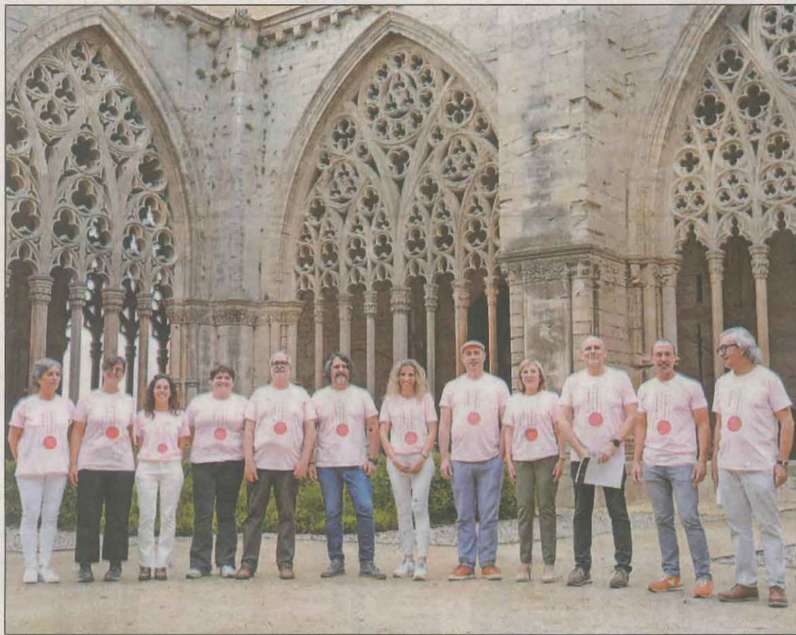
Els impulsors i alcaldes dels municipis que participen en la iniciativa, ahir a la Seu Vella

L'organització va explicar ahir que el projecte està obert a més poblacions i en aquest sentit es crearà una associació de municipis per proposar que s'incorporin nou miradors, sempre que aquests tinguin una torre, un campanar o un mirador habilitat per a la visita. La ruta pels 9 fars