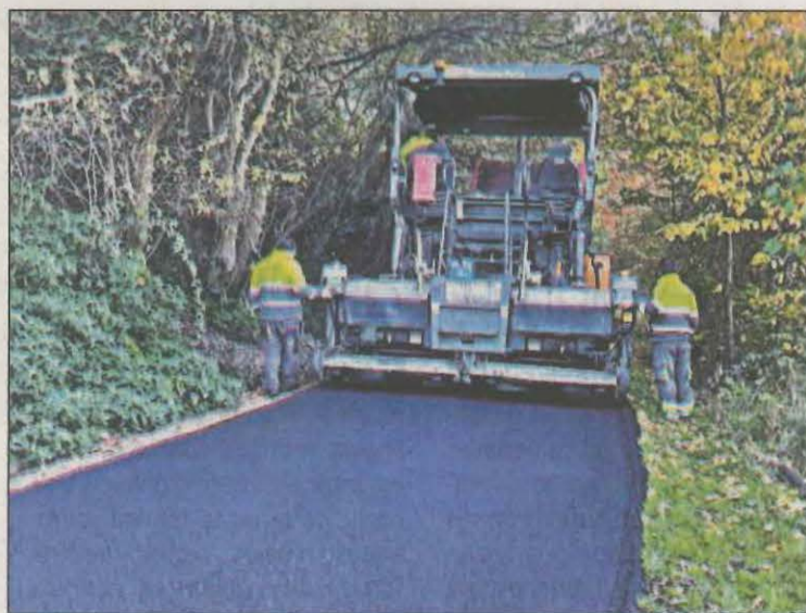
Una actuació de millora en un camí de muntanya

La línia de millora i manteniment de camins de la xarxa veïnal i rural és una eina més per a garantir l'equitat territorial i la millora de les condicions de vida dels veïns, ajudant a fixar població i evitant el despoblament. En el cas de les subvencions per a la millora i manteniment de camins, s'ha resolt atorgar l'import màxim possible a cada consell comarcal. Així per l'Alta Ribagorça s'han atorgat 399.840 euros, 866.400 a l'Alt Urgell, 383.280 euros a l'Aran, 759.480 al Pallars Jussà, 648.600 al Pallars Sobirà i 767.040 euros al Solsonès.