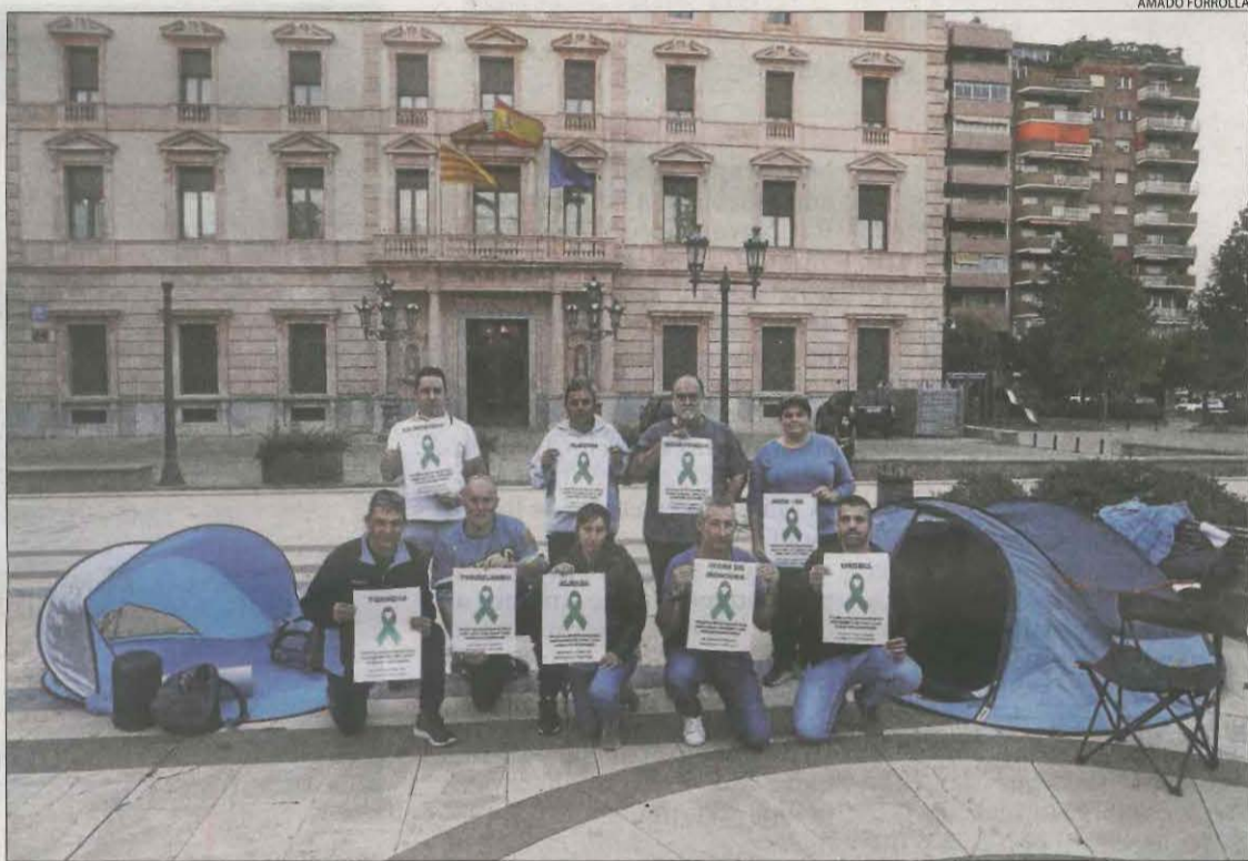
Els manifestants, gairebé tots d'ERC, a l'inici de l'acampada ahir davant de la subdelegació del Govern.

El problema es va originar per un error d'Acció Climàtica. Quan va formular la seua petició per rebaixar els mòduls, va presentar un codi d'activitat erroni que va excloure els préssecs de 33 municipis. El ministeri, per la seua part, va aplicar la proposta de la conselleria. Les localitats afectades només po-