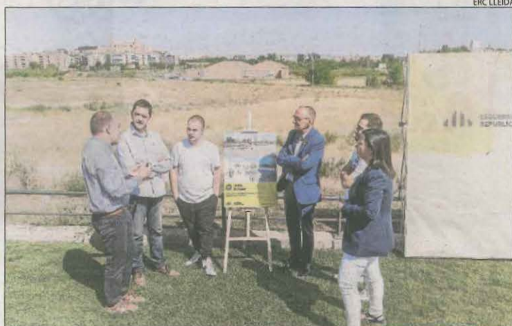
Pueyo i membres de la llista, a la zona de l'ARE.

El candidat republicà va detallar que tindrà una extensió de 61,4 hectàrees i que també elaboraran un pla local d'habitatge, "un registre d'habitatges assequibles, aprovarem el nou reglament de la taula d'emergència i negociarem amb els grans propietaris perquè posin a disposició pisos de lloguer a la borsa d'habitatge de l'Empresa