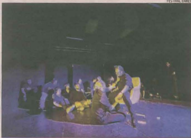
Un dels tallers que s'han dut a terme aquesta setmana.

Dijous 18. El col·legi Santa Maria de Gardeny és el primer escenari del festival. Durant el matí acull una mostra dels alumnes, Mon pare és un ogre , de La Baldufa, i Es ven germà petit del Centre de Titelles de Lleida.