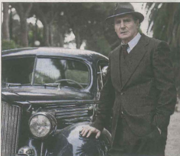
Liam Neeson al seu paper com a Philip Marlowe.

Però succeeix que el susdit detectiu és el llegendari i insolent Philip Marlowe, a qui l'escriptor Raymond Chandler li va atorgar personalitat d'incomunicació afectiva. Marlowe té cara del Humphrey Bogart d' El son etern , del Robert Mitchum d' Adeu, nena , i de Dick Powell, James Garner o Elliott Gould. Tots ells actors que van aprendre els diàlegs de Chandler, una cosa que no succeeix amb aquest Marlowe basat en una novel·la de John Banville, en un intent d'homenatjar l'escriptor de Chicago. El resultat és un detectiu abúlic dins d'una esforçada ambientació i amb un repartiment de luxe, encara que en definitiva, i com diria el Marlowe/Bogart, importa tan poc com que mengin sopa amb una forquilla.