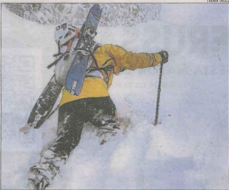
Un aficionat a l'esquí de muntanya a la Val d'Aran.

meteorològics preveuen tempestes i xàfecs a les comarques de muntanya i el Prepirineu i que es mantinguin durant el cap de setmana. Aquest fet suposarà un augment de cabal a les capçaleres dels rius que ja s'ha anat notant durant les últimes setmanes. Amb tot, és necessari que la pluja sigui més copiosa i freqüent per resoldre la greu situació de sequera que Lleida travessa durant l'últim any i mig.