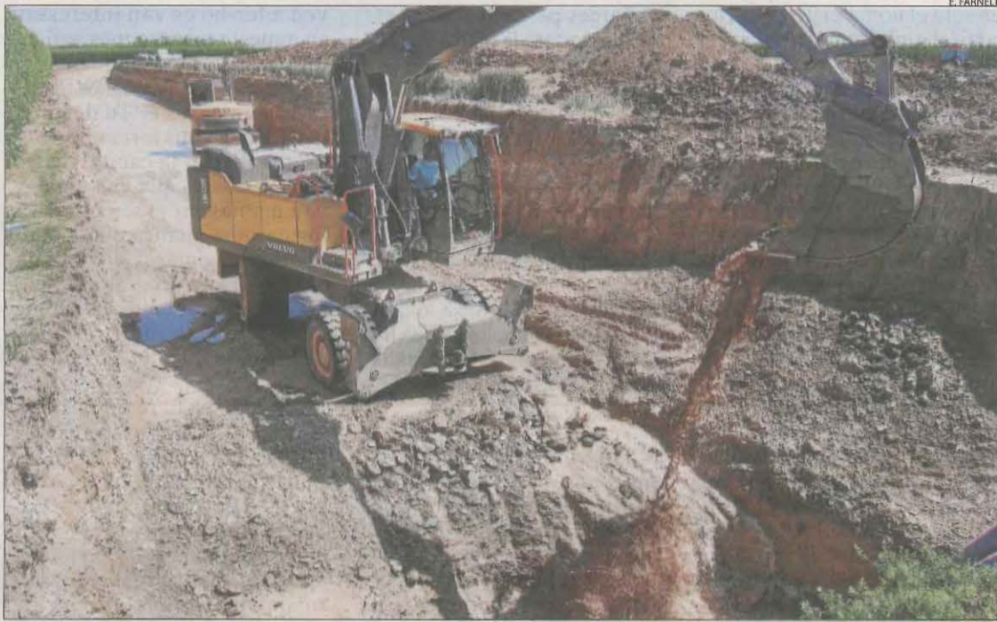
Perforacions a la zona regable del Principal ■ La imatge mostra un dels pous que es perforen a la zona regable del canal principal. Té uns sis metres de profunditat i garanteix, de moment, poder regar els fruiters durant tota la campanya i assegurar aigua de cara a la vinent.

La comunitat col·labora amb l'IRTA i l'Oficina del Regant per definir l'estratègia de reg a seguir per aplicar l'aigua disponible i salvaguardar el màxim d'arbres fruiters. Es reuniran cada setmana per ajustar quines són les necessitats.