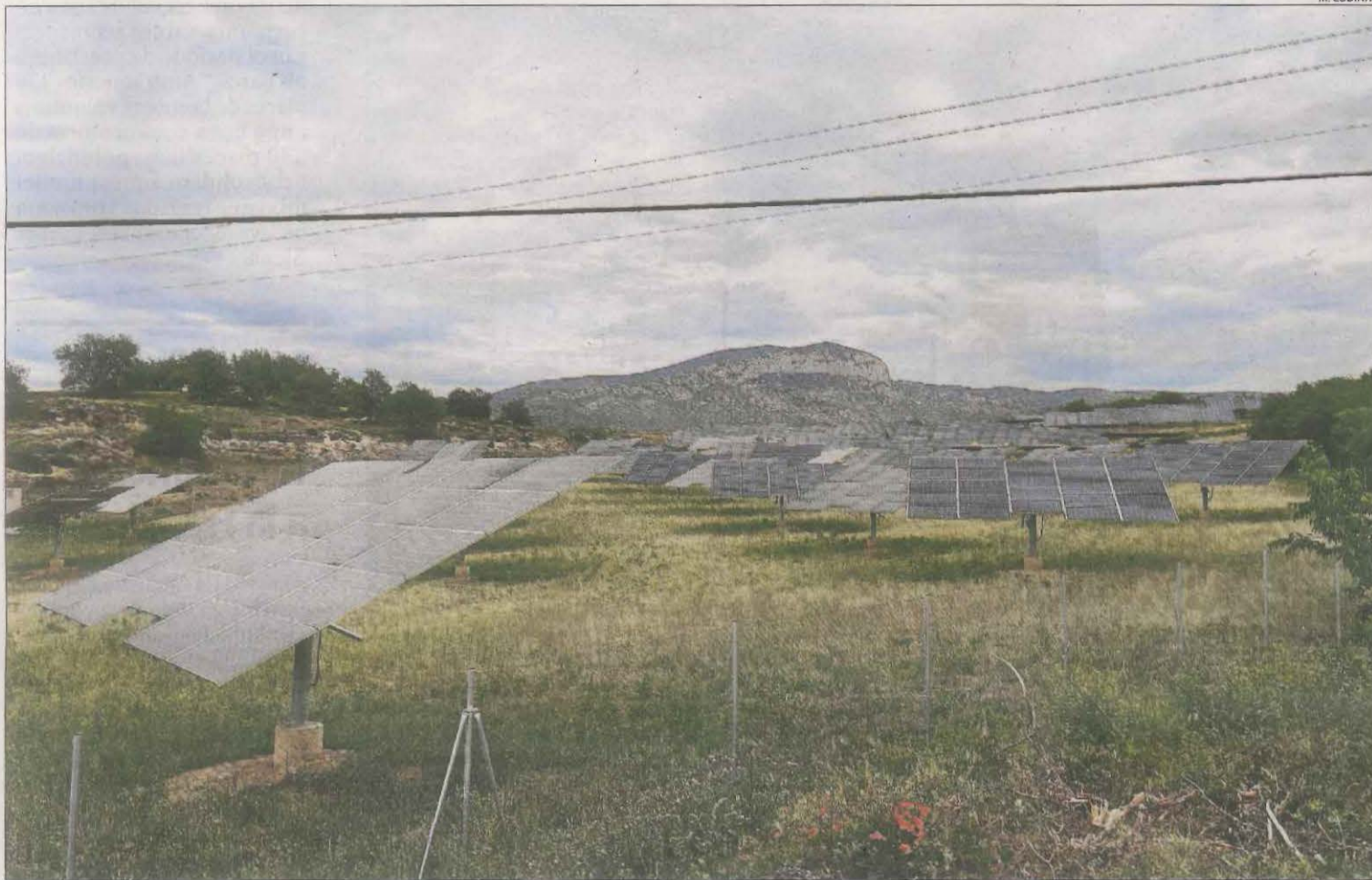
Un parc solar al poble de Basturs, al terme municipal d'Isona i Conca Dellà.

Isona i Conca Dellà és exemple de la polèmica a Lleida per grans plantes d'energies renovables