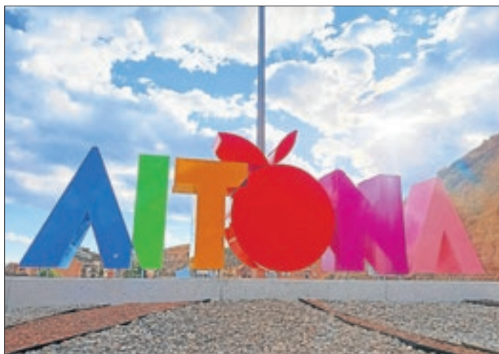
Les lletres que s'han instal·lat a la rotonda d'Aitona.