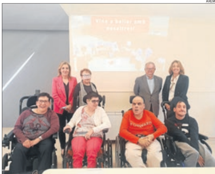
Presentació de la jornada solidària, ahir a la seu d'Aremi.

El fil musical d'aquest ball, la banda sonora de la pel·lícula Pirates del Carib , l'han escollit els mateixos usuaris de l'entitat que han participat en el vídeo promocional de la jornada.