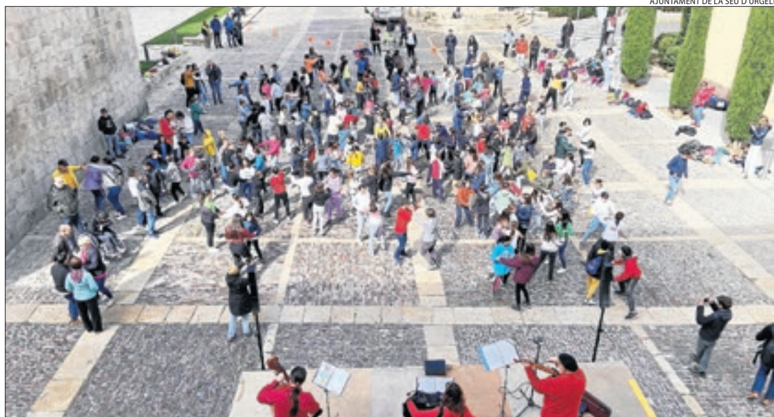
Els escolars van mostrar a la plaça dels Oms de la Seu les danses que han assajat des del gener.

Les colònies s'emmarquen dins del projecte interdisciplinari Aprenentatge i Servei que impulsa l'escola Albert Vives a través de la qual els alumnes coneixen la realitat de la ciutat. També realitzen activitats amb persones amb algun tipus de malaltia mental i amb alumnes de guarderia.