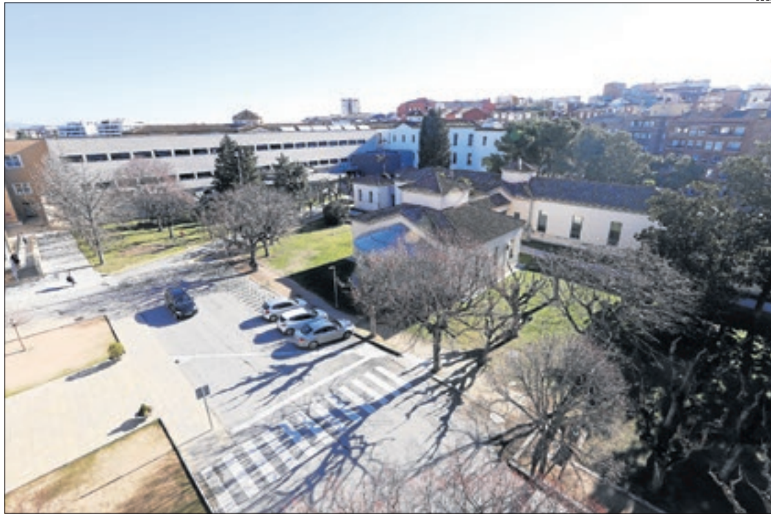
Vista panoràmica de l'Hospital Santa Maria de Lleida.

Van destacar la dificultat de determinar l'origen del contagi i van afegir que aquest cas no ha provocat cap alerta sanitària. El pacient no té cap contacte amb aus en la seua vida personal ni laboral. De fet, es trobava a l'atur abans de la infecció. Persones conexedores del cas han presentat al departament de Salut i a Salut Pública de la Generalitat una sol·licitud perquè s'investigui si existeix