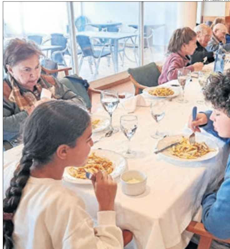
El moment del dinar va servir per compartir experiències.