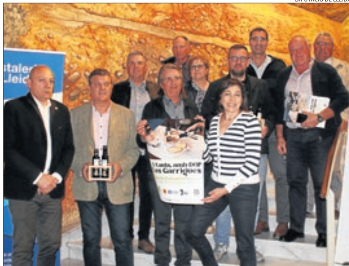
Presentació de la campanya 'A taula, amb DOP Les Garrigues'.