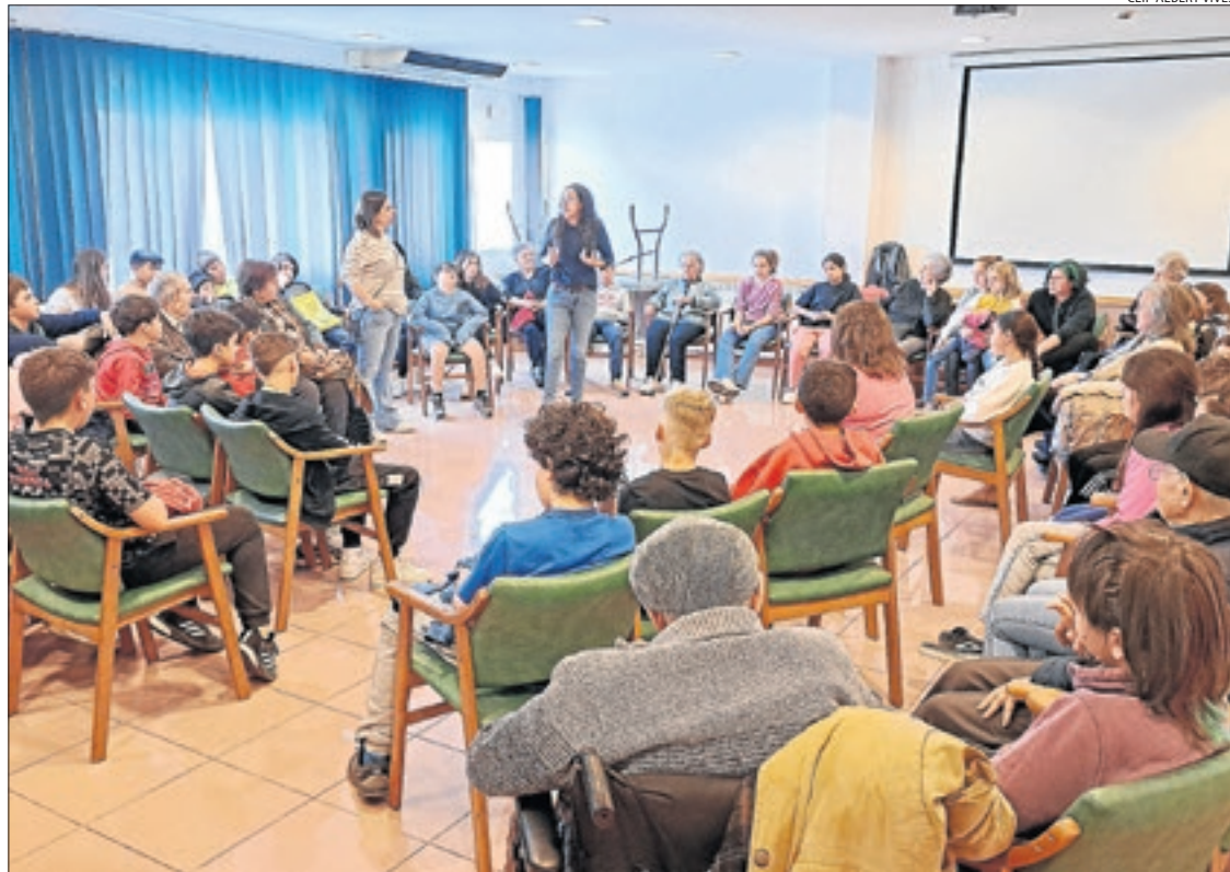
Una de les xarrades a les quals van assistir joves i grans durant els dos dies.