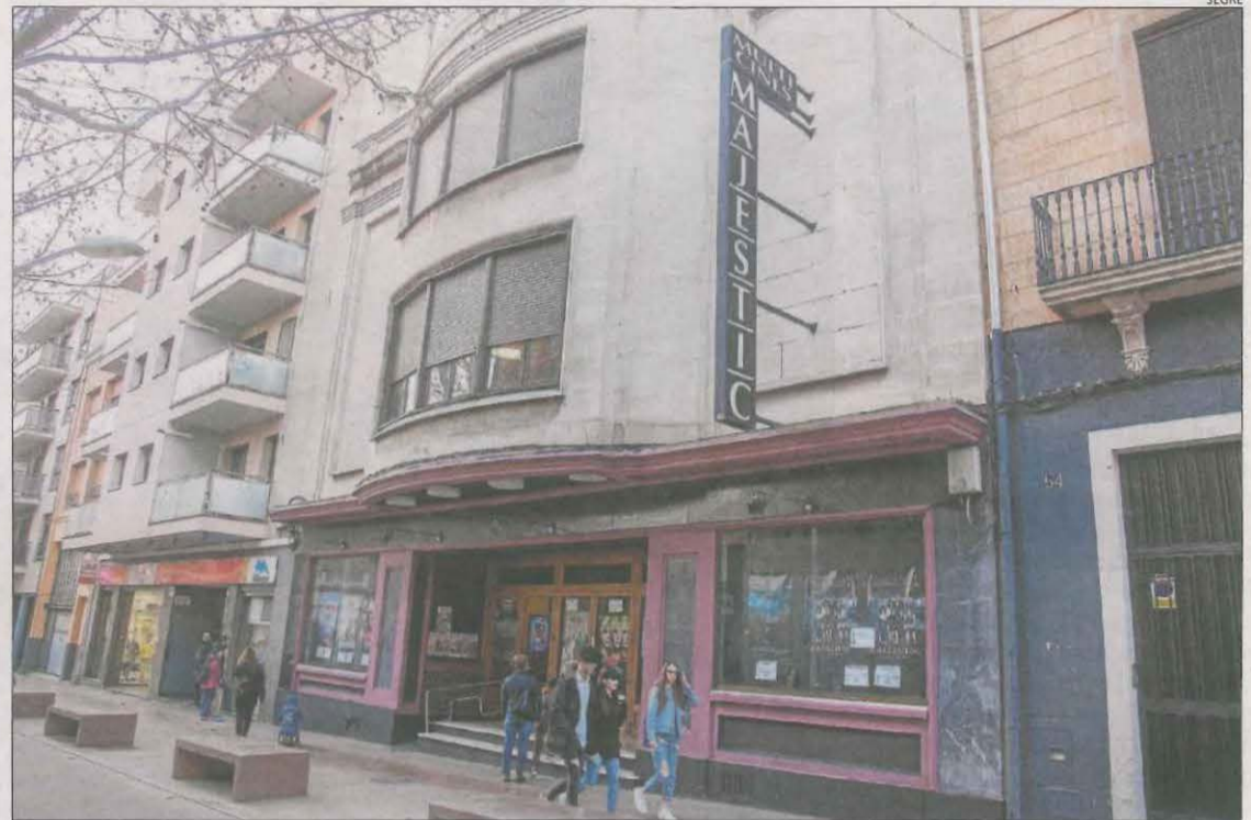
Imatge d'arxiu de l'avinguda Catalunya de Tàrraga després de la reforma de l'antiga N-II.

Dos dècades després, una ordre ministerial de l'any 2021 va estipular que seria la mateixa administració estatal la que