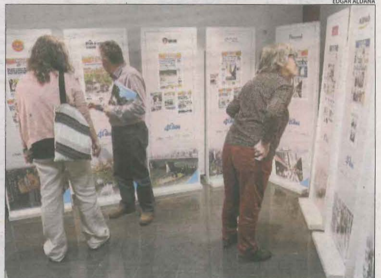
Tres dels visitants llegint les portades de la mostra.

un mitjà de comunicació de referència i un altaveu". Va recordar que el telefèric de l'estany Gento, propietat de la companyia, rep més de 30.000 visitants cada any. A la inauguració de la mostra també van acudir altres autoritats com el subdelegat del Govern espanyol a Lleida, José Crespín. L'exposició SEGRE, 40 anys informant es pot veure a l'Epícentre-Centre de Visitants del Geoparc de Tremp fins al proper 16 d'abril.