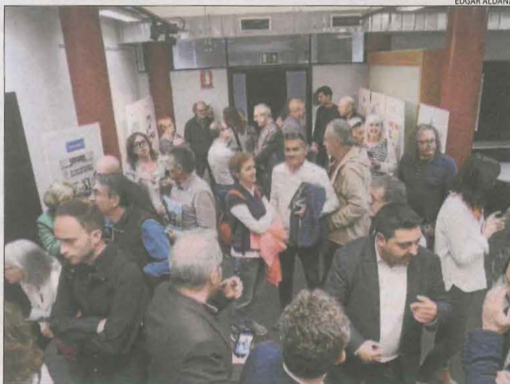
Algunes de les persones que es van atansar ahir a l'Epícentre.