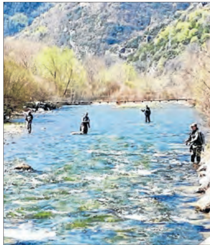
Primers pescadors de la temporada a la Noguera de Tor.