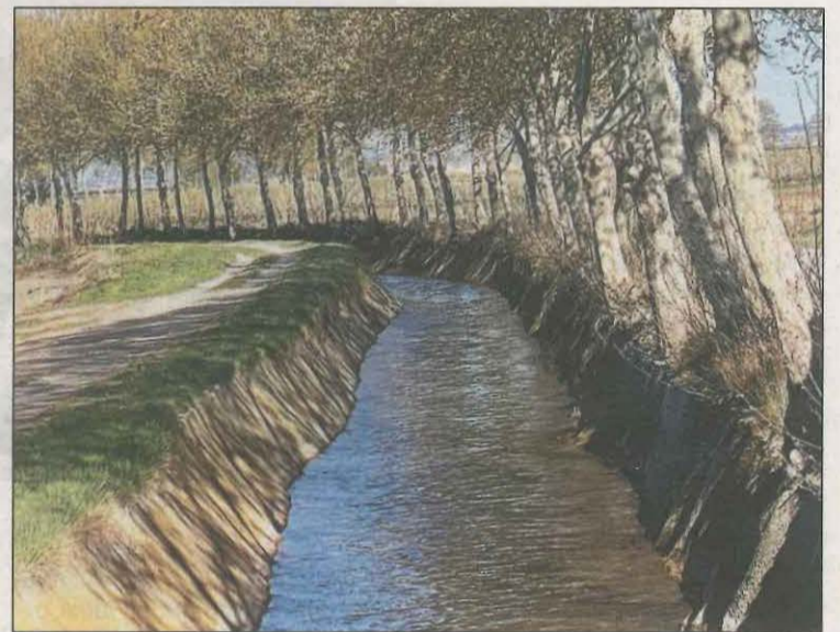
Imatge d'una de les séquies del Canal d'Urgell

De moment, la comunitat de regants rebaixarà el cabal d'aigua, de 27 a 23 metres cúbics per segon, per garantir el reg de conreus de blat i cibada, que es segarà durant el mes de juny, mentre ha instat a més a no plantar ce-