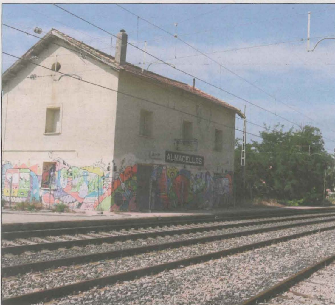
Imatge de l'estació de tren d'Almacelles, tancada i en situació deplorable

Per això, entenen que la supressió d'aquest servei va en contra de les actuacions que s'estan