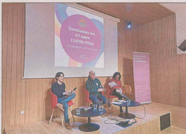
L'observatori presenta les dades d'LGTBI-fòbia a Catalunya

augment sostingut del de la lesbofòbia en un 11% i una de cada quatre incidències afecta a una persona trans. Més enllà de les agressions físiques i verbals es destaca les mostres d'odi i exaltació cap al col·lectiu, en específic vers el col·lectiu trans. L'OCH va reclamar la creació de polítiques públiques eficaces i efectives vers l'odi per lluitar contra l'LGTBI-fòbia.