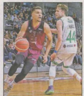
El TAU Castelló se mostró superior

El hombre, de 30 años, tuvo el accidente en Balàfia tras una persecución y acabó siendo detenido por la Guàrdia Urbana LOCAL | PÁG. 12