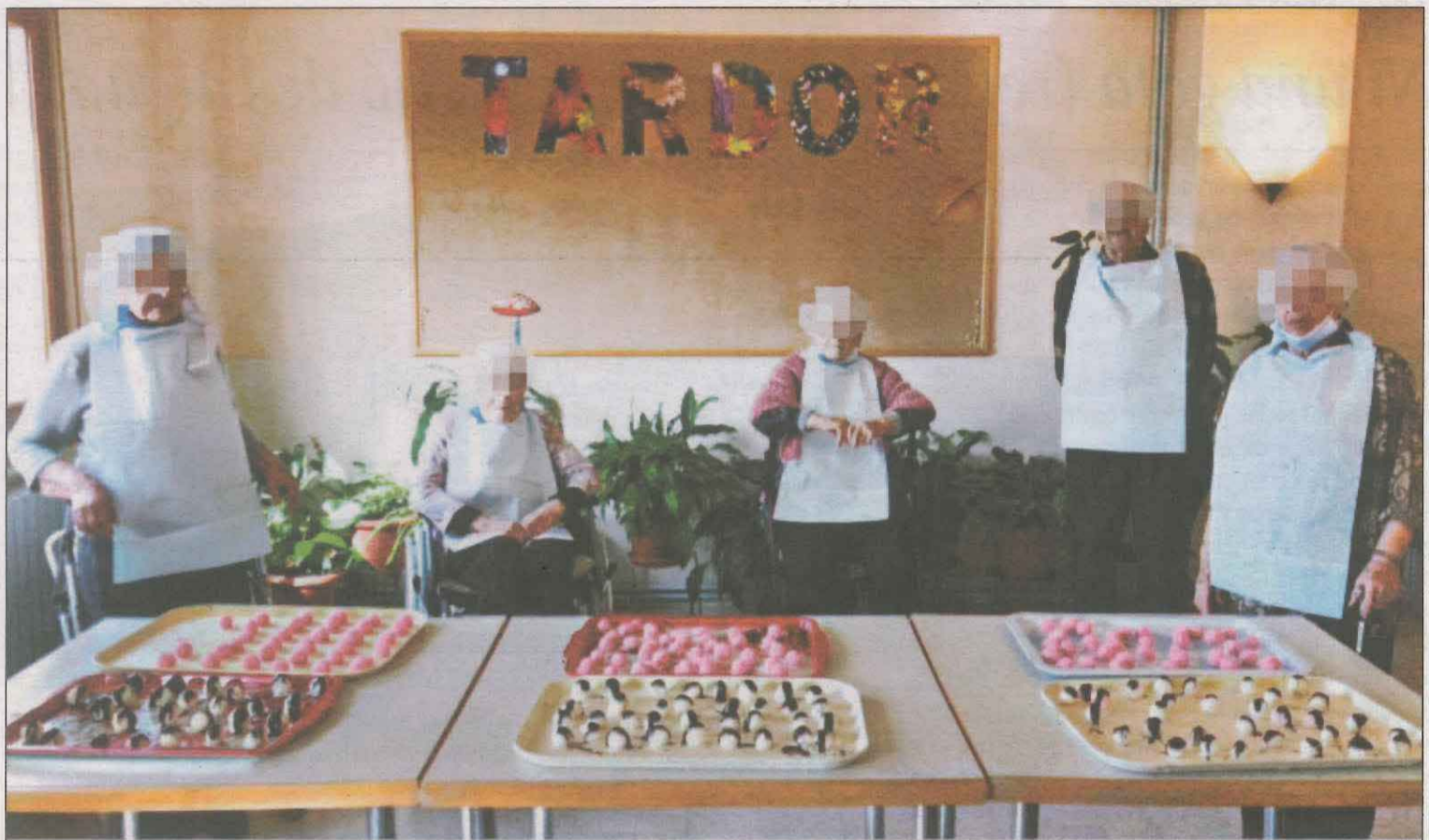
Usuaris de diverses plantes de la residència Fiella de Tremp, a la festa de la Castanyada 2020, barrejats i sense mascareta

Tot i que de moment les querelles presentades al jutjat de Tremp que investiga el cas són dues, no se'n descarta que n'arribin més. La residència Fiella pertany a la Fundació Fiella Sant Hospital de Tremp, una entitat vinculada al Bisbat de l'Urgell. Des del bisbat no van fer cap declaració al respecte després que LA MAÑANA contactés amb ells