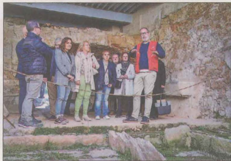
La consellera de la Presidència va visitar ahir Tremp