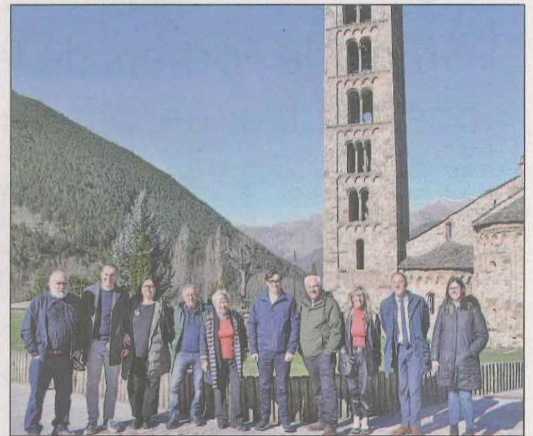
Salvador Illa va visitar ahir l'Alta Ribagorça

Illa va declarar que encara no està decidit quines llistes s'adscriuran com a PSC i quines com a marca blanca del PSC (en princi-