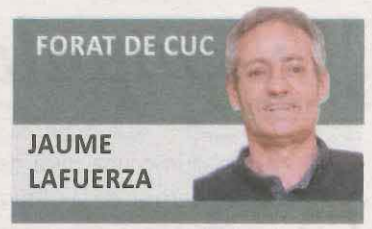
FORAT DE CUC JAUME LAFUERZA

es van ser dramàtiques. El cas està judicialitzat des de fa un parell d'anys a través de la querrela que van presentar els familiars dels pacients i ahir es va saber que un nou plet alerta que només vint dies abans que es coneguessin els casos positius suposadament s'hi va celebrar una festa de la castanyada. Sigui o no aquest el motiu del brot (en aquests casos cal ser prudent i deixar treballar la justícia) és evident que alguna cosa no es va fer bé en aquesta residència de Tremp durant aquells fatídics dies de novembre. Les conseqüències les van pagar els padrins i padrines que hi vivien. I encara que ara és tard per lamentar-se sí que cal prendre les mesures i afinar els protocols perquè mai més torni a passar res igual.