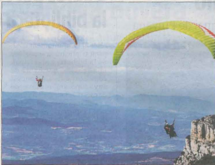
Imatge d'arxiu de dos parapentistes a la Vall d'Àger.

L'anterior accident mortal d'esports aeris es va produir el passat 21 de març, quan va perdre la vida un paracaigudista