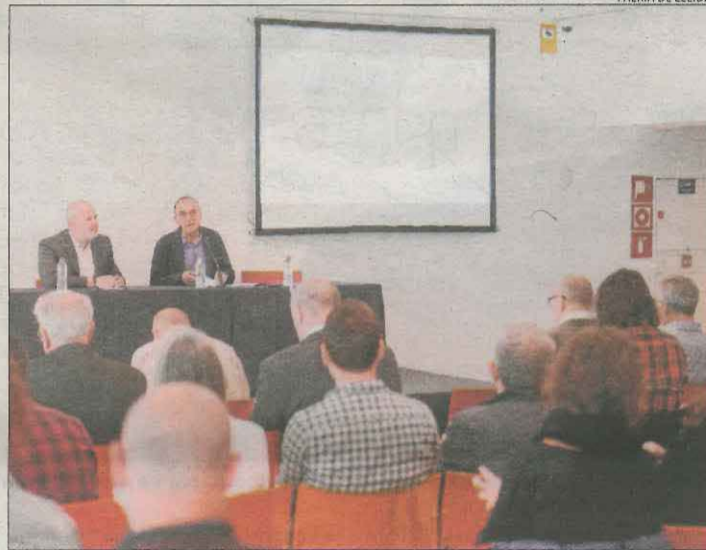
L'assemblea de l'AMEP celebrada ahir a la Llotja de Lleida.

de l'entitat municipal descentralitzada (EMD) d'Isil i Alós. Aquest mateix mes ha adjudicat en concurs a una distribuïdora privada dels poc més de 2 quilòmetres de cablatge públic que dona llum al poble d'Alós. Per la seua part, l'ajuntament de Llimiana preveu treure a subhasta la xarxa de distribució elèctrica municipal i que cada veí triï la seua companyia co-