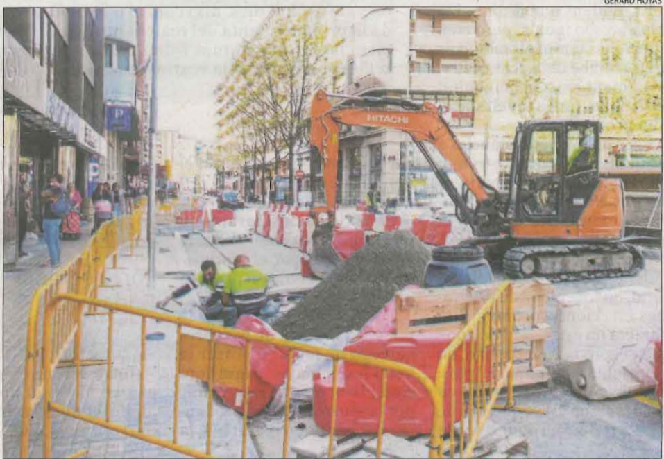
Les obres de la rambla d'Aragó de Lleida a l'altura del carrer Lluís Companys.