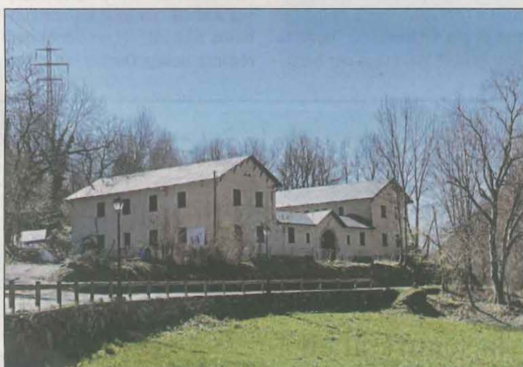
Edifici de la Torre de Capdella on hi haurà la segona seu

La inversió anirà a càrrec de la Diputació de Lleida (1,1 milions), Educació (551.000 euros), l'Ajuntament de la Pobla de Segur (375.000 euros) i 177.000 euros la Torre de Capdella. Per tal de donar singularitat a aquests estudis, els dos consistoris han posat a disposició dos edificis que cal habilitar degudament per a usos docents. Aquests estudis han de formar joves en esports d'hivern,