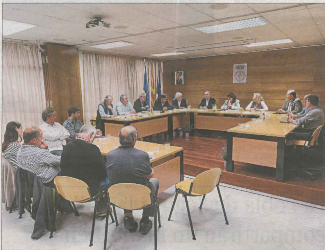
Reunió entre la Comunitat de Regants de la Conca de Tremp i la consellera

La modernització i ampliació del reg de la Conca de Tremp "és un deute històric flagrant" que es té amb el Pallars Jussà, va sentenciar Jordà. I per això, el nou Programa d'encàrrec d'actuacions (PEA) d'infraestructures de la Generalitat inclourà aquesta infraestructura amb un compromís de finançament. Per a la consellera, millorar el reg contribueix de manera especial a garantir el relleu