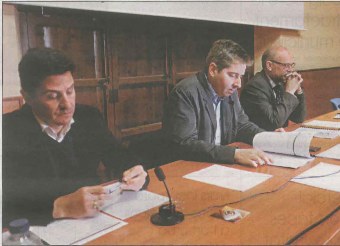
Mollerussa va acollir ahir una junta d'explotació de la CHE referent al Segre

La CHE no disposa de previsions a mitjà o llarg termini perquè és molt complicat preveure