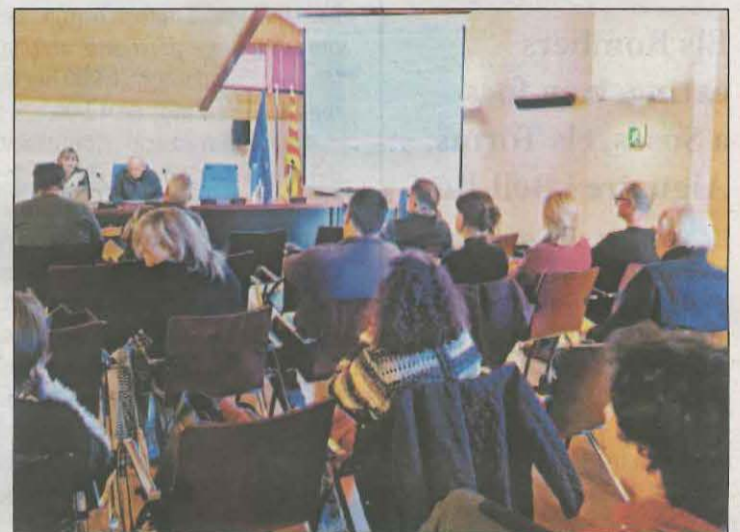
Moment de la presentació del nou pla

de l'edifici estan valorades en 1,5 milions d'euros. D'altra banda, en el cas de la Torre de Capdella, la segona seu de l'Institut s'emplaçarà a l'antiga caserna de la Guardia Civil.