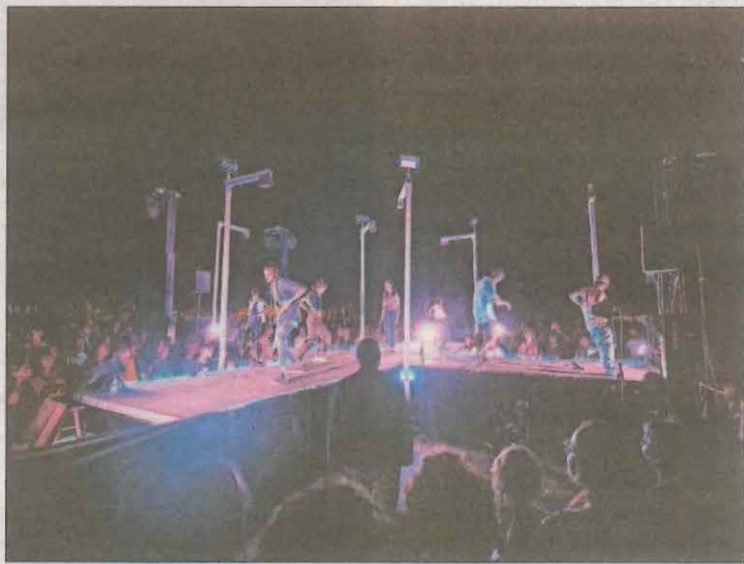
La proposta fusiona música i dansa

cipatiu i nocturn". Amb aquesta proposta Sound de Secà ha fet un salt evolutiu en la seva trajectòria, expliquen. Per primer cop la companyia eleva un espectacle a dalt d'un escenari, en forma de creu, simbolitzant una cruïlla. També han sumat altres llenguatges a nivell tècnic, com la sonorització dels instruments i la il·luminació, a part d'incloure sonoritats electròniques.