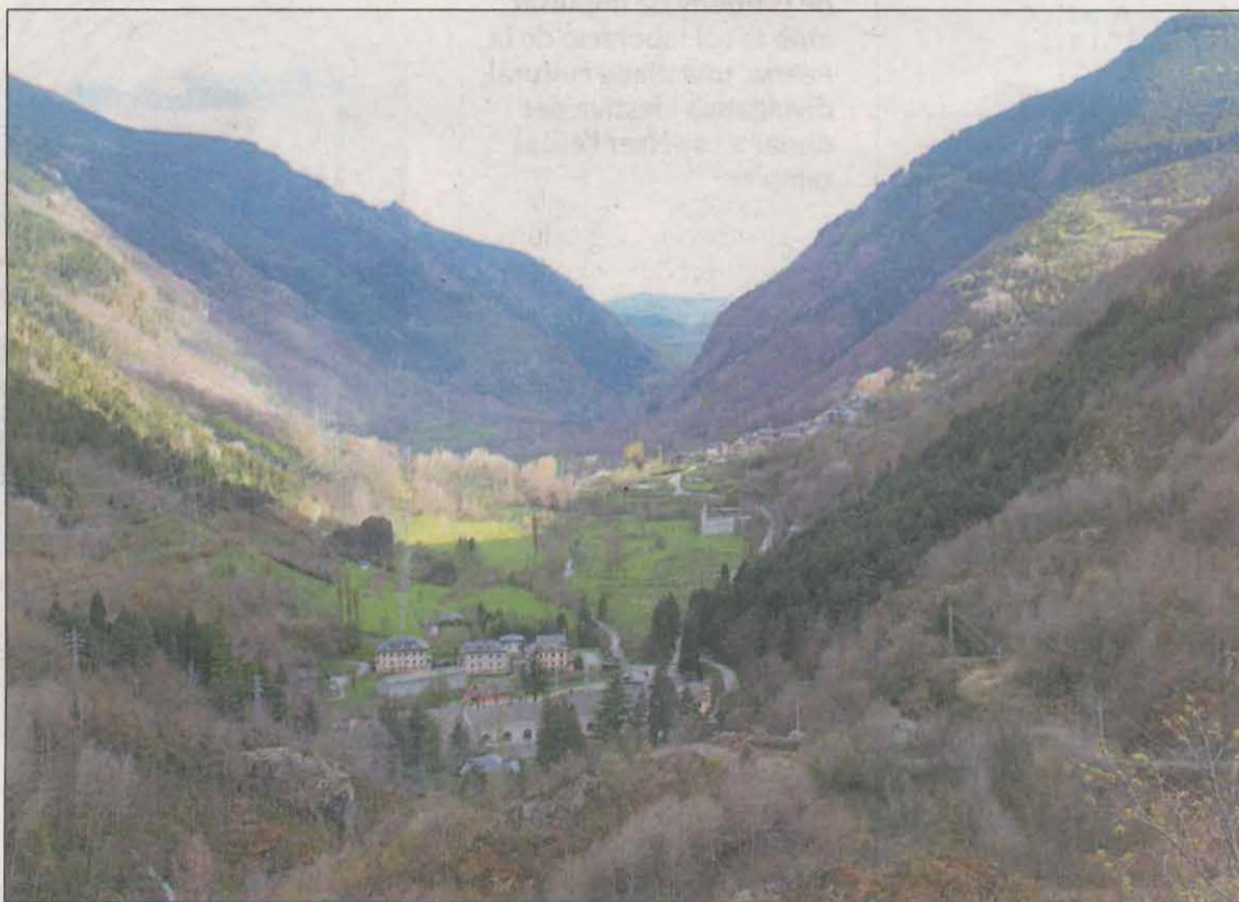
La inclusió jove i l'envelliment actiu del territori són alguns dels objectius

El resultat final del projecte es materialitzarà en una app interactiva d'itineraris culturals, que es faran segons el criteri dels habitants del territori. Seran les persones de la Valls les protagonistes del projecte i durant el mes de desembre es farà el llançament de l'aplicació, que promourà l'ús de la llengua catalana i del dialecte pallarès per difondre el patrimoni del territori. Per fer l'app, es faran cursos i tallers sobre eines