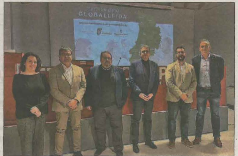
Imatge de l'acte d'ahir a la Seu d'Urgell

guren aquesta xarxa, i que tenen una triple finalitat: esdevenir un punt de referència de suport a l'empresa i l'emprenedoria a escala comarcal; ser un punt de trobada i coordinació per al personal tècnic que treballa en l'àmbit de l'empresa i l'emprenedoria a la comarca de forma que es puguin generar sinèrgies i complementaritats; i ser un punt de referència en què tots els municipis de la comarca podran trobar els serveis que s'hi ofereixen en benefici del desenvolupament local i la promoció econòmica del territori, segons va informar la Diputació.