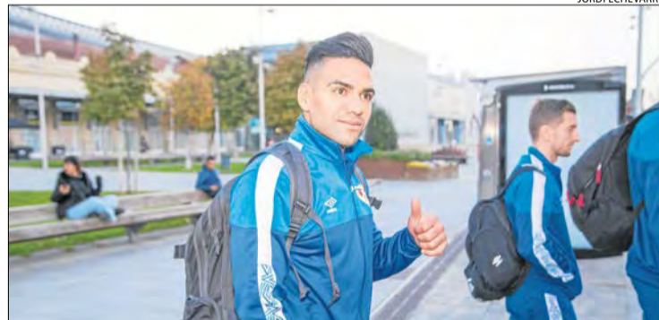
Radamel Falcao, a l’arribar a Lleida amb l’expedició del Rayo.

ENTRENADOR Andoni Iraola SISTEMA 4-2-3-1