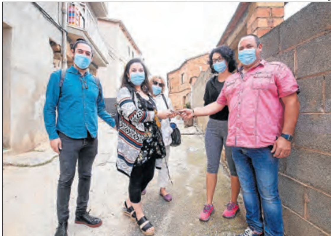
L'alcalde entregant les claus el 2020 a la família de Manresa que encara viu a la localitat.

Atreure veïns no és només qüestió de disposar d'habitatges, sinó també de poder treballar al poble o el seu entorn. Puig ha iniciat reunions amb empreses pròximes a Biosca, especialment amb el grup BonÀrea, per provar de facilitar l'accés a llocs de treball a nous habitants. Biosca té 176 habitants. L'última dècada, el municipi n'ha perdut mig centenar i els dos últims anys han tancat el bar restaurant i la botiga amb fleca. El municipi s'ha quedat sense comerços, una cosa que agreuja el risc de despoblació, informa X. Santesmases.