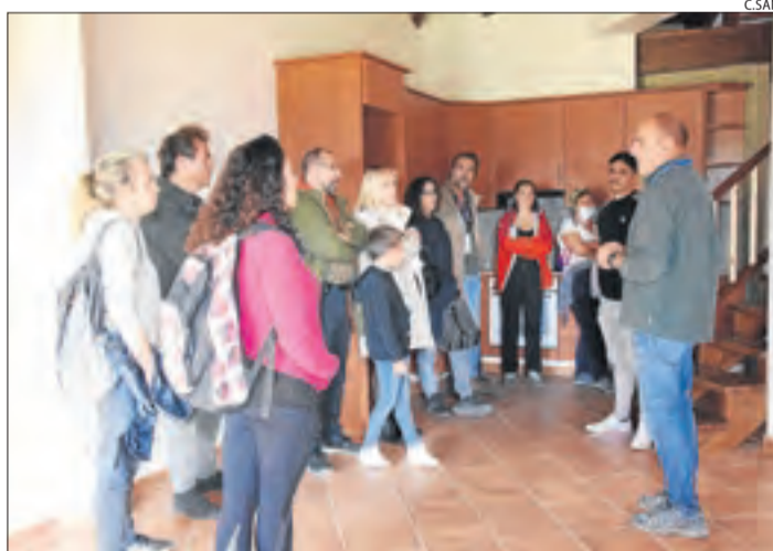
Portes obertes als pisos que ha comprat la Vansa.

La compra dels pisos ha suposat una forta aposta per al municipi. El pressupost total del consistori és de 500.000 euros a l'any i els va adquirir a la Sareb per 470.000. D'aquesta xifra, 110.000 van ser fons propis que van pagar dos dels habitatges. La resta correspon a un crèdit de l'Institut Català