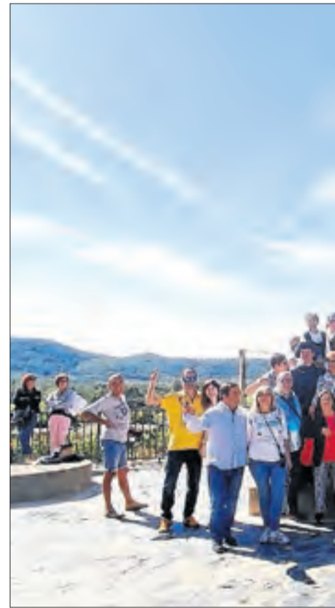
Veïns de Fullela i visitants, durant la celebració.