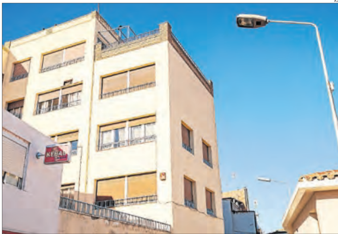
La seu de les germanes carmelites missioneres que preveuen remodelar a primers del 2023.

Fonts municipals van indicar que el projecte ja està redactat i en procés de licitació i les obres podrien començar a primers d'any. En l'actualitat, resideixen a l'edifici tres germanes, ja que algunes s'han traslladat per les obres, encara que n'hi