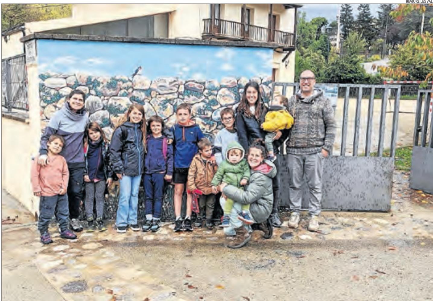
Imatge dels nens i nenes nouvinguts aquest curs a l'escola de Tuixent.

L'augment de població durant la pandèmia pot consolidar-se o no, però ha deixat importants lliçons en matèria de repoblació. L'experiència dels últims anys ha demostrat que són mol-