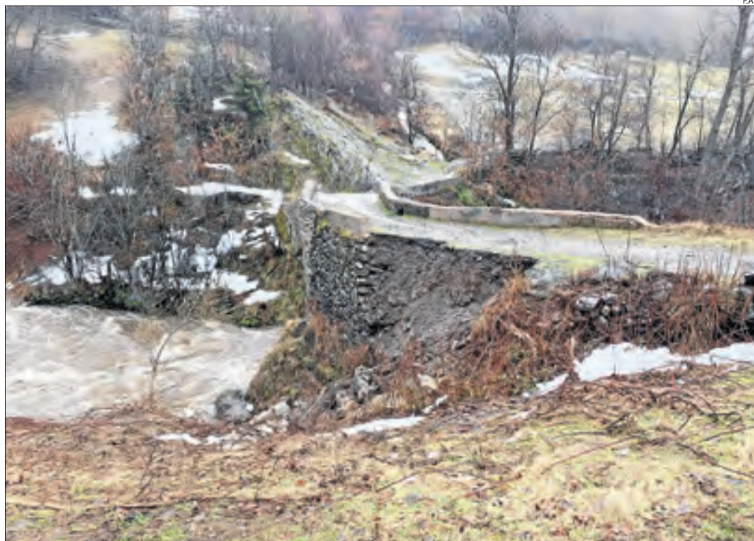
Aquesta setmana han començat els treballs de reconstrucció del pont medieval d'Alós.

D'altra banda, també s'està executant la pista forestal de Boet, entre la Força d'Àreu i la Molinassa, per encàrrec del Parc Natural i a petició de l'EMD d'Àreu i l'ajuntament d'Alins. En aquest cas, s'ha formigonat un tram de