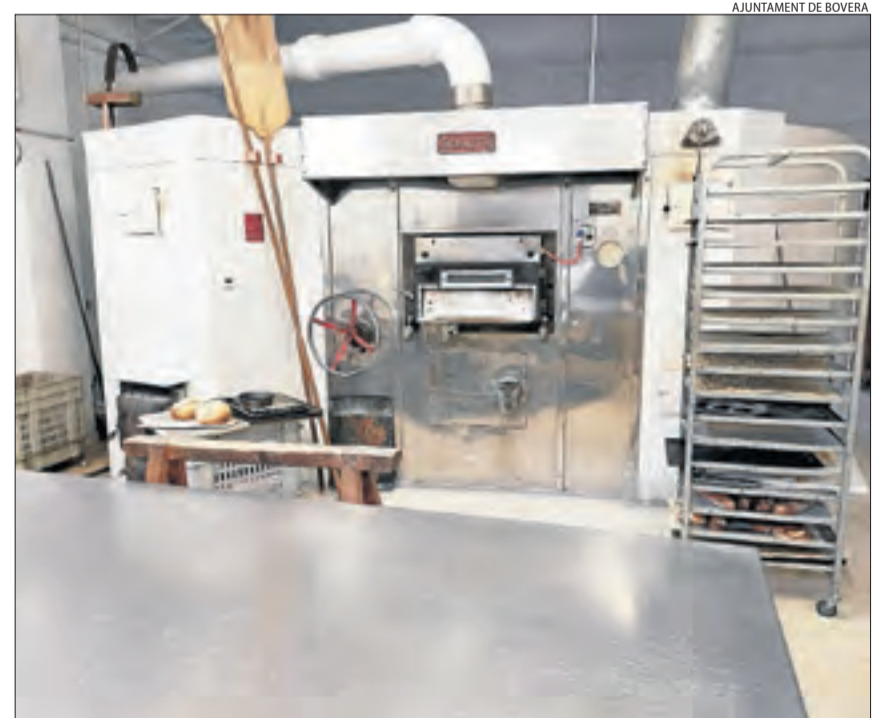
L'interior del forn de pa de Bovera, tancat des del mes de gener passat.

Inclou habilitar un seguit de vivendes en edificis públics municipals i desplegar la xarxa de fibra òptica entre aquest any i el 2024. També està previst posar en marxa programes similars a l'Urgell, el sud del Segrià i les Garrigues Baixes.