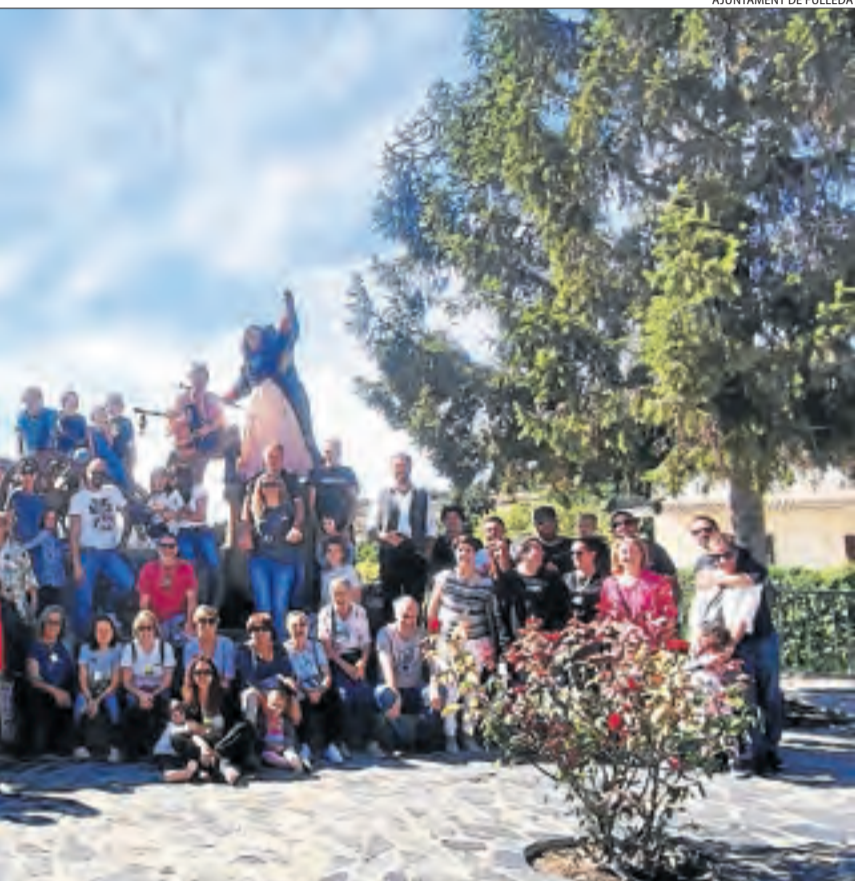
AJUNTAMENT DE FULLEDA

Baix Pallars va celebrar el mes de setembre passat la incorporació al cens de 31 nous veïns els últims tres anys organitzant per a ells una festa de benvinguda al poble de Gerri de la Sal.