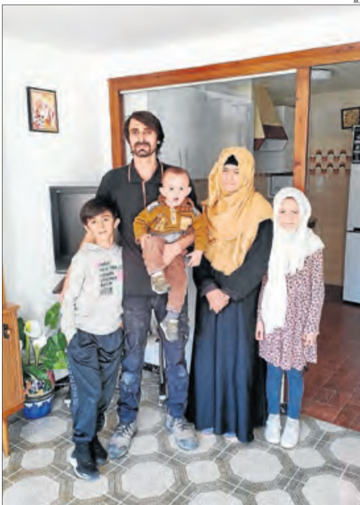
La família pakistanesa que està allotjada a Torrebesses.

Aquestes localitats han començat a reclutar mentors que ajudin els nouvinguts a assentar-se per facilitar que es quedin una vegada expiri el contracte laboral d'un any que ofereixen els municipis. Han de facilitar la seua integració, ajudar-los en tramitacions i familiaritzar-los amb els costums i l'idioma català.