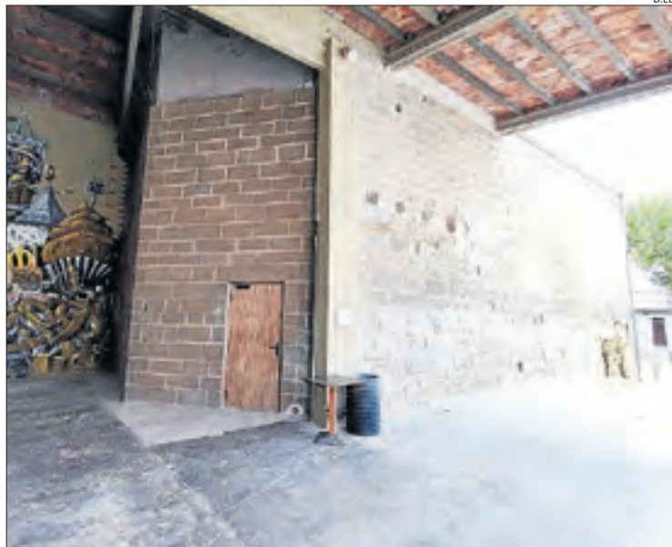
L'entrada a l'església de Penelles que s'ha rehabilitat.

PENELLES | La Diputació i l'ajuntament de Penelles han finalitzat les obres de rehabilitació de l'Església Vella o de Sant Joan Baptista. El temple, fora de culte dels segles XVI-XVII, serà un altre enclavament d'atracció turística i punt neuràlgic per acollir visitants en la celebració del festival GarGar. La remodelació ha suposat una inversió de gairebé 74.000 euros i ha rebut també fons europeus del programa Feder.