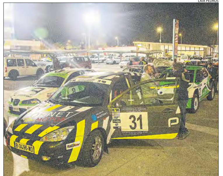
Els cotxes van passar ahir les verificacions.