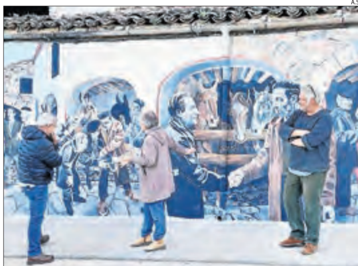
El mural inaugurat ahir sobre el mercat de mules a Salàs.