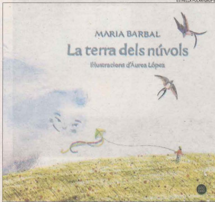
Portada de l'àlbum il·lustrat 'La terra dels núvols', de Maria Barbal.

El protagonista del conte (una edició de tapa dura i una mica més de trenta pàgines), es diu Nel, un petit núvol que