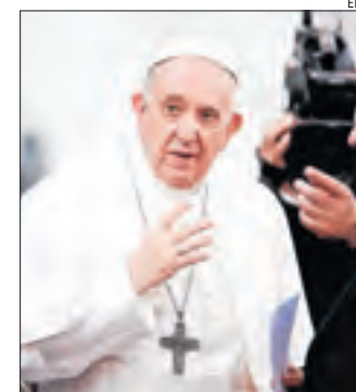
El papa Francesc.