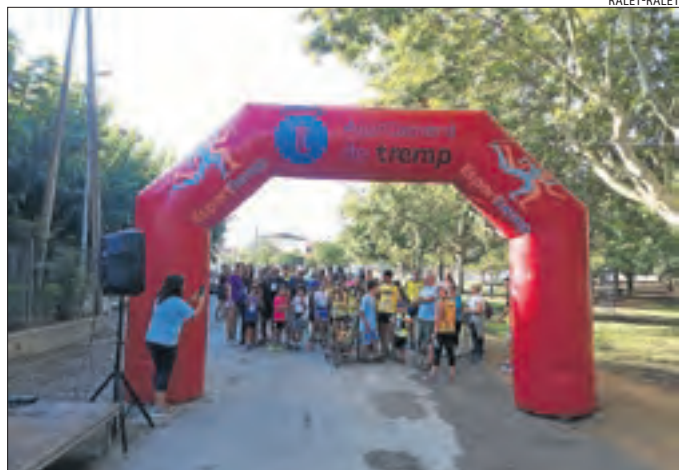
Una caminada va obrir una jornada plena d'activitats.