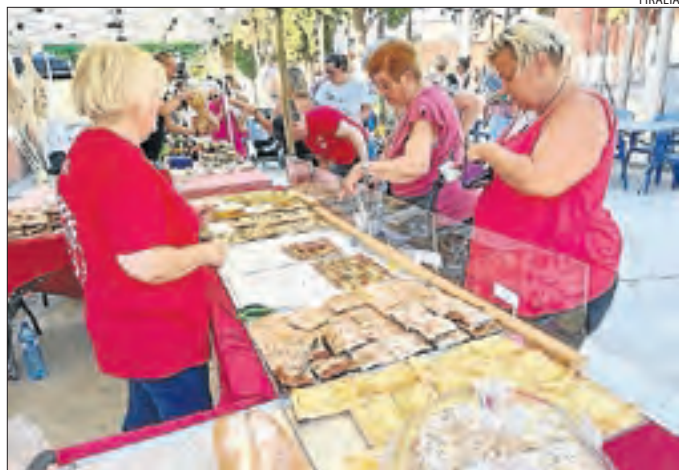
Clients en una de les parades del Mercat Gourmand.