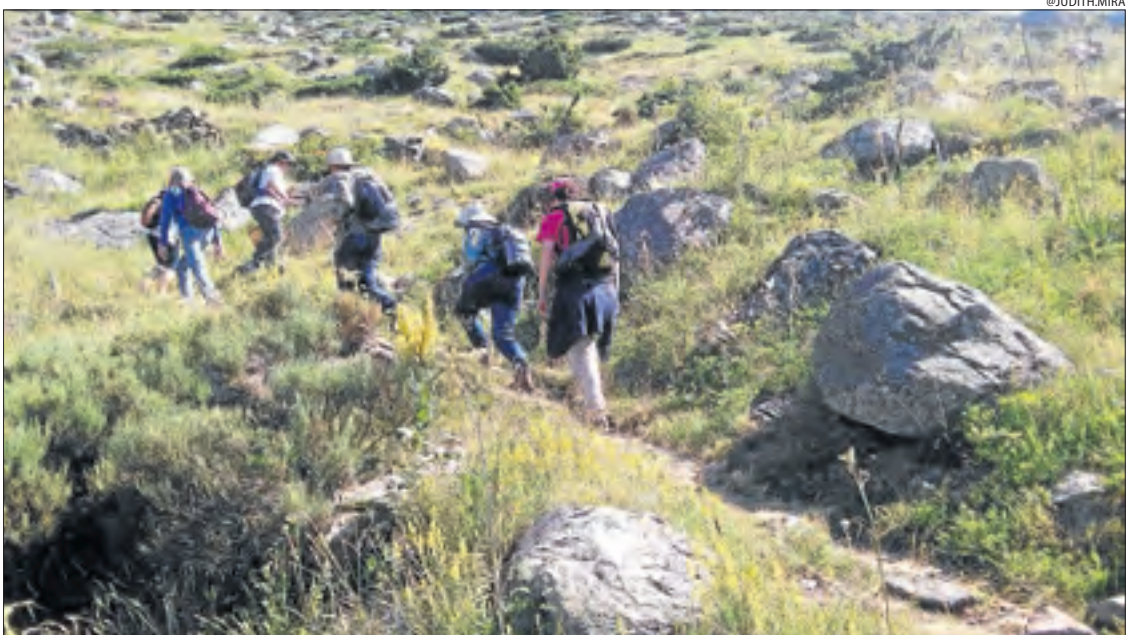
Caminar en família. El senderisme és una activitat que compta cada vegada amb més practicants.

"Cada vegada més el senderisme guiat s'ha convertit en una