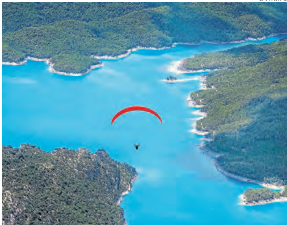
Els esports aeris tenen a Lleida una llarga tradició.