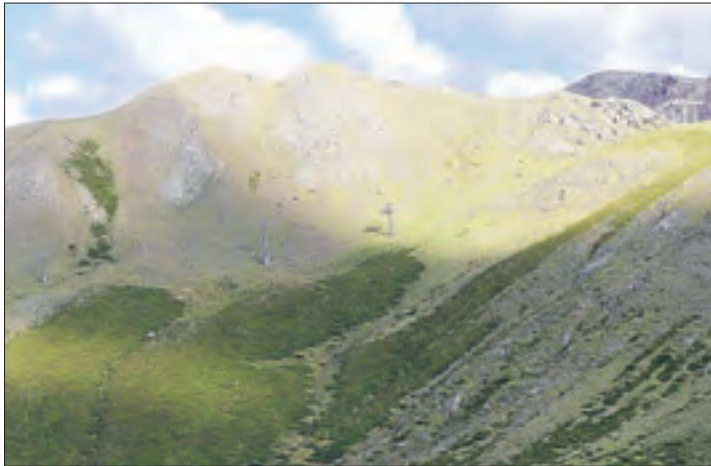
Imatge d'arxiu de les pilones del remuntador de Filià.

Les finques tenen un preu de sortida de 2,3 milions d'euros i formen part del SAU E-1. Es tracta d'un sector que, segons la normativa urbanística de la Torre de Capdella, s'havia de desenvolupar alhora que l'estació d'esquí de Filià. La fallida del promotor la va deixar inacabada, igual que el