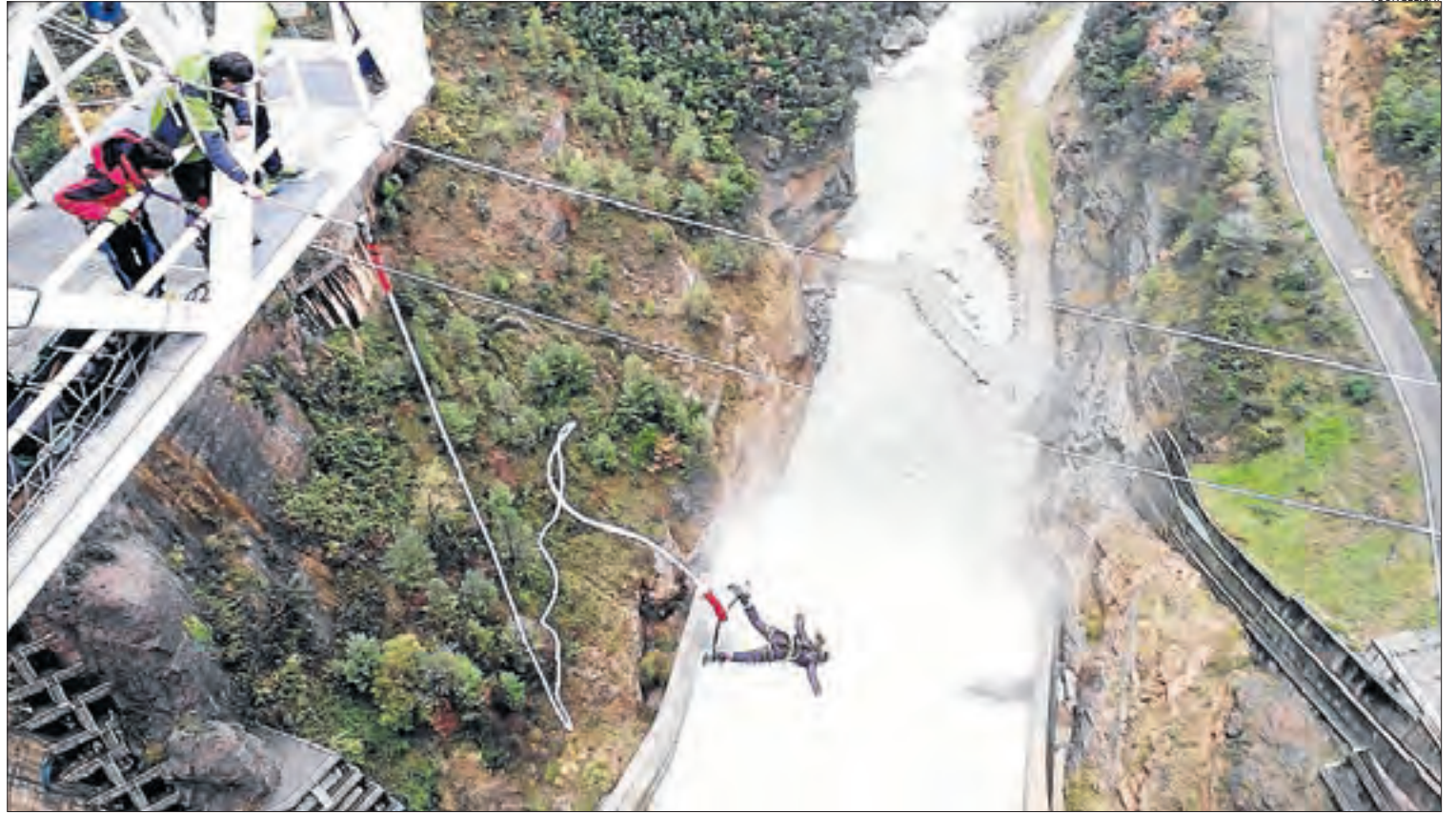
Un salt espectacular. La presa de la Llosa del Cavall és la tercera més alta del món en la qual es practica el bungee jumping.

La importància del sector en l'economia lleidatana és també evident. El 2019, els 767.789 serveis contractats, que van suposar una xifra rècord amb un creixement del 4,79 per cent respecte al 2018 (any en què hi va haver 731.017 serveis), es van repartir en 374.717 de terra, 369.675 d'aigua i 23.397 d'aire. Aquest 2019, el turisme actiu i l'esport d'aventura va ocupar 2.016 persones, de les quals 822 van treballar a temps complet i l'impacte econòmic d'aquest sector va ser de 108,65 milions d'euros. El 2020, en plena explosió de la Covid hi va haver uns 400.000 serveis.