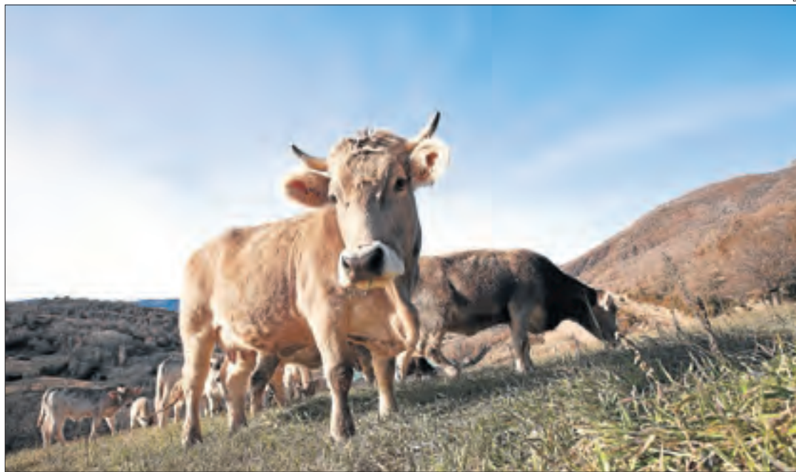
Les vaques pasturen tot l'any seguint el sistema tradicional extensiu.

Tot plegat, garantint la traçabilitat, controlant cada etapa de la cadena de manera que arribi tota la informació al consumidor. De fet, totes les peces a comercialitzar s'identifiquen mitjançant etiquetes amb precinte i logotip de la Indicació