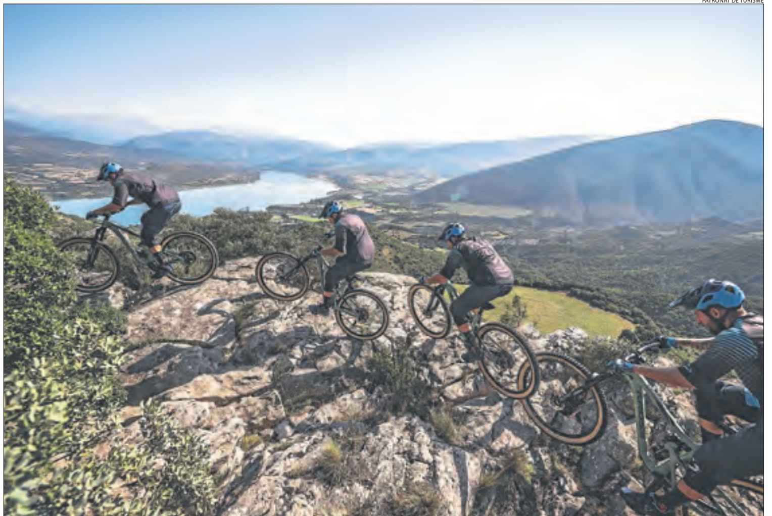
Un grup de ciclistes fa una ruta en un dels espectaculars paisatges que ofereixen les comarques lleidatanes.

Des del Patronat es destaca la ràpida recuperació de les xifres anteriors a la pandèmia i, segons les dades amb què