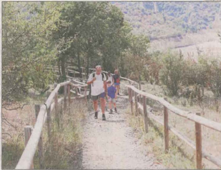
Imatge d'arxiu de senderistes sortint de la Masieta.

Les xifres de visitants el 2020 es van veure afectades pel confinament i restriccions a desplaçaments a la primavera, mentre que el tancament per allaus a finals d'any va impedir l'arribada de visitants. Tanmateix, aquell any Mont-rebei va rebre fins i tot més visitants que el 2019: va tancar l'exercici amb 34.387, a causa d'una afluència de públic massiva que es va concentrar a l'estiu i va superar els 12.000 al setembre. En canvi, el 2021 va acabar amb només 13.949 visites a la Masieta, a causa que el congost va estar tancat la major part de l'any per risc de despreniments.