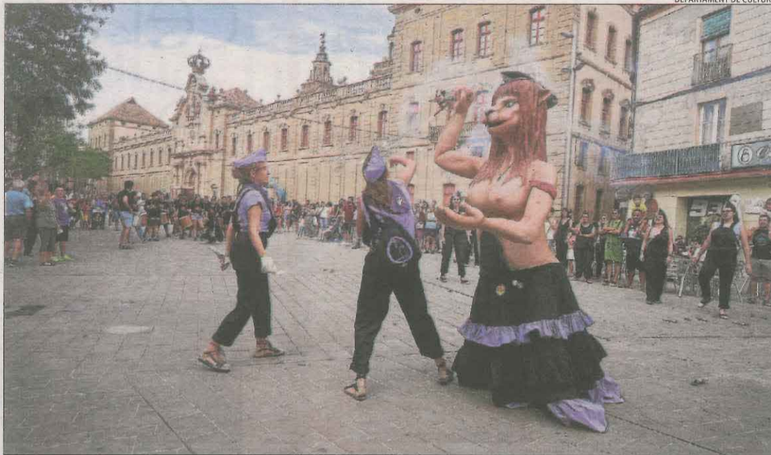
Cercavila de dimecres a Cervera com a acte previ a l'Aquelarre, que comença avui.

Com a prèvia a la festa, la consellera de Cultura, Natàlia Garriga, va visitar dimecres la capital de la Segarra per conèixer en primera persona els preparatius. Acompanyada de l'alcalde, Joan Santacana, i dels regidors de la Paeria, Garriga va assistir a la cercavila del Dimecres de Cendra i va gaudir de les activitats al Carreró de les Bruixes, on es recreen les primeres edicions de la festa amb el popular espectacle de titelles, entre altres propostes.