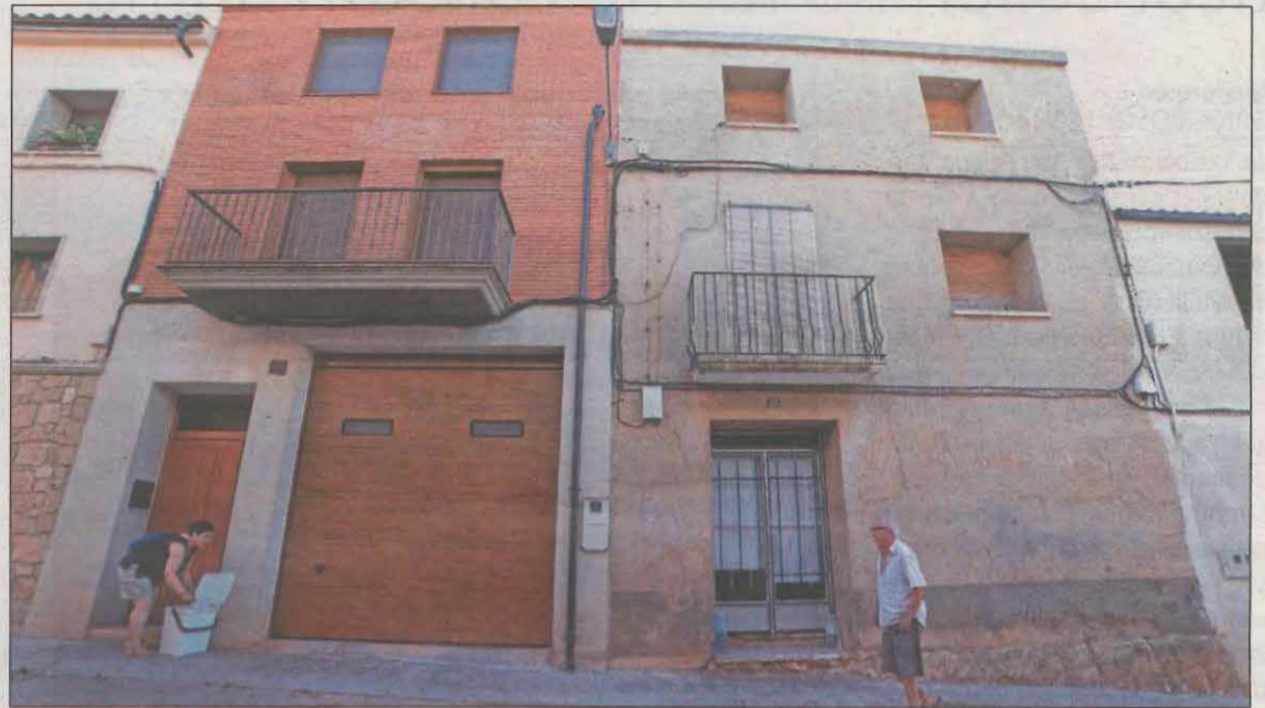
Imatge d'un carrer del municipi de Torrebesses, al Segrià

"Aquesta és una opció més viable per anar a viure al món rural, tenint en compte els pocs estalvis que segurament pots tenir sent encara molt jove", assegura. Delga i la seva parella van trobar després una casa de lloguer a la mateixa zona per tenir hort i crear una escola de "permacultura", que era el somni que la jove perseguia. "La casa la vam aconseguir gràcies als nostres contactes perquè costa molt do-