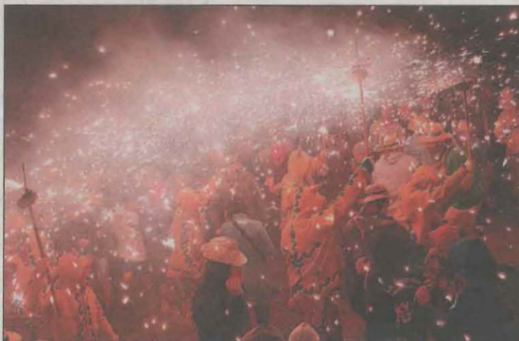
Imatge de la celebració d'enguany

Un any més, l'Aquelarre ha comptat amb la implicació de les entitats i professionals cer-