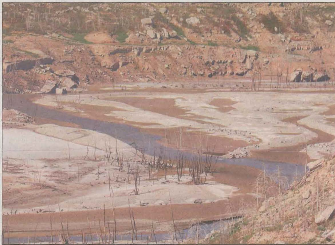
Imatge inèdita del pantà de Rialb, a la conca del Segre, en aquestes dates

Les darreres pluges no són significatives i la campanya de reg acabaria a mitjans de setembre