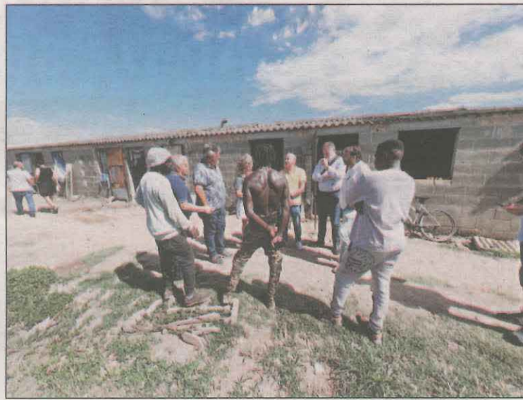
El sindicat va visitar un assentament il·legal de temporers

Des del sindicat van denunciar que a Catalunya existeixen 7 grups professionals en aquest sector i que 5 d'ells es troben per sota del salari mínim interprofessional. En aquest sentit, van posar de manifest que les tres principals patronals es neguen a actualitzar les taules salarials del Salari Mínim Interprofessional de l'any 2021 i del 2022 i van reclamar una taula de negociació per tractar l'augment dels salaris i la millora de les condicions laborals dels treballadors. UGT també va