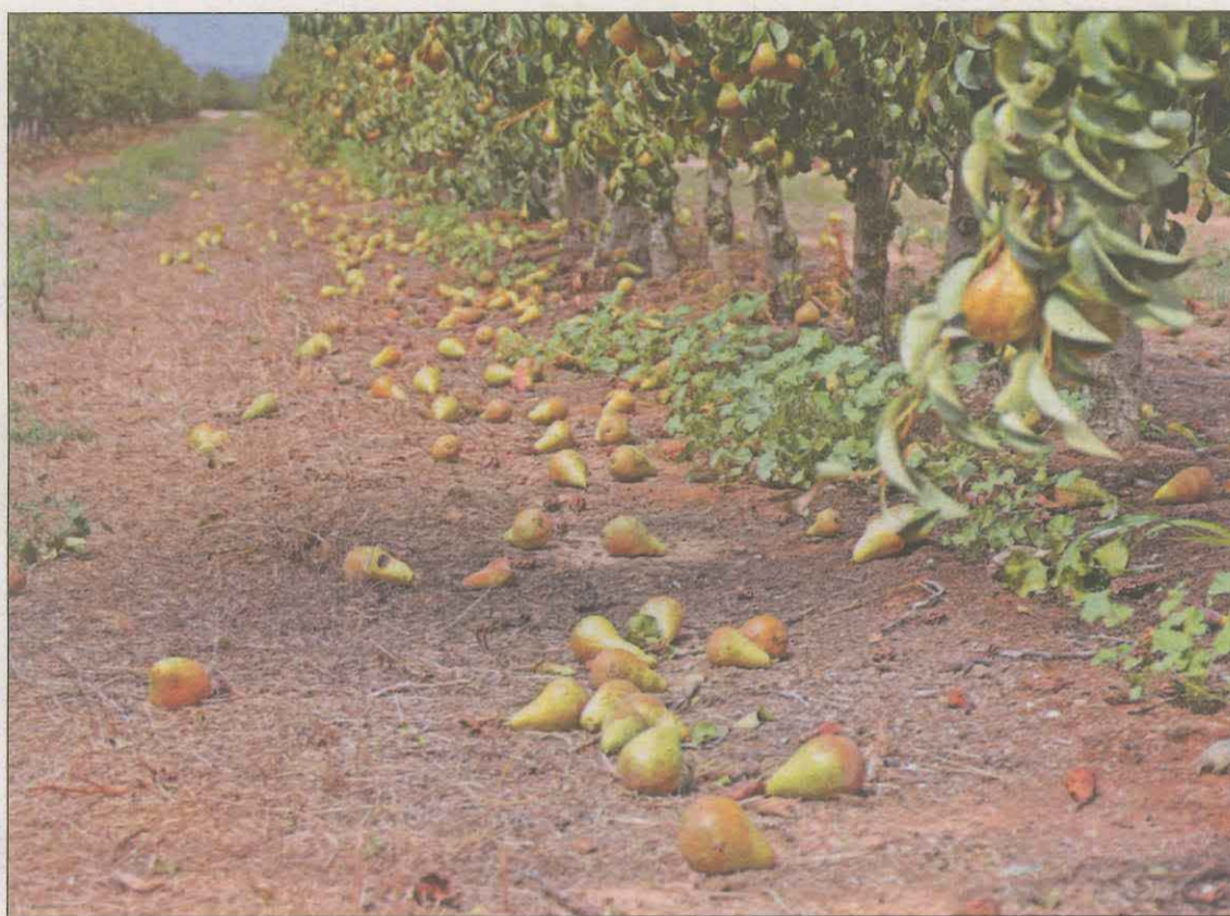
Una de les finques afectades per la forta ventada. Aquesta es troba a l'Horta de Lleida