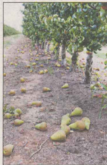
El vendaval dejó muchas piezas de fruta en el suelo

► Un desprendimiento corta la línea de ferrocarril de la Pobla de Segur entre Àger y Cellers