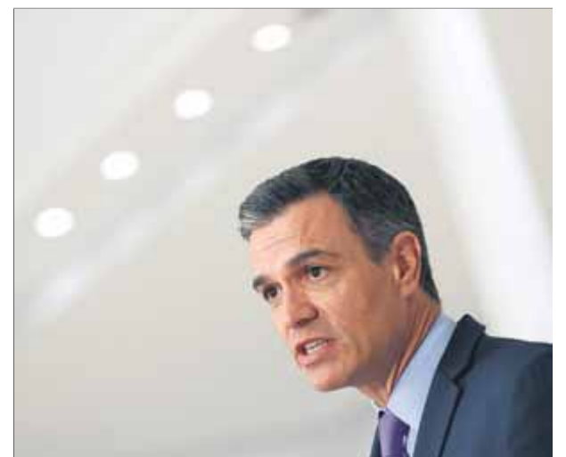
El president Pedro Sánchez, en una compareixença davant la premsa a La Moncloa ara fa uns dies

Tribunal Constitucional no revocarà els indults concedits als líders independentistes perquè el seu govern "va complir amb la llei i va reivindicar un dret que és en la Constitució". Sánchez, en canvi, no va ser taxatiu sobre si Laura Borràs hauria de dimitir: "És JxCat i la política catalana que ho han de decidir." ■