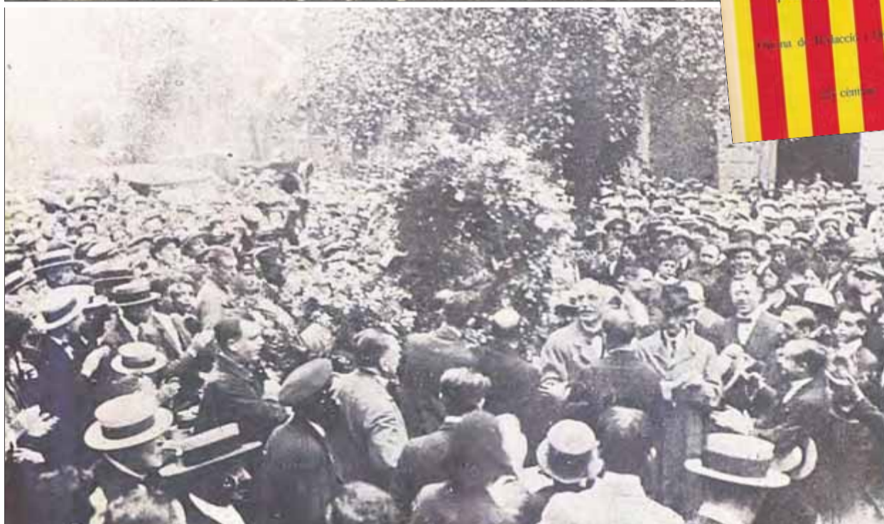
L'acte fundacional d'Estat Català (a dalt) i la primera Diada de l'11 de setembre en què va participar

ços que havia fet “per acoblar tots els nacionalistes”, tot i haver de lluitar contra “un pessimisme descoratjador”. També va fer referència a l'escenari espanyol i va remarcar la necessitat d'organitzar-se “perquè Catalunya no s'hi trobi arrossegada”. El diputat de les Borges va afirmar que calia “aixecar l'ideal edifici de la llibertat de Catalunya; que cada pe-