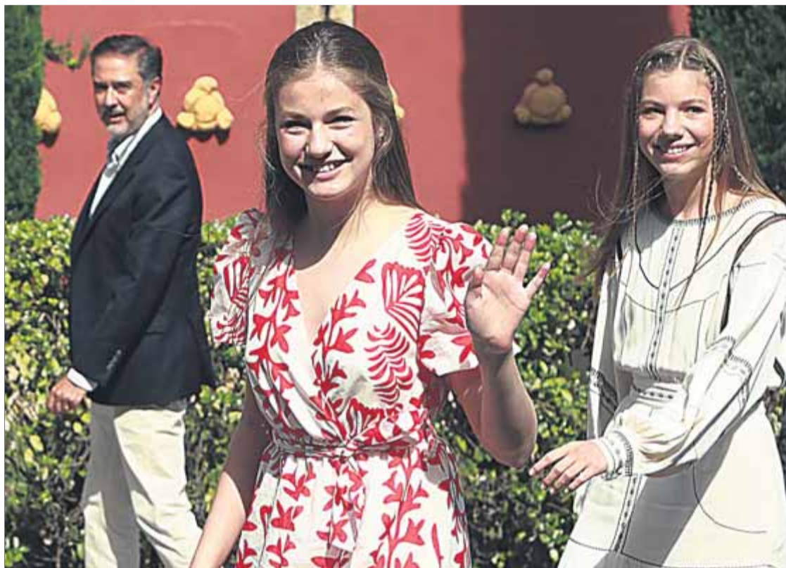
La princesa Elionor, amb la seva germana, la infanta Sofia, ahir a Figueres