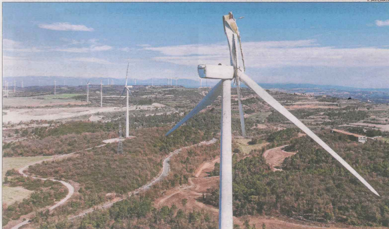
La pala trencada d'un dels molins del parc eòlic de Veciana, a prop de Sant Guim de Freixenet, a la Segarra.