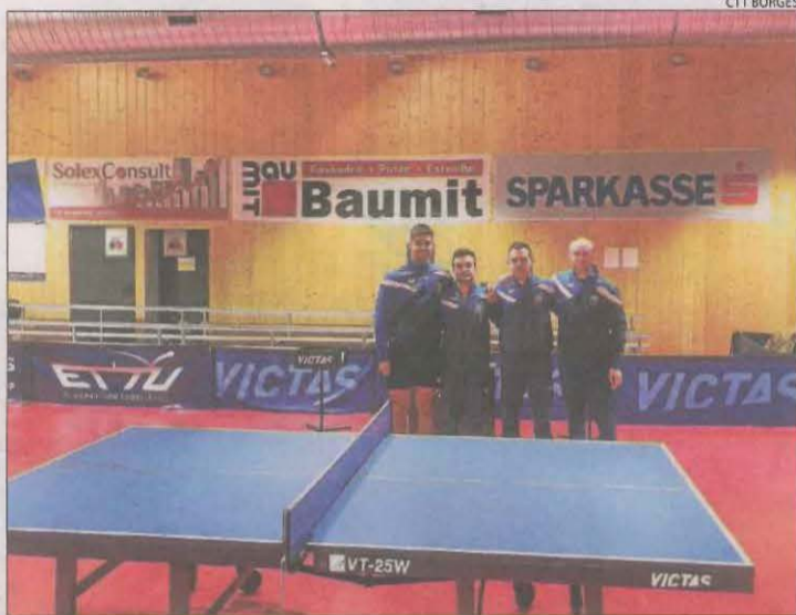
Els jugadors lleidatans, ahir a l'escenari del partit.

Ambdós conjunts ja es van enfrontar en la fase de grups amb victòria per 3-0 per a