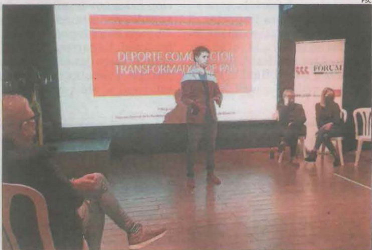
Un moment de l'acte que va organitzar ahir el PSC a Lleida.