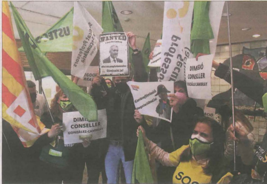
Representants sindicals van ocupar ahir la conselleria d'Educació.

Els preveuen dos hores de mentoria a la setmana en horari extraescolar de tarda i la