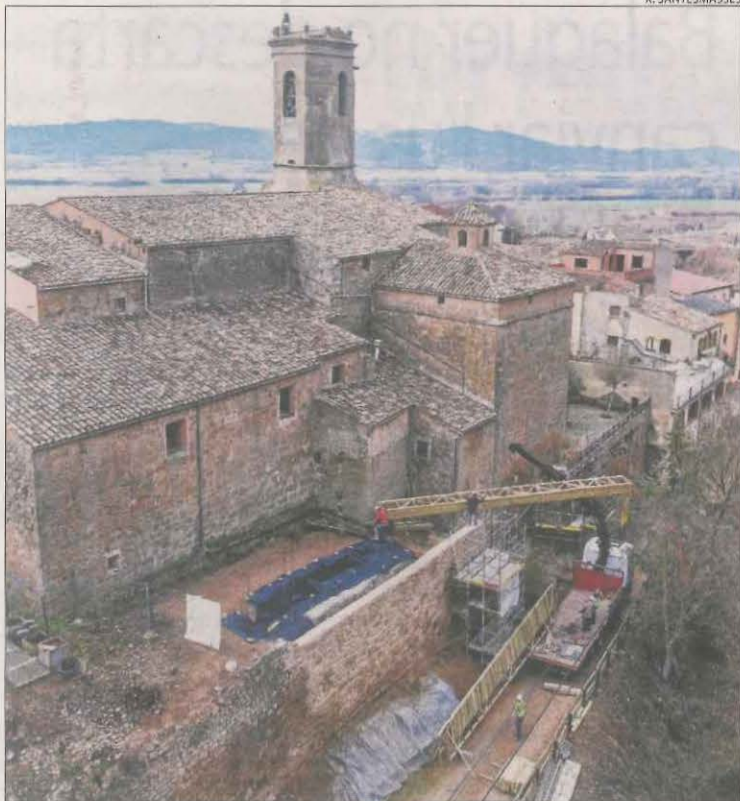
Vista de les obres a la muralla de Torà.