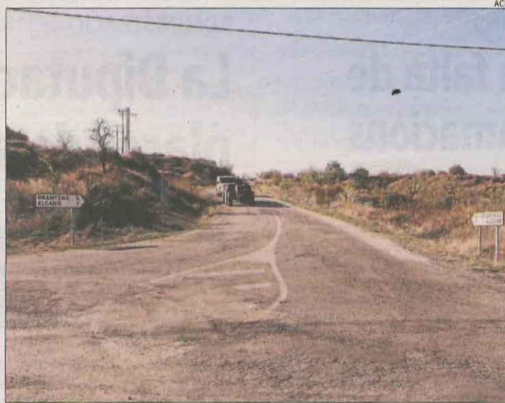
La pista de Granyena al Cogul està en males condicions.

La corporació provincial afirma que estan a punt de tancar un acord amb la secretaria de Mobilitat