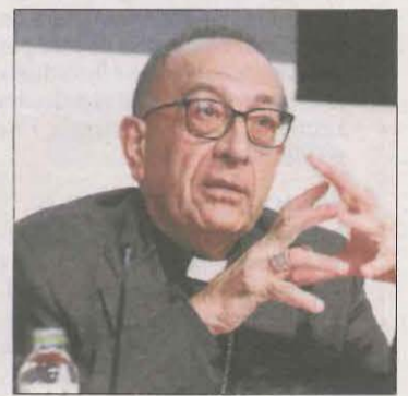
Juan José Omella.

En aquest sentit, els jutjats catalans investiguen des del 2019 catorze casos d'abusos a l'Església. Tres, oberts pels jutjats de Reus, Valls i Tarragona, es troben sobreseguts provisionalment i un altre a Mataró està arxivat per prescripció. Així