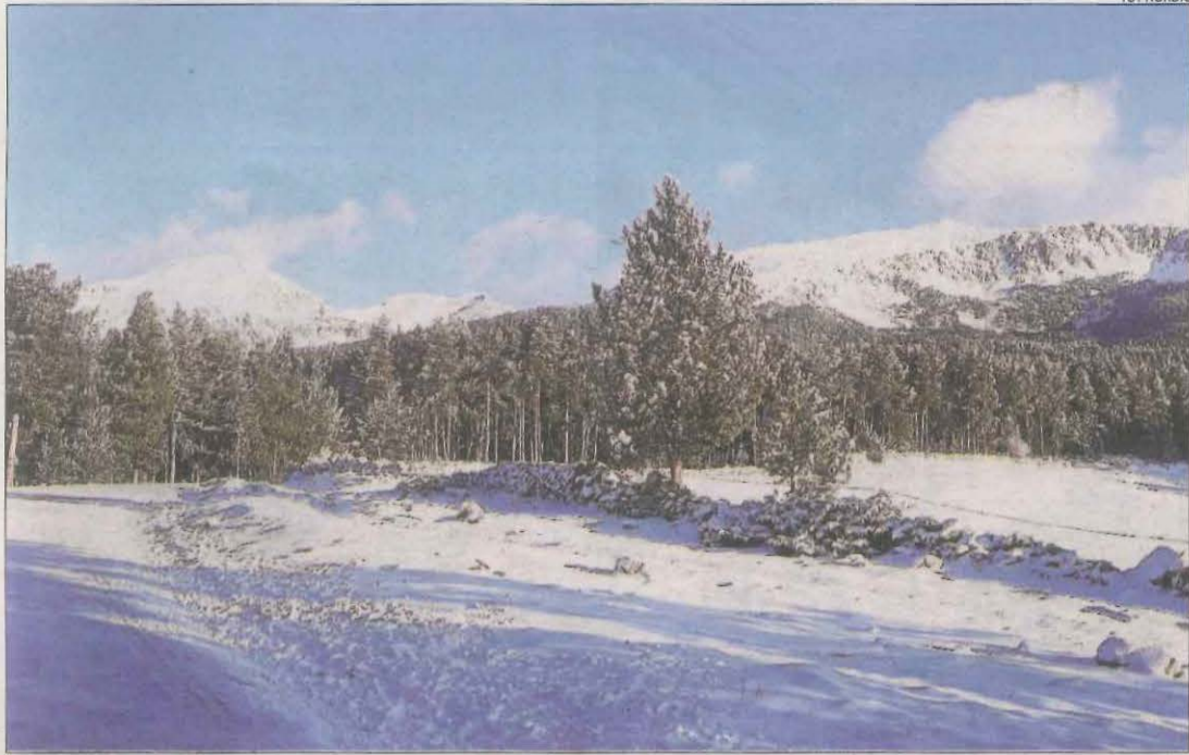
L'estació d'esquí de fons de Lles, on es van acumular entre 5 i 10 centímetres de neu.