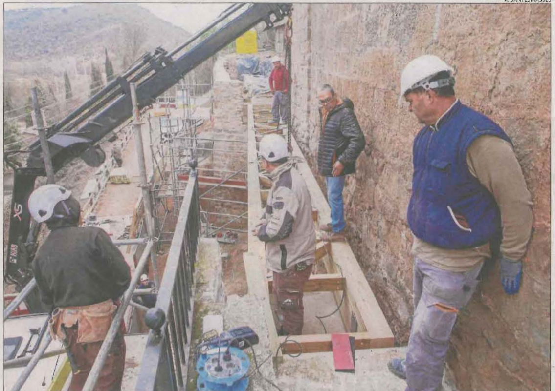
Els operaris treballant ahir en la instal·lació de la passarel·la de fusta.