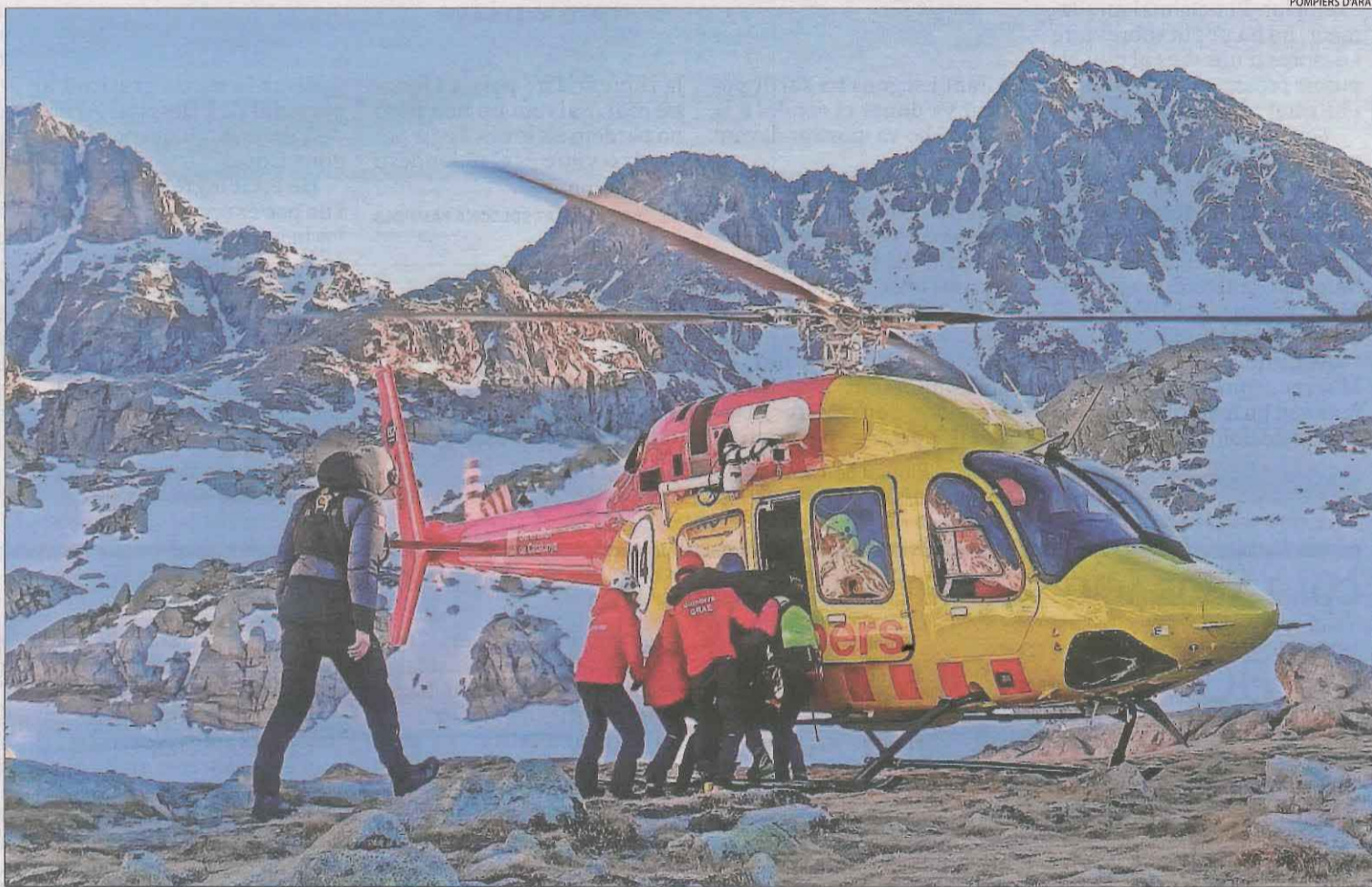
Imatge del rescat del 6 de febrer passat de dos excursionistes ferits a la Vall Fosca.