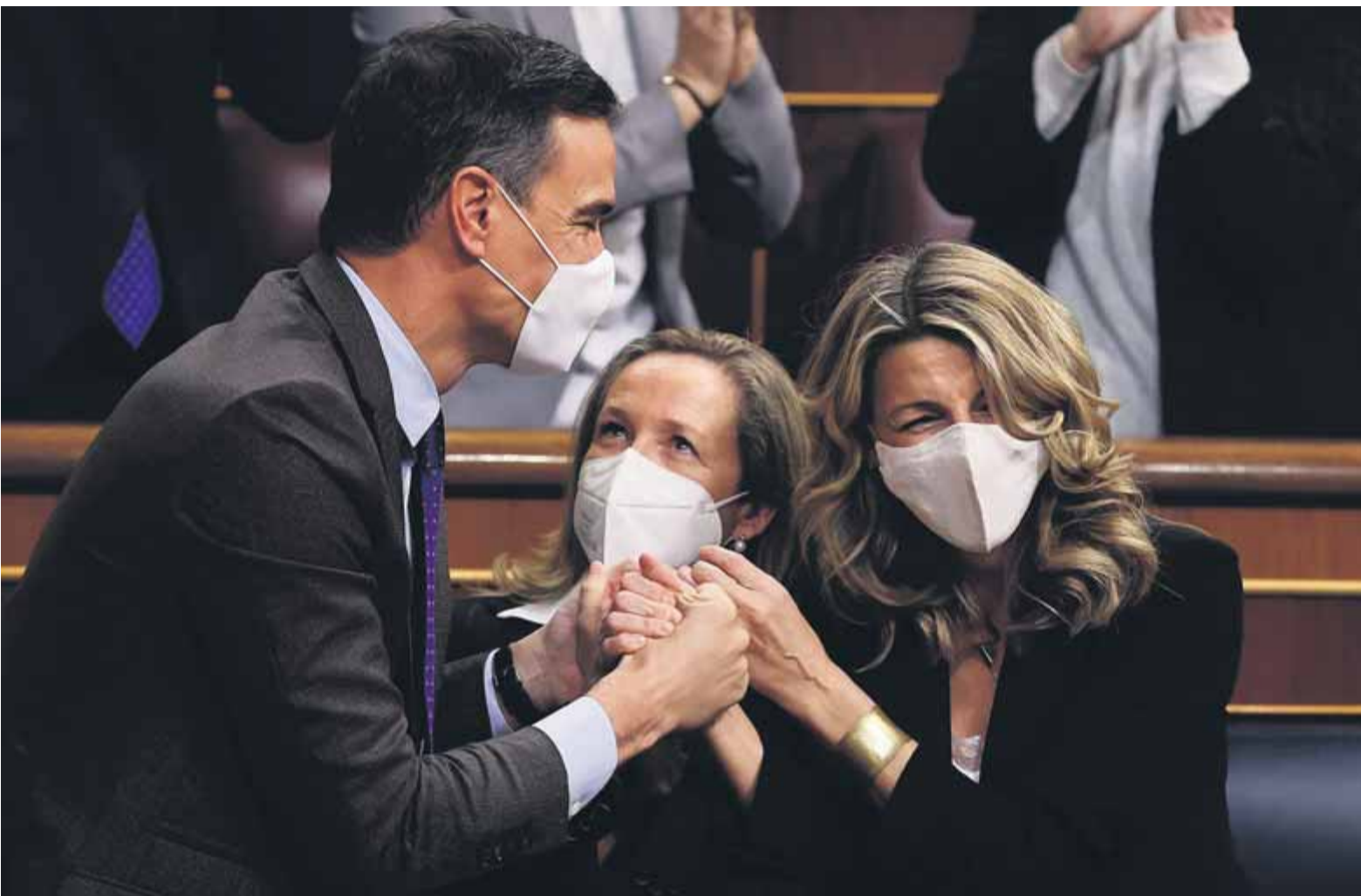
Sánchez i Díaz uneixen les mans després de l'esglai de sentir Batet cantant la derrota i, més tard, l'aprovació de la reforma laboral