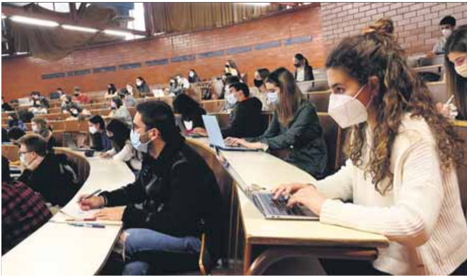
Estudiants a la Universitat de Barcelona