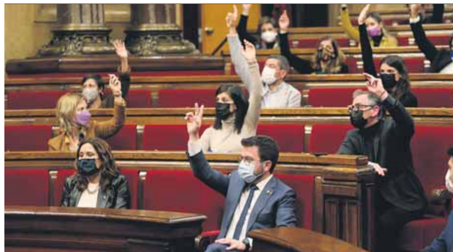
El president Pere Aragonès votant ahir a la sessió plenària d'ahir