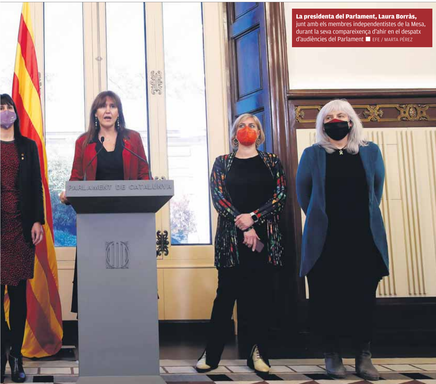
La presidenta del Parlament, Laura Borràs, junt amb els membres independentistes de la Mesa, durant la seva compareixença d'ahir en el despatx d'audiències del Parlament

aquells que garanteixin la inviolabilitat efectiva del diputat.