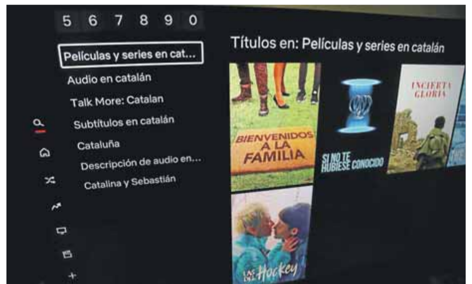
L'oferta de títols en català a la plataforma Netflix continua sent molt pobre. ■ J.RAMOS

Amb un total de 3,8 milions de subscriptors a Catalunya i 1,6 milions de llars abonades, Netflix lidera la llista de plataformes del sistema de vídeo a