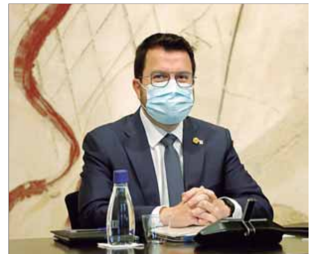
El president de la Generalitat, Pere Aragonès, ahir, durant la reunió del Consell Executiu