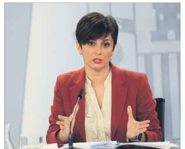
La ministra Isabel Rodríguez (Política Territorial) obre la descentralització de seus fora de Madrid

no troncal i en les ofertes valorarà factors com ara la taxa d'atur i la connexió de l'àmbit i el territori. Un exemple és el Centre Nacional d'Investigació i Emmagatzematge d'Energia a Càceres. “Volem revertir la concentració administrativa per cohesionar i compartir Estat”, apunta la ministra Rodríguez. ■