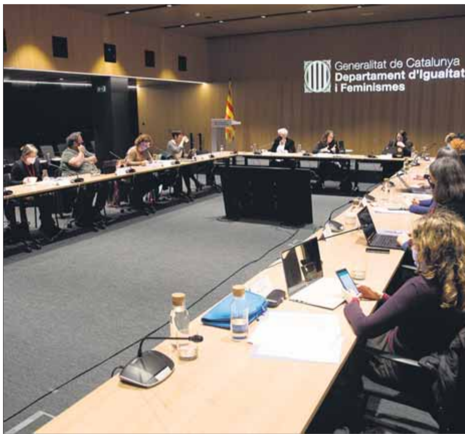
La consellera amb els agents socials i polítics que donen suport al pacte ■ ORIOL DURAN

“El pla pretén fer de la lluita per l'erradicació de les violències masclistes una qüestió de país”, va assegurar Verge, que va voler deixar clar que aquest pacte “no és una rèplica del pacte d'estat, perquè aquí ja tenim un programa específic i moltes accions dotades de pressupost”, sinó que més aviat és “un impuls polític en un moment en què s'està produint una ofensiva contra els drets de les dones i el col·lectiu LGTBI per part de partits antidrets i antigè-