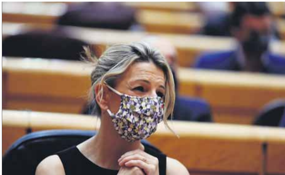
La vicepresidenta Díaz negocia amb ERC que no voti en contra de la reforma

El parlamentarisme està ple d'ensurts que obliguen a contenir la respiració en votacions que van d'un vot (així va succeir al Congrés amb la investidura de Pedro Sánchez), però el PSOE dona per aprovada demà al Congrés una llei que és el segon gran examen de la legislatura: la reforma laboral que ha de posar fi a la normativa de Mariano Rajoy del 2012 i que és l'estendard progressista de la vicepresidenta i candidata de Podem el 2023, Yolanda Díaz. El problema és la companyia: la majoria no ve dels socis d'investidura com ara ERC, sinó de la suma antinatural de Ciutadans, el PDeCAT (aquesta tarda una executiva extraordinària fixarà el vot però el PSOE el dona per fet), Més País, Compromís, Teuel Existe, el Partit Regionalista de Cantàbria, Nova Canàries i Coalició Canària. "Els que votin no a aquesta reforma laboral estan dient sí al marc de relacions laborals dissenyat pel PP", avisa Díaz a ERC en un intent d'arrencar almenys una abstenció als de Garbiel Rufián.