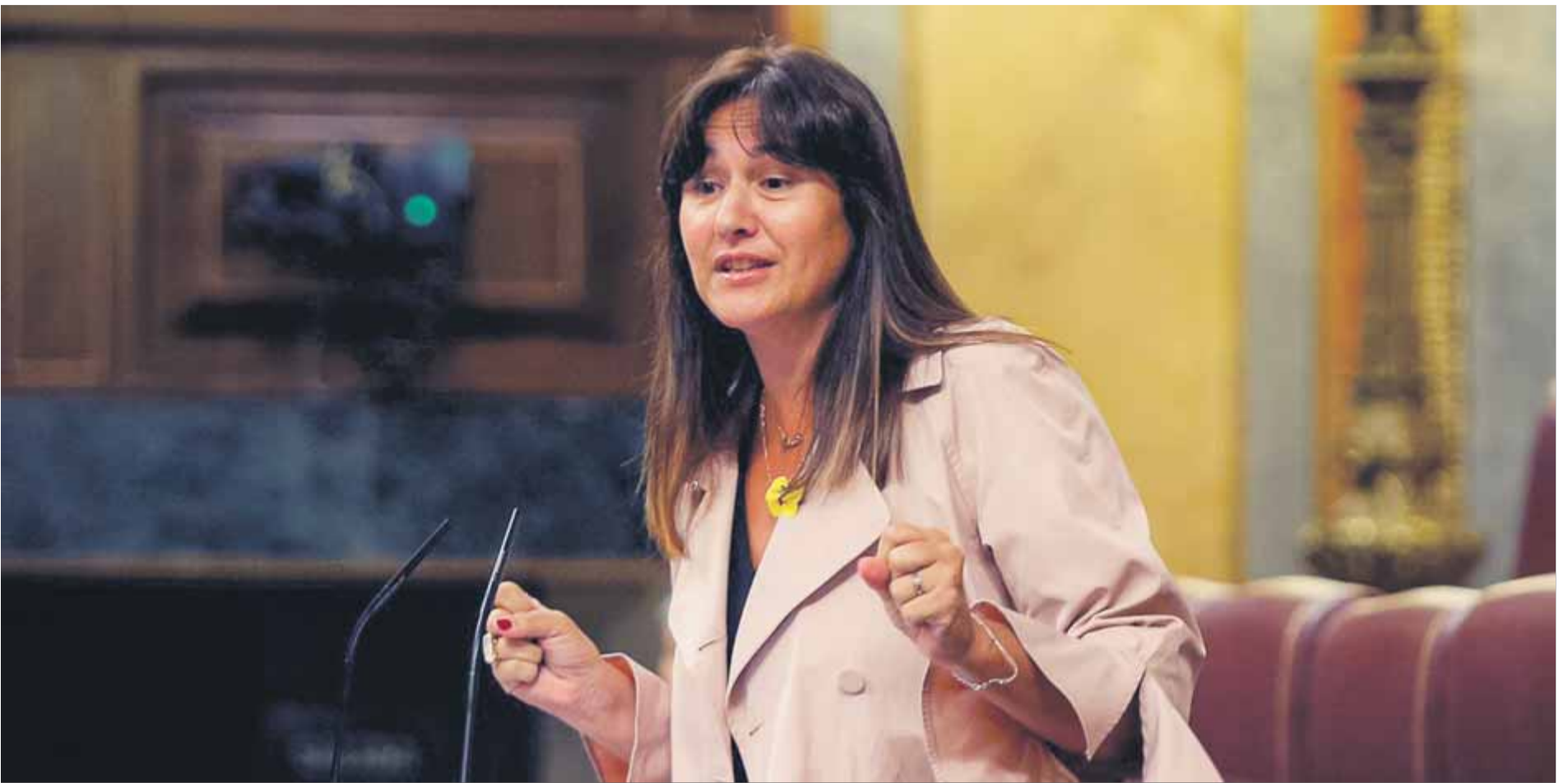
Laura Borràs, en una de les intervencions al Congrés com a portaveu de Junts per Catalunya el 2020. El PP i Cs van recórrer contra la fórmula amb què havia pres possessió juntament amb d'altres