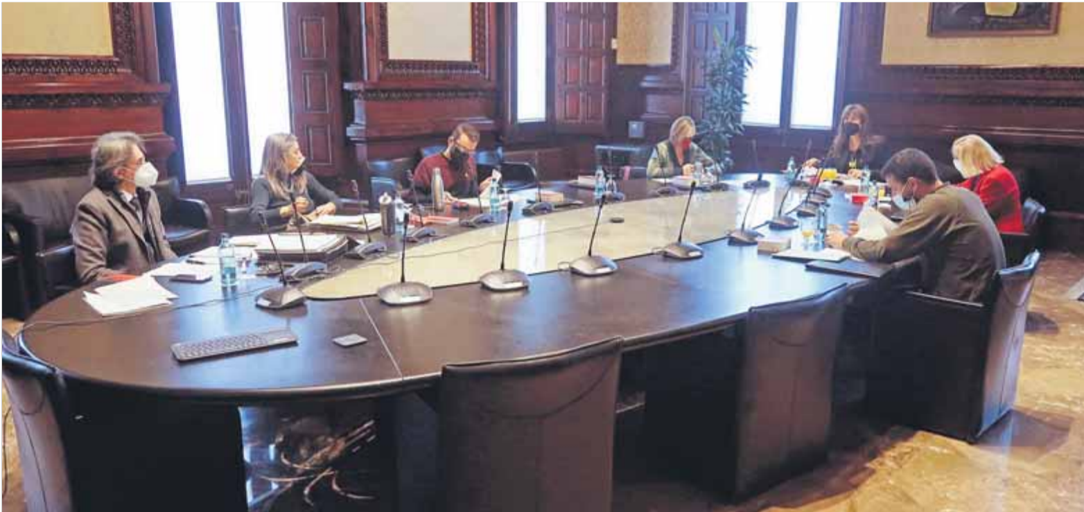
Reunió de la mesa del Parlament del 21 de desembre, quan es van aprovar modificacions en les polèmiques llicències per edat, que ara s'han eliminat

■ El Consell de Personal no qüestiona la decisió de suprimir les llicències d'edat, però sí que la mesa ho fes "menystenint la negociació col·lectiva" ■ Els advocats estudien si vulnera els principis de legalitat