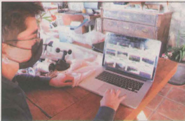
Un membre del projecte consultant les càmeres

Els interessats compren el material i els membres del projecte fan la instal·lació, l'assistència tècnica i l'assessorament. Des del web, es poden veure totes les càmeres i també pegen les previ-