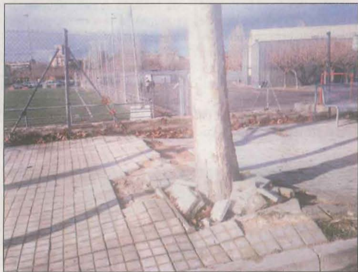
Estat en què es troba la vorera del Passeig del Parc

cent i juvenil ha patit una deterioració generalitzada de la seva salut mental i emocional. Consistent d'aquesta problemàtica, el govern d'Aran, per mitjà de l'empresa Aimentia Health Tech, ha volgut brindar suport a l'Institut d'Aran amb un projecte pioner que té com a objectiu millorar la detecció de les problemàtiques.