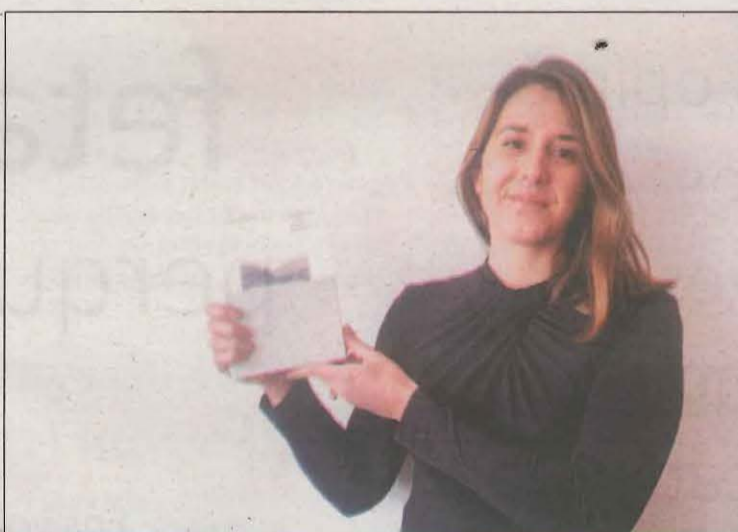
L'obra estarà disponible a partir del proper 15 de febrer

L'hospital de cartró de Capdella. Una icona de l'arquitectura prefabricada és el segon número de la Col·lecció 'La Fàbrica', i és una coedició d'EUMO, el mNACTEC i el Museu Molí Paperer de Capdella. Seguint l'evolució de l'arquitectura prefabricada euro-