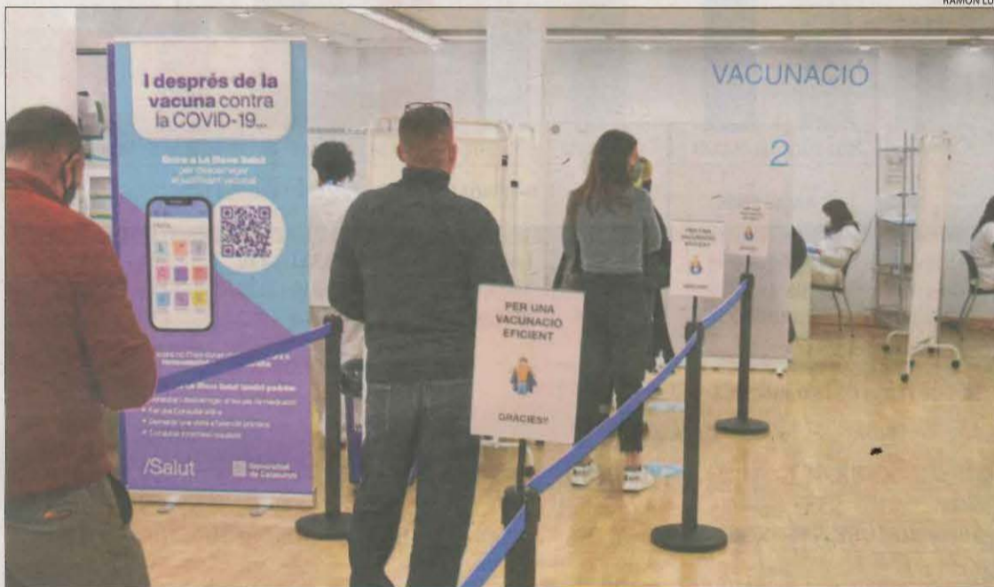
Cues ahir al punt de vacunació de l'avinguda de les Garrigues a Lleida.

■ L'administració de la tercera dosi (o de record) de la vacuna contra la Covid està dirigida a tots els majors de 40 anys, personal sanitari i sociosanitari i als vacunats només amb AstraZeneca i amb Janssen, a causa de la disminució dels anticossos. L'estratègia del ministeri de Sanitat és que es vagi inoculant per edats de manera progressiva, per la qual cosa es preveu que els pròxims siguin els de 30 a 39 anys, tot i que encara no hi ha data fixada. Tot i així, l'objectiu és que el 80 per cent dels que tenen entre 50 i 59 anys la tingui la setmana del 24 de gener -ara és el 38 per cent-, i el 80 per cent dels de 40 a 49 anys, la primera de març -ara és del 11 per cent-. A més a més, la idea del Govern és que el 70 per cent dels menors d'entre 5 i 11 anys hagin rebut la primera punxada la setmana del 7 de febrer -la tenen el 28 per cent- i la segona, la setmana del 19 d'abril.