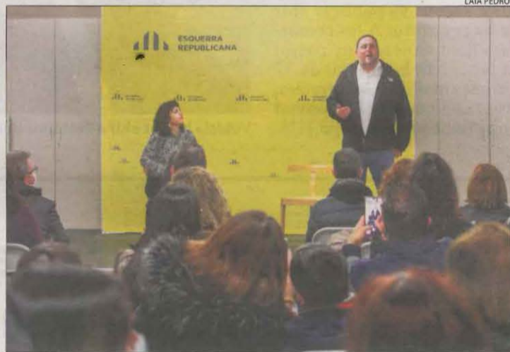
Junqueras a la xarrada que va protagonitzar ahir a Tàrraga.