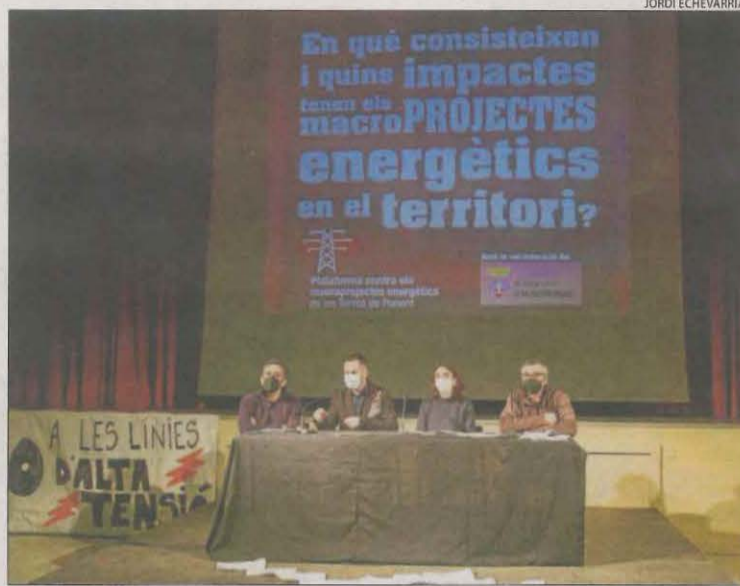
La presentació de la plataforma ahir a Albatàrrec.

Això es deu en gran part a les dos línies de molt alta tensió que el grup Forestalia projecta a través del pla de Lleida per transportar fins a Barcelona l'electricitat que generaran molins de vent i centrals foto-