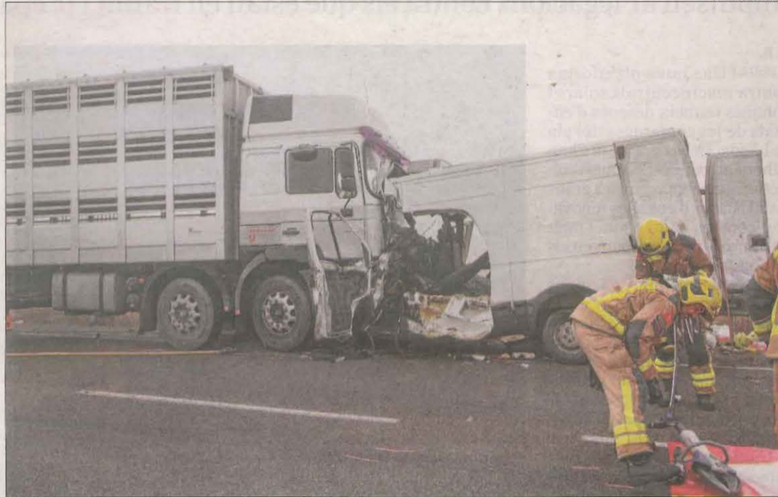
Brutal col·lisió ahir a primera hora entre un camió i una furgoneta a la C-16 a Artesa de Segre.

Per una altra banda, l'eliminació dels peatges eleva un 40% els accidents a les autopistes catalanes, amb l'AP-7 al capdavant en l'increment de trànsit i sinistres des del passat 1 de setembre, en comparació amb el mateix període de l'any 2019, segons va publicar ahir La Vanguardia . A les comarques lleidatanes, l'any passat va tancar amb un total de 37 víctimes mortals a la carretera, disset més que el 2020, tornant a nivells de prepanidèmia.