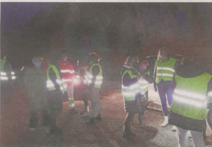
Els pares a la protesta d'ahir a les 7.30 del matí.