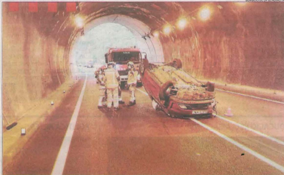
Vehicle bolcat ahir a l'interior del túnel dels Feixancs, a la C-13, a Salàs de Pallars.