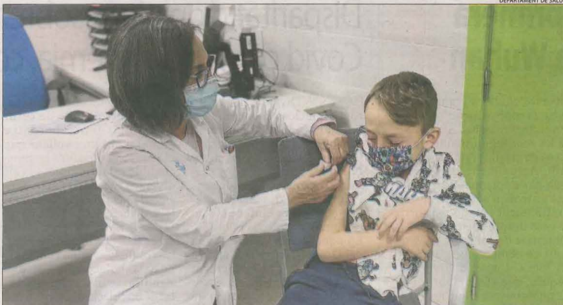
Un nen de Tremp va rebre ahir la primera dosi de la vacuna a l'ambulatori.

setmanes abans. De moment, la tenen prop del 30%, més de 7.000 menors, i només el 4% la pauta completa, ja que els que s'han contagiats de Covid només necessiten una punxada. Dilluns passat va arrancar el segon trimestre escolar en ple auge de contagis en la setena onada i a Lleida hi havia 1.463 alumnes i 321 professors confinats, segons el departament d'Educació, que ha nomenat 88 docents més per cobrir baixes després dels 120 de dilluns.