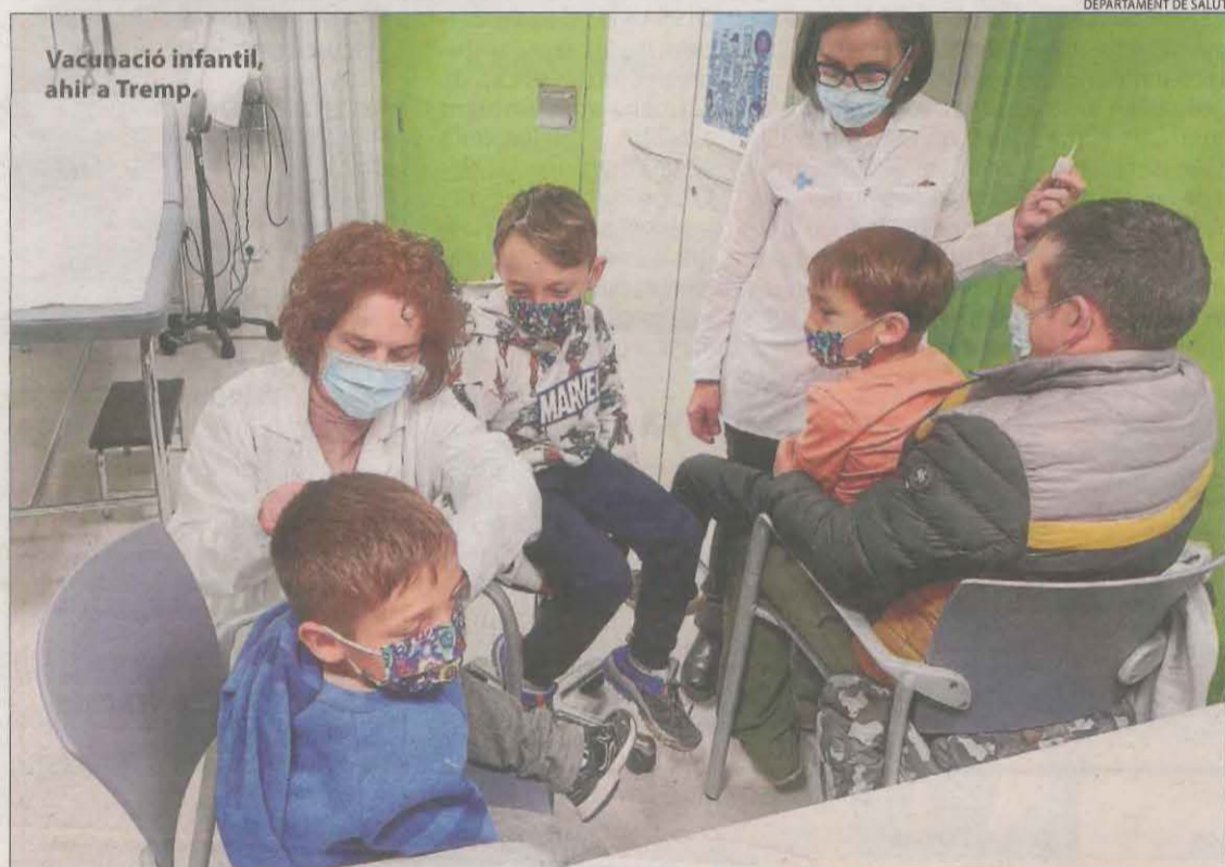
Vacunació infantil, ahir a Tremp.