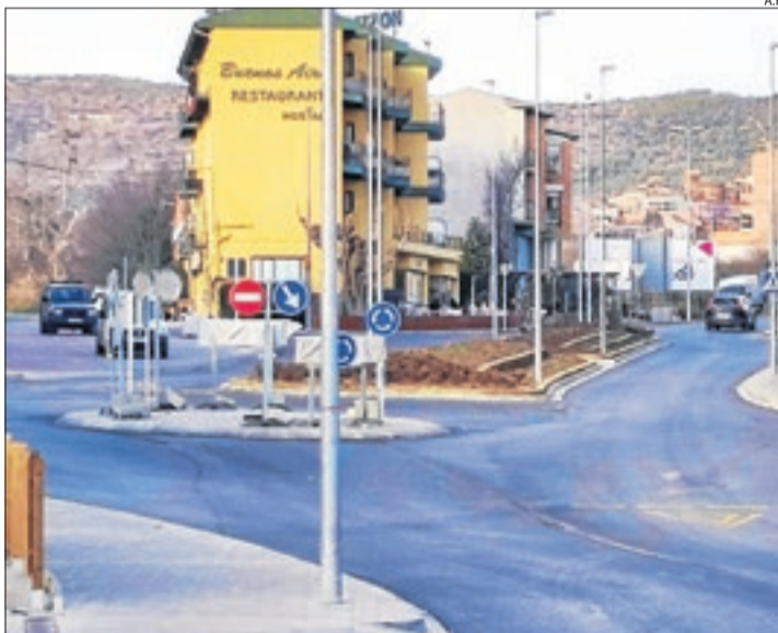
La polèmica rotonda de la C-13 a Tremp ja està finalitzada.