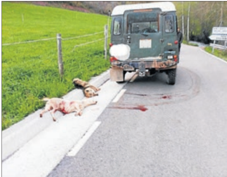
Vista dels animals abatuts al costat de la carretera.

Segons el seu relat, els gossos estaven atacant un vedell i, a l'intentar evitar-ho, es van encarar amb ell i va disparar "en legítima defensa". Un argument que ja va acceptar l'Audiència