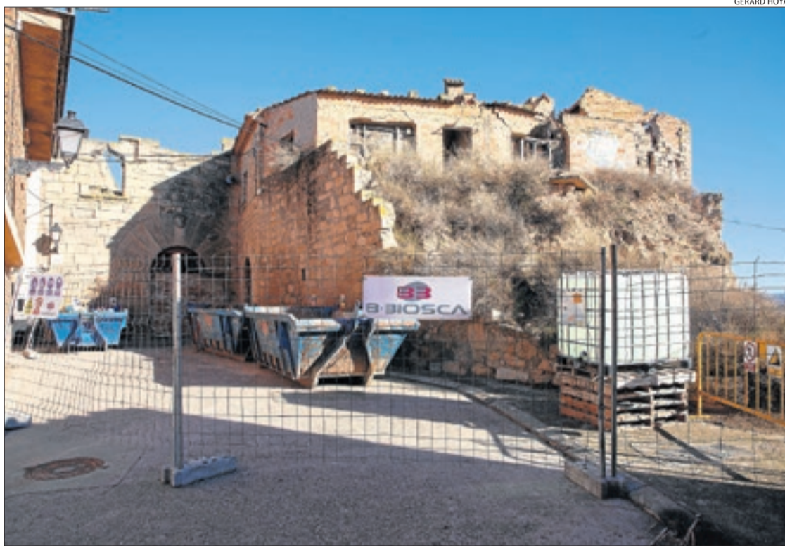
El recinte del castell està envoltat d'una tanca mentre s'hi porten a terme les obres.

La Diputació va decidir ajornar per precaució la contractació de les obres i va encarregar un nou projecte per preservar el castell. Tanmateix, el dete-