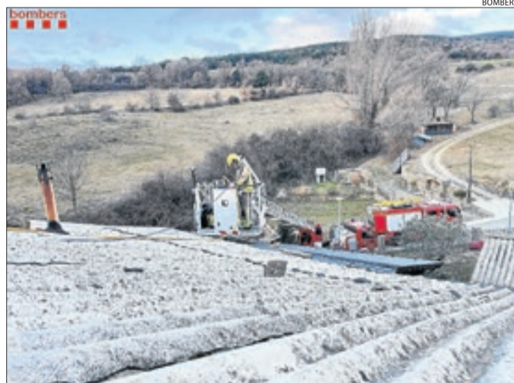
Revisant la xemeneia de la casa en aquest nucli de l'Alt Urgell.