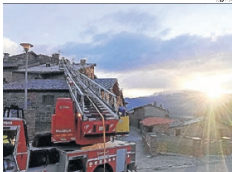
Els Bombers van treballar amb l'autoescala a Vilamitjana.