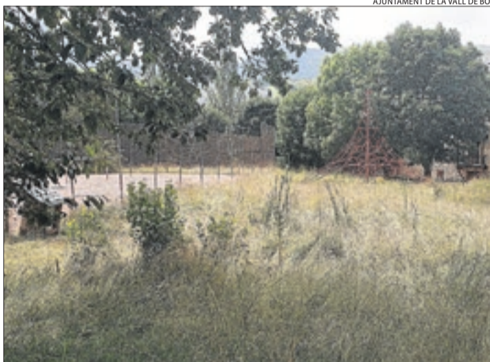
Imatge d'arxiu de part del sòl que vol l'ajuntament.