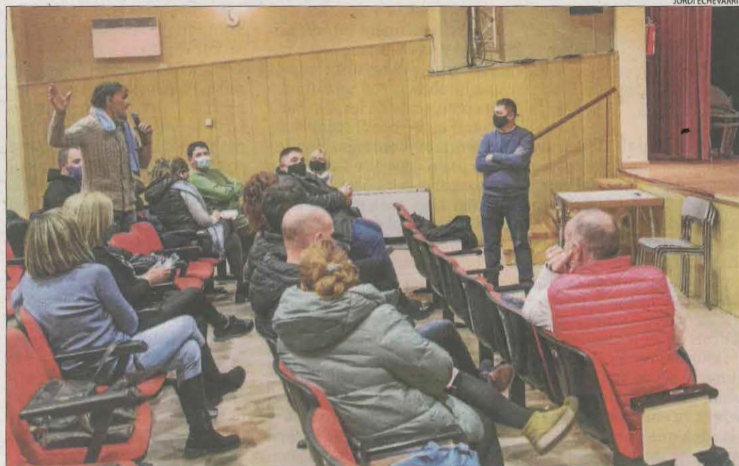
L'acte celebrat ahir a Alcarràs va reunir afectats pel projecte.

L'ha reprès amb el nou boom de les energies netes, esperonat per fons d'inversió internacionals i tecnologia que permet obtenir una producció elèctrica més gran amb un cost menor que fa una dècada.