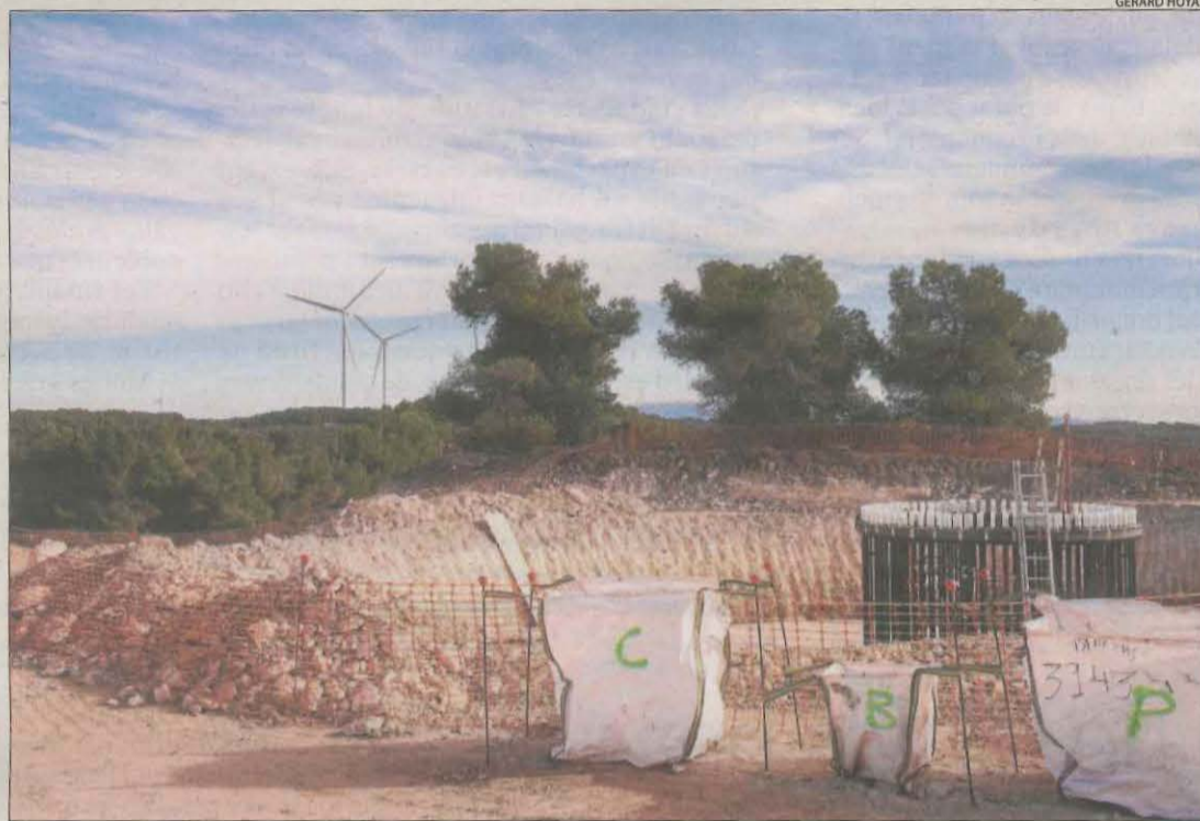
Obres d'un molí del parc eòlic de Solans, amb aerogeneradors de la Granadella al fons.