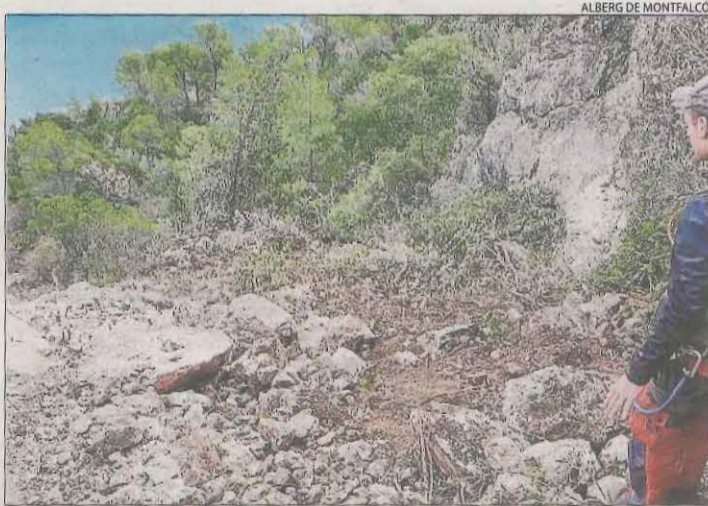
Les pedres que tallen un tram del camí a Santa Quiteria.