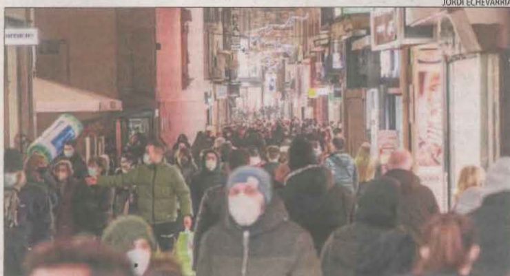
Últimes compres de Reis, ahir al carrer Major de Lleida.