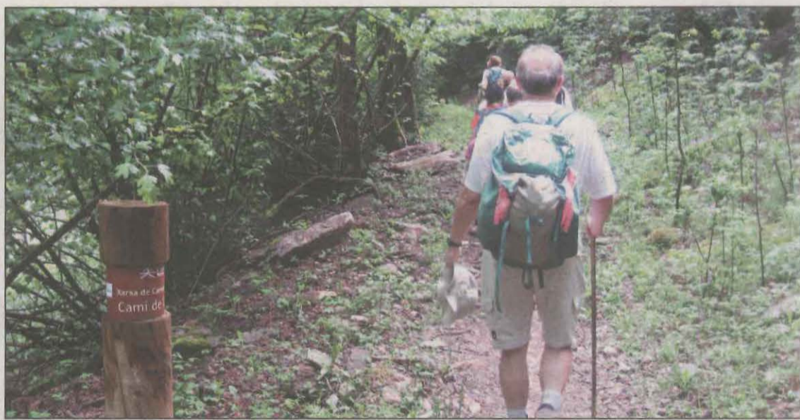
Es vol promoure la futura creació de productes de senderisme i BTT a la comarca

La Diputació, a través del Patronat de Promoció Econòmica, ha iniciat les obres de millora del ferm a la xarxa comarcal de camins i senyalització de la ruta BTT de la comarca de l'Alta Ribagorça. Aquesta millora està inclosa en el projecte "Camins tradicionals dels pirineus" de la Diputació de Lleida, que compta amb la col·laboració del Consell Comarcal de l'Alta Ribagorça i els fons FEDER i té un import d'adjudicació de 58.182,21 euros. Aquest projecte pretén dur a terme accions de revisió dels inventaris dels camins municipals i l'arranjament de diferents camins tradicionals, amb