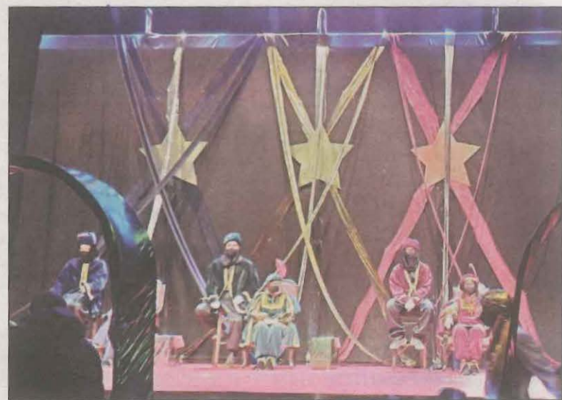
Es farà un trajecte d'aproximadament una hora de durada

Per tal de fer una activitat segura, enguany no es llençaran caramels des de les carrosses, s'ha reduït considerablement el nombre de patges ajudants per a evitar contactes i s'ha escurçat el temps de durada de l'activitat. Així doncs, amb prevenció però també amb il·lusió, el proper dimecres els infants de Tremp podran saludar als Reis d'Orient.