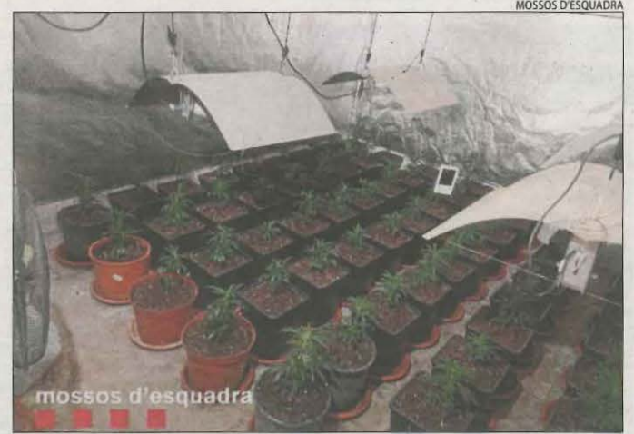
Imatge de la plantació oculta en un magatzem.