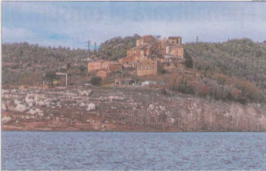
La Clua va quedar només parcialment negat sota les aigües del pantà. La CHE demolarà cases en ruïna.