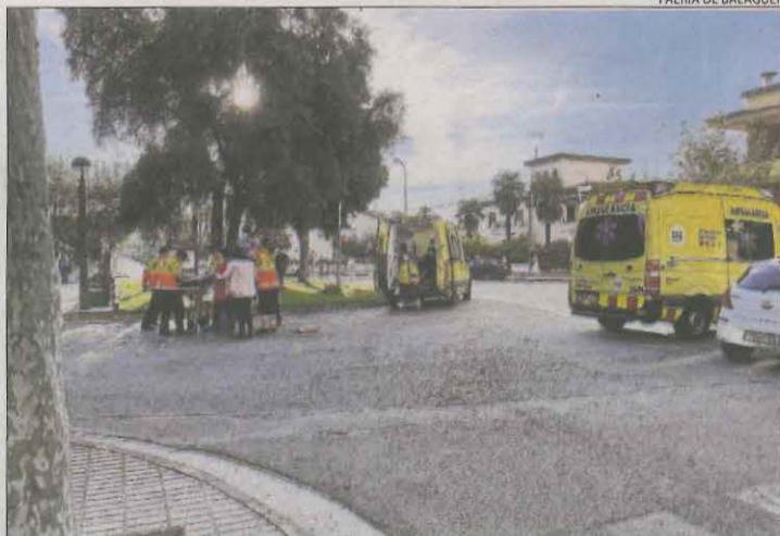
El SEM atén el ferit en l'atropellament de Balaguer.

Posteriorment, al voltant de les 9.15 hores, un vianant va