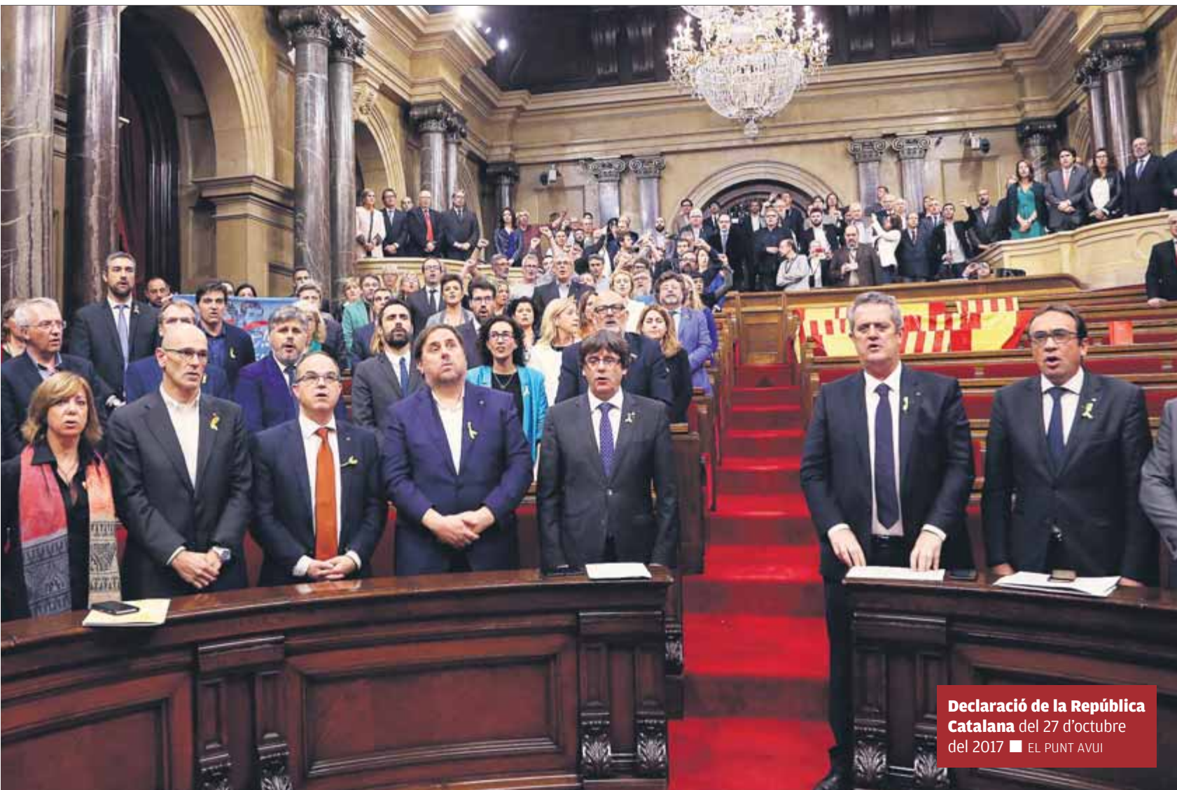
Declaració de la República Catalana del 27 d'octubre del 2017 ■ EL PUNT AVUI