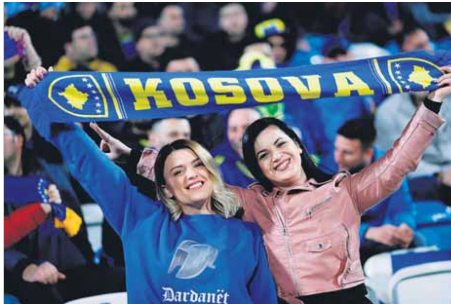
Dues seguidores de la selecció de futbol de Kosova, en un partit de l'Eurocopa

Somalilàndia, Alt Karabakh, Transnistria, Xipre del Nord, Ossètia del Sud, Abkhàzia, la República Àrab Sahrauí Democràtica, la República de la Xina (Taiwan) i Kosova. Palestina va entrar a les Nacions Unides com a estat observador el 2012, però tampoc n'és membre. La