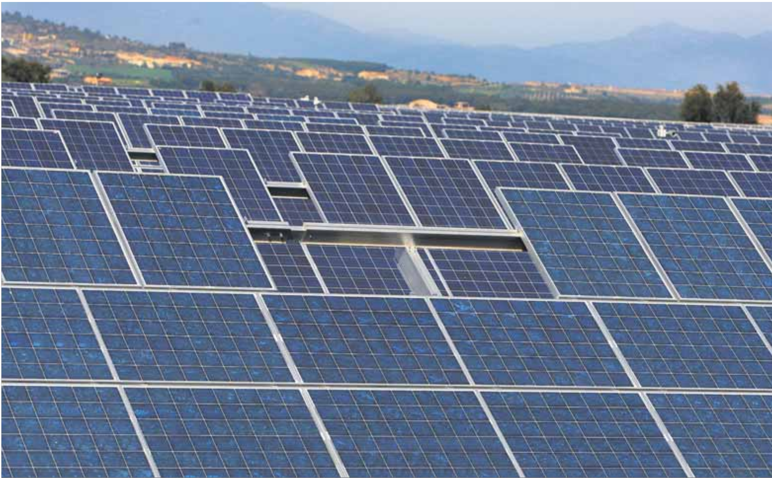
Plaques solars al parc fotovoltaic del municipi d'Ordís, a l'Alt Empordà, en una imatge d'arxiu