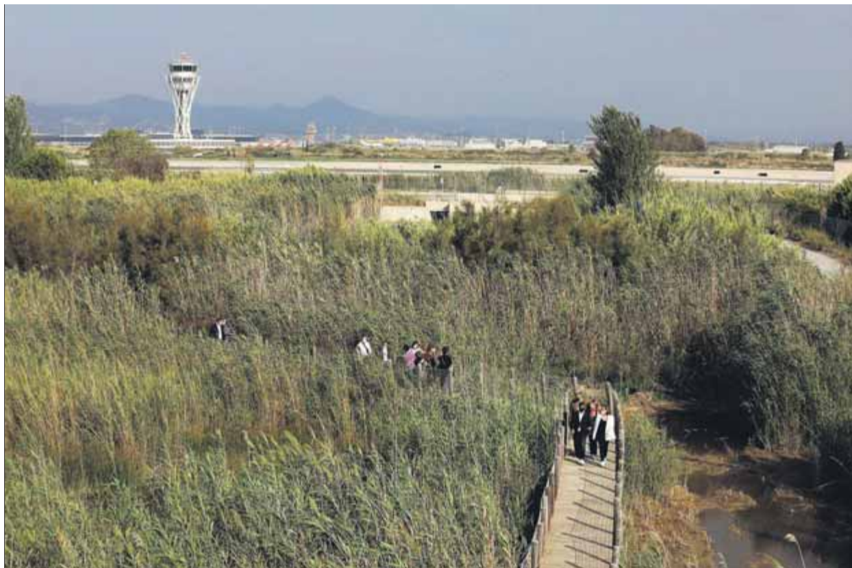
Vista de l'espai de la Ricarda, que es podria veure afectat per l'ampliació de l'aeroport del Prat, ara aparcada

Ahir, en tot cas, la portaveu del seu partit va recordar que va ser el mateix govern estatal el que va aturar l'ampliació, i va fer un pas més enllà assegurant que ERC "no està a favor d'ampliar l'aeroport, però sí de millorar la infraestructura". Segons Vilalta, hi ha "moltes alternatives que no impliquen trinxar el territori", ni anar contra el consens territorial ni contra la xarxa europea de protecció de la natura. "S'hi poden fer coses que no necessàriament inclouen l'ampliació", insistia, i assenyalava com a opcions millores en l'operativitat