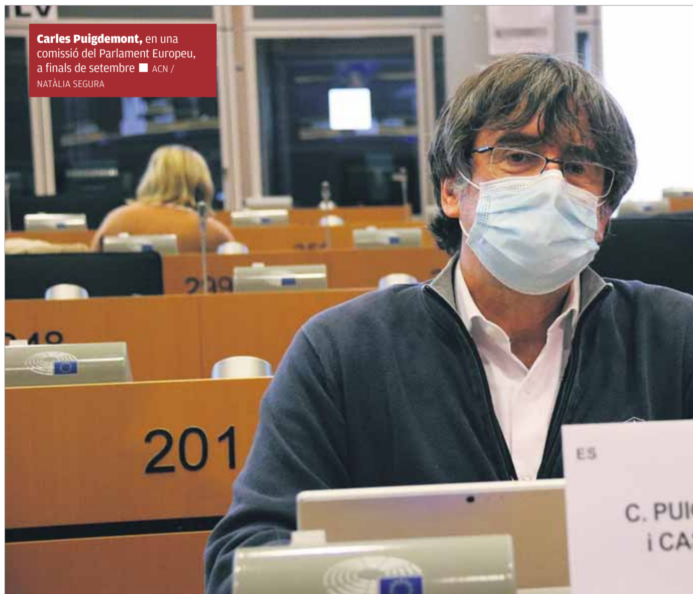
Carles Puigdemont , en una comissió del Parlament Europeu, a finals de setembre

L'eurocambra manté que la retirada de la immunitat va ser correcta i no veu necessari que els tres eurodiputats independentistes la conservin mentre es resolen les causes obertes a la justícia de la UE per les euroordres. En la darrera petició de cautelars, els serveis jurídics van re-