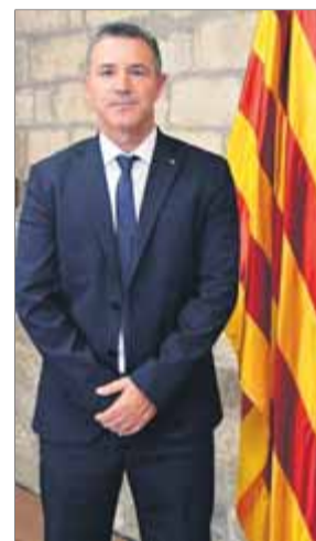
El delegat del govern a Portugal, Rui Reis

és valorar com es transmet Catalunya a la societat portuguesa, de manera objectiva i des d'un punt de vista acadèmic", justifica a El Punt Avui el delegat, Rui Reis, que destaca el paper crucial de la premsa en un país que ha mostrat sempre molt interès pel procés, tant en forma de peces informatives com d'articles d'opinió.