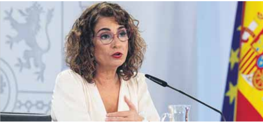
María Jesús Montero és la ministra d'Hisenda i arquitecta del pressupost del 2022