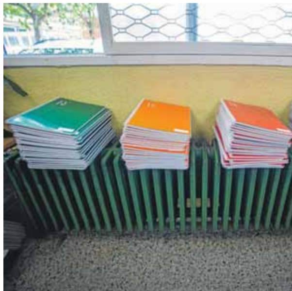
Les escoles i instituts han d'enviar les programacions didàctiques abans del dia 15 ■ QUIM PUIG

La GAIP va donar raó a l'entitat espanyolista pel que fa al seu dret a obtenir informació, però li va recomanar, vist el gran volum de documentació, que seleccionés un volum més manejable, com un mostreig aleatori. Establia també que els centres educatius enviessin directament les programacions al correu d'Hablamos Español, tot alertant del risc de col·lapsar-lo. L'entitat es