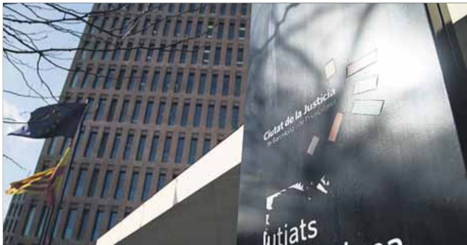
La Ciutat de la Justícia, on hi ha els jutjats de Barcelona, a la Gran Via ■ ORIOL DURAN

En la interlocutòria, la magistrada Carmen García hi exposa que cap responsable públic ha aclarit aquesta "contractació directa, tan opaca i al marge dels principis de publicitat i transparència", i hi afe-