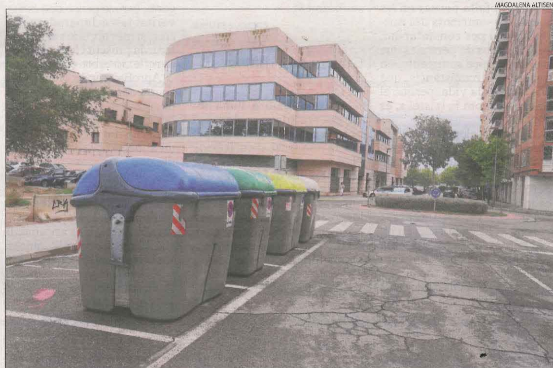
Contenidors al carrer Alcalde Pujol de Lleida, de categoria Especial entre els números 2 i 10.