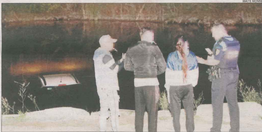
Els pares, ja canviats de roba, observen el cotxe encara submergit.

Ajuda || Escaladors del rocòdrom i un mosso fora de servei, vitals per treure els nens